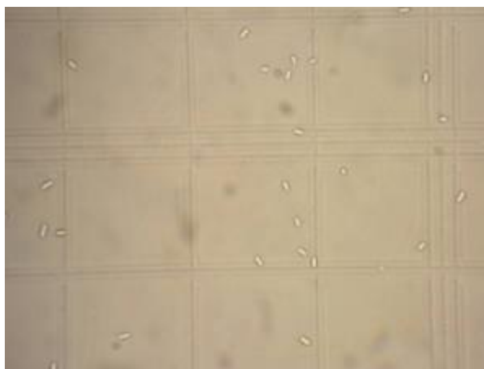
Slika 15. Spore gljive C. parasitica u mililitru otopine nakon 14. dana inokulacije izbrojane pomoću komorice za brojanje Improved Neubauer.

Spore pojedinih kultura gljive C. parasitica izbrojane su koristeći komoricu za brojanje Improved Neubauer. (Slika 15).