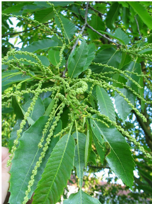
Slika 1. Muške rese pitomog kestena ( Castanea sativa Mill.)

Europski pitomi kesten ( Castanea sativa Mill.) pripada redu Fagales , porodici Fagaceae , rodu Castanea . Ostale značajne vrste roda Castanea su Castanea dentata Borkh. u Sjevernoj Americi, Castanea mollissima Blume. u Kini i Castanea crenata Sieb. u Japanu. Drvo kestena može narasti do 35 m visine. Kora debla u mladosti je glatka, a kako drvo stari, kora se uzdužno raspucava (Šilić, 1973). Listovi su duguljasti, eliptični i nazubljeni. Pitomi kesten je jednodomna biljka, što znači da se na istom stablu nalaze odvojeno i muški i ženski cvjetovi. Muški cvjetovi su u uspravnim resama (Slika 1), a ženski u donjem dijelu muških resa. Cvjetovi se pojavljuju početkom lipnja, kada su listovi potpuno razvijeni.