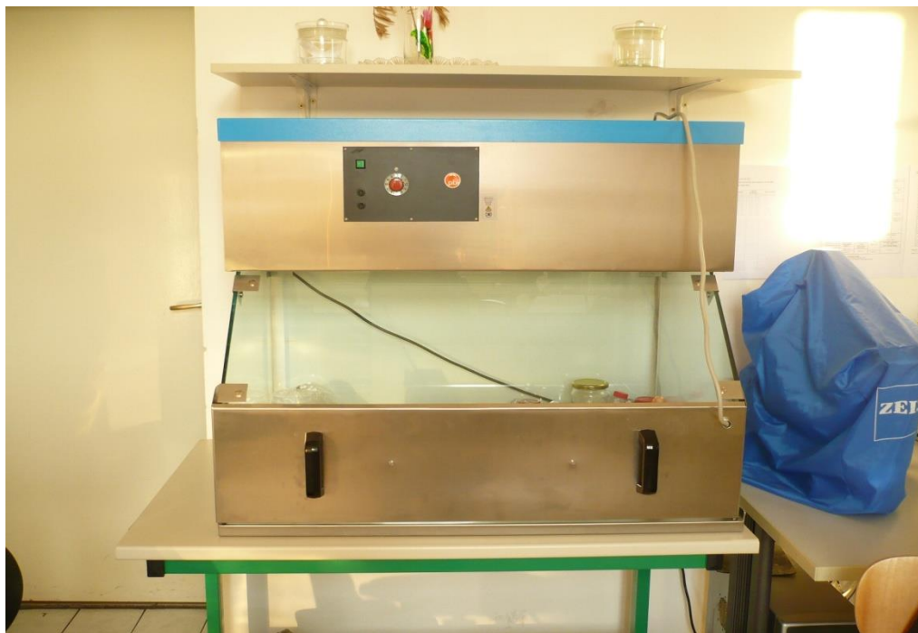
Slika 9. Laminar

Svi uzorci gljive C. parasitica su uzgajani u Petrijevim zdjelicama (Medicplast, promjer 6 ili 9 cm) na PDA (potato dextrose agar, Biolife) hranjivoj podlozi. PDA podloga se priprema prema uputama proizvođača: 42 g krumpirovog agara otopljeno je u 1 litri hladne destilirane vode te kuhano sve dok se agar nije otopio. Potom je agar autoklaviran 15 minuta na temperaturi od 121°C i atmosferi od 1 bara. Nakon autoklavanja i kratkog hlađenja, tekući topli agar izliven je (25 ml) u sterilne plastične Petrijeve zdjelice. Izlivanje hranjive podloge odvijalo se u prostoru steriliziranom UV svjetlom, tzv. laminaru (Slika 9) uz neprestano strujanje sterilnog zraka. Kada se agar u Petrijevkama ohladi i stvrdne na njega se mogu precjepljivati uzorci gljive.