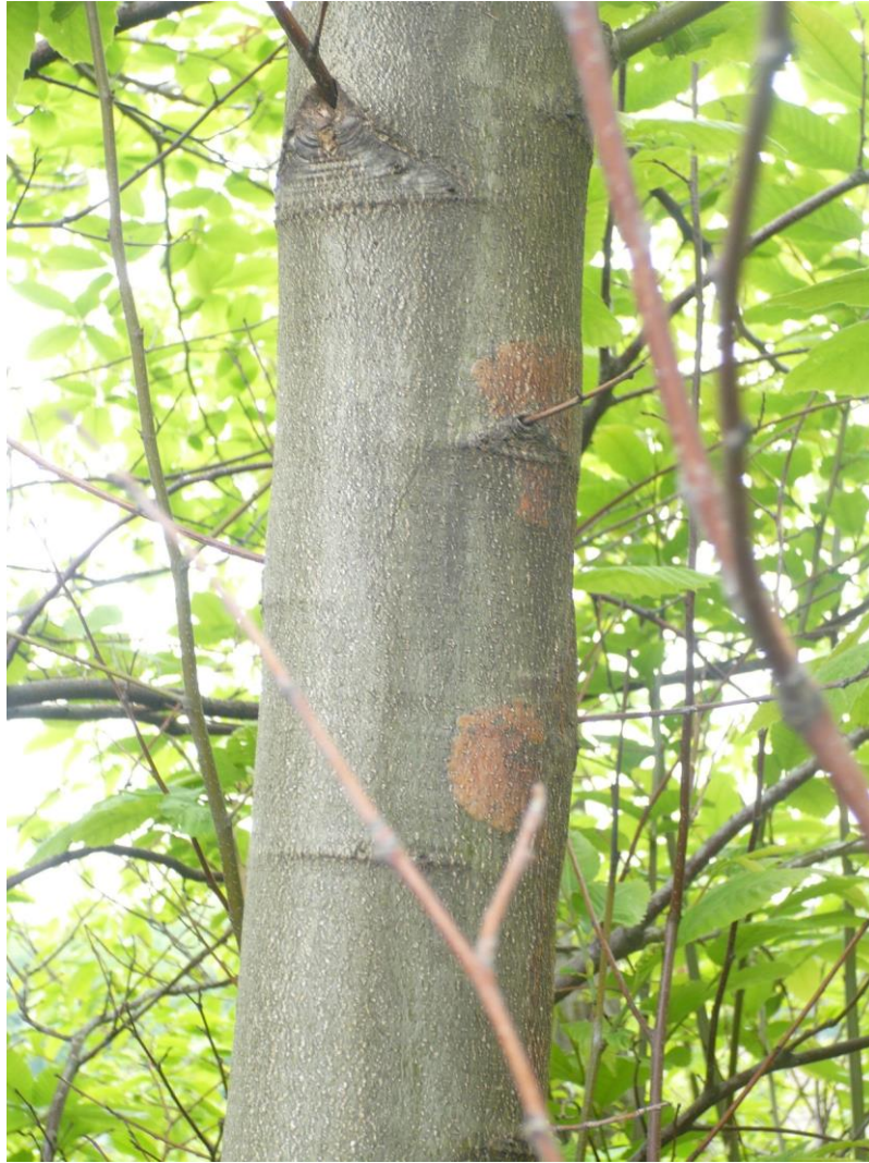
Slika 4. Početak razvijanja raka kore pitomog kestena na stablu kestena zaraženog patogenom gljivom Cryphonectria parasitica

Na kori u području rak rane lako se uočavaju plodna tijela gljive, narančaste ili crvenkaste boje (Slika 5). Micelij gljive vremenom probija sve do kambija gdje zaustavlja prohodnost provodnih elemenata i dio stabla iznad zaraze odumire (Robin i sur., 2009).