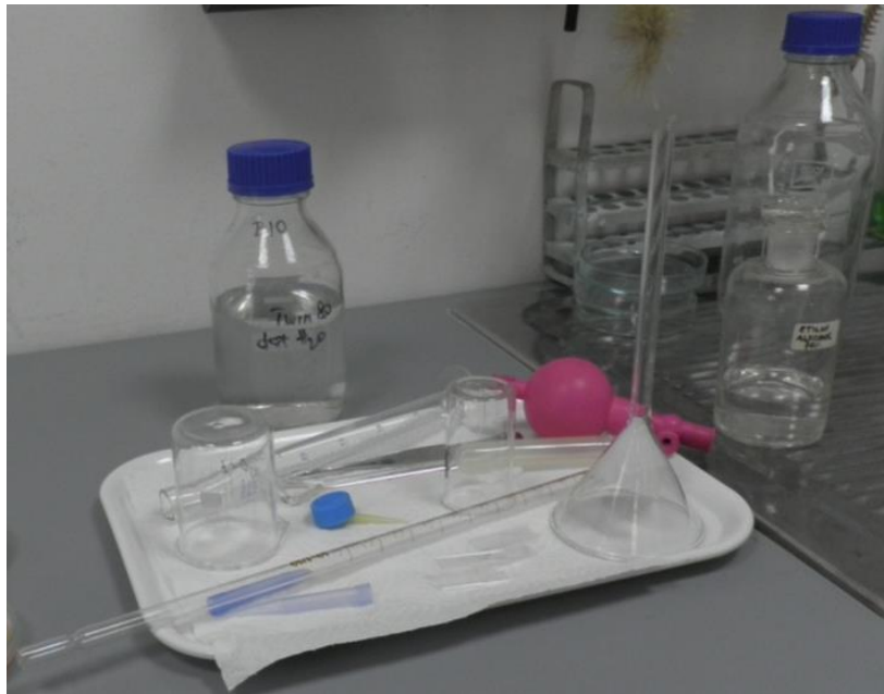
Slika 13. Pribor korišten u određivanju broja spora.