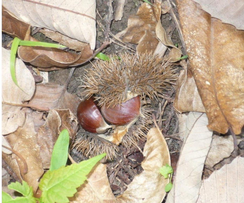
Slika 2. Plod pitomog kestena ( Castanea sativa Mill.)

Plod je kesten u ježolikom tobolcu, s najčešće tri ploda u jednom tobolcu (Slika 2), a godišnje daje do oko 200 kg plodova. Na površini su sjajni, polukuglasti i dozrijevaju početkom listopada (Domac, 1994).