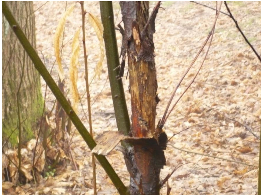
Slika 6. Rak kore pitomog kestena uzrokovan virulentnim sojem gljive C. parasitica

Fitopatogena gljiva Cryphonectria parasitica (Murr.) Barr unesena je početkom 20. stoljeća iz Azije u SAD i uništila je gotovo sve nasade američkog kestena Castanea dentata Borkh. U Europi je bolest prvi put zapažena 1938. godine u Italiji (Genova), odakle se proširila po cijeloj Europi i ozbiljno ugrozila sastojine europskog pitomog kestena C. sativa Mill. (Heiniger i Rigling, 1994; Krstin i sur., 2008). C. parasitica je slab patogen na azijskim vrstama kestena i smatra se da je najvjerojatnije iz Azije u Ameriku unesena upravo na stablima azijskih vrsta kestena (Heiniger i Rigling, 1994). Azijske vrste kestena Castanea mollissima i Castanea crenata su otporne na uzročnika bolesti, gljivu C. parasitica (Milgroom i Cortesi, 2004). Bolest je u Hrvatskoj zabilježena prvi puta 1955. godine te se vrlo brzo širila na sve kestenove sastojine u kojima je zabilježen veliki broj aktivnih rakova (Slika 6) uzrokovanih opasnim virulentnim sojem gljive C. parasitica (Novak-Agbaba, 2006).