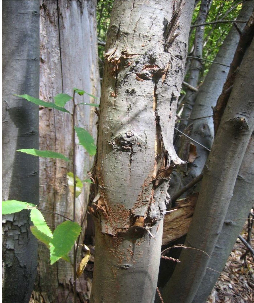
Slika 5. Plodna tijela gljive C. parasitica na stablu kestena