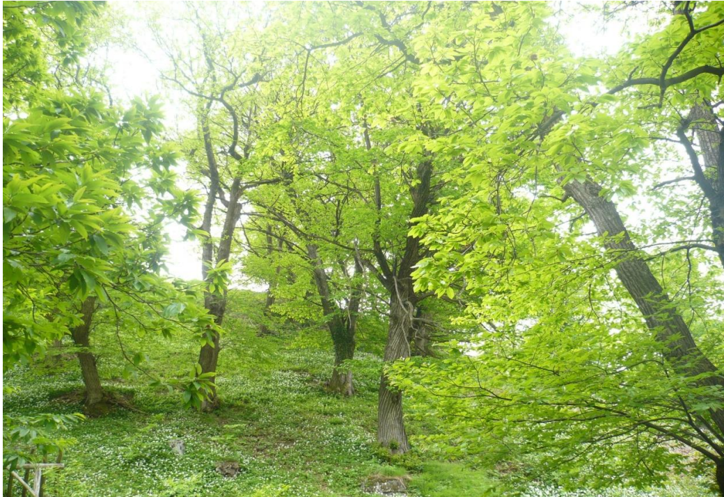
Slika 3. Stabla pitomog kestena ( Castanea sativa Mill.)