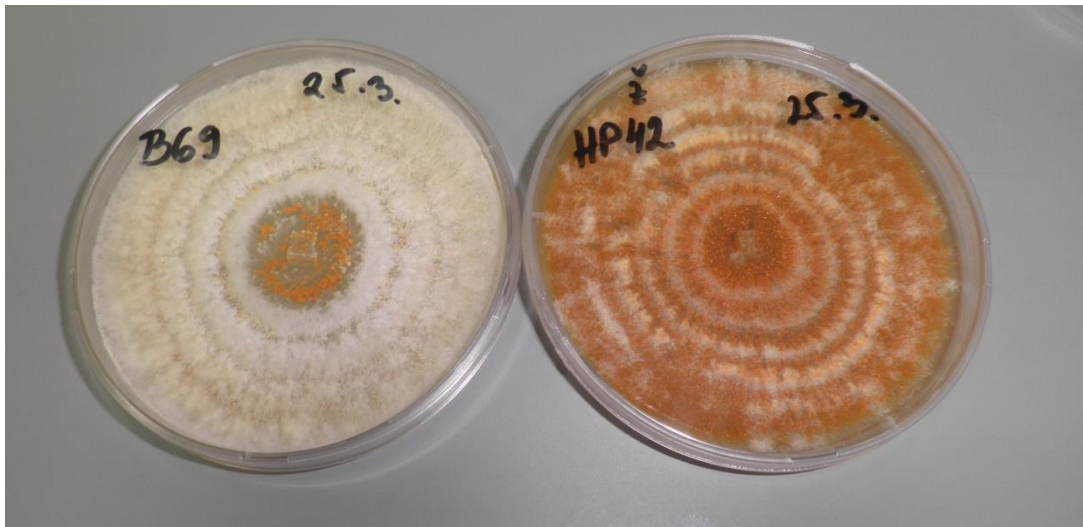
Slika 14. Hipovirulentni soj gljive (lijevo) i virulentni soj gljive (desno).

Budući da hipovirus smanjuje rast fitopatogene gljive C. parasitica , jedan od ciljeva bio je odrediti rast 20 (4 virulentna i 16 hipovirulentnih) izolata gljive in vitro prikupljenih sa slovenskog područja (Slika 14).