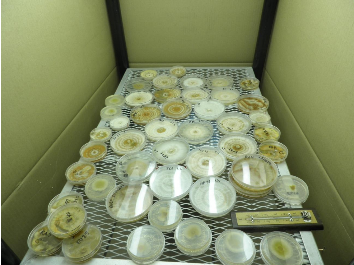
Slika 11. Uzgojna komora

uzgojnu komoru (Slika 11), gdje su rasli u uvjetima visokog intenziteta svjetlosti (2500 luxa) i pri temperaturi od 25 °C. Gljive su bile dnevno izložene 16 sati svjetlosti i 8 sati tami kroz razdoblje od 14 dana. Svi izolati gljive su uzgajani u tri replike.