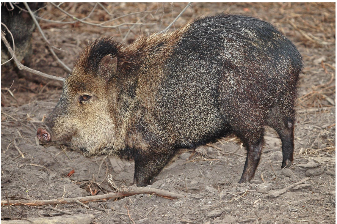
Slika 13. Pekarij ( Pecari tajacu ) (Web 18).

mužjaka može ili ne mora dati reproduktivnu prednost (Bissonette 1982; Byers i Bekoff 1981). Studije također pokazuju da dominantni mužjaci tvore dodatna partnerstva sa estrusnim ženka za koje brinu što je vrlo često u prirodi (Bissonette 1982; Byers i Bekoff 1981). Uloga ženkinog izbora nije još u potpunosti obrazložena jer podaci opažanja ukazuju na to da ženke ili snažno odbijaju mužjake koji smatraju neprikladni ili aktivno traže partnere za parenje. Predloženo je da dominantni mužjaci bi mogli primijeniti poliginiju u manjim stadima, no veća stada bi spriječila dominantne mužjake da izdvoje više slobodnih ženki što bi rezultiralo još više promiskuitetnijim sustavom (Packard et al. 1991).