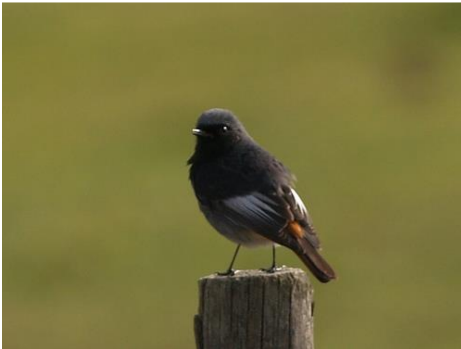
Slika 3. Planinska crvenrepka ( Phoenicurus ochruros ) je primjer seksualne monogamije (Web 9).