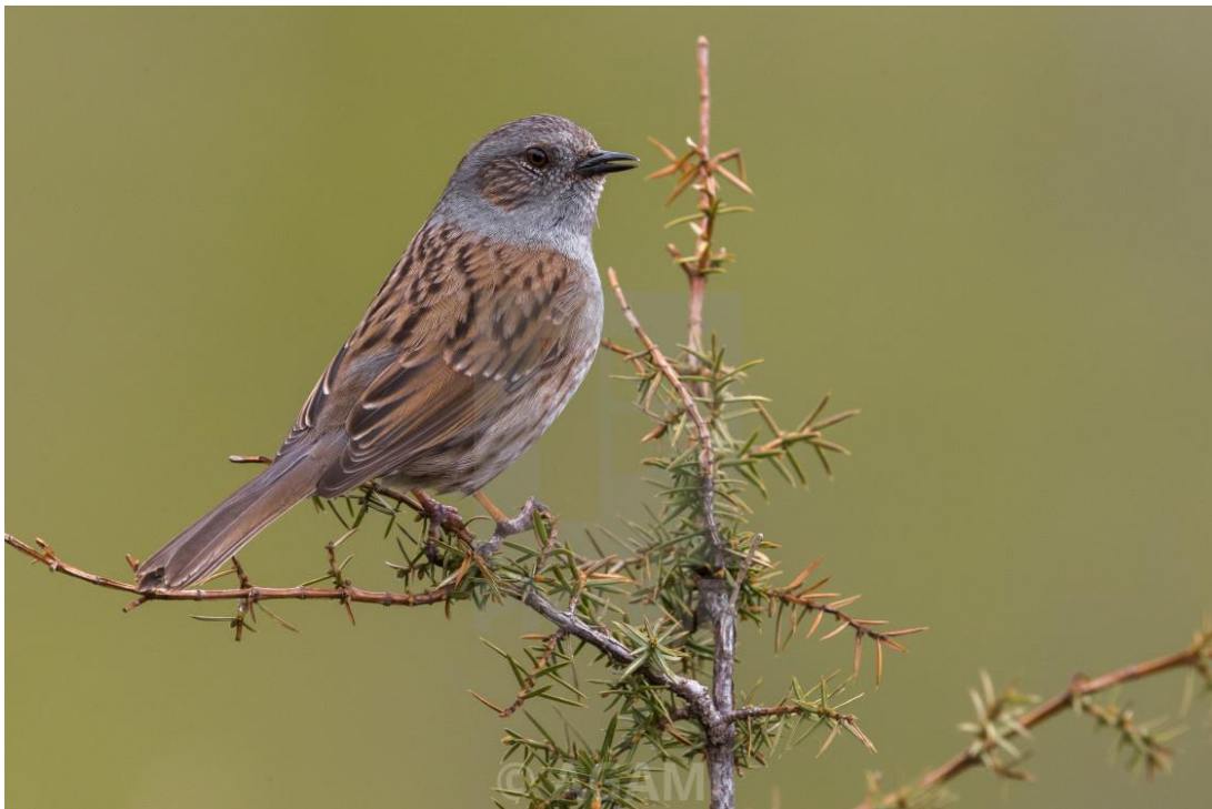
Slika 12. Sivi popić ( Prunella modularis ) (Web. 17).

sebe. S druge strane, ženke potiču kopulacije od podređenih mužjaka u nadi da će ostati i brinuti se za mlade, dok dominantni mužjaci pokušavaju zaštititi ženke i otjerati podređene mužjake kako ne bi dijelili gnijezda s njima. Konflikti koji nastaju mogu imati različite ishode, ponekad dosegnu „mrtvu točku“ te tada dva mužjaka dijele dvije ženke. U tom slučaju dominantni mužjak ne može otjerati podređenog mužjaka i prisvojiti obje ženke i također dominantna ženka ne može otjerati podređenu ženku i prisvojiti oba mužjaka.