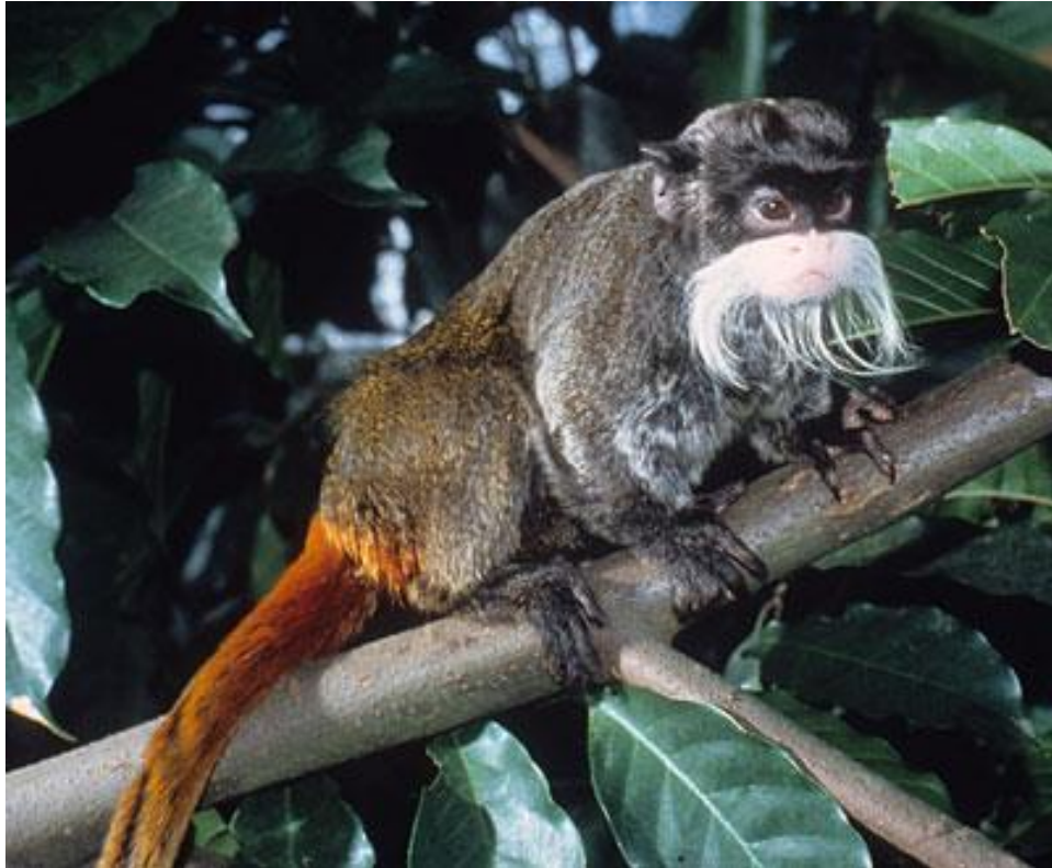
Slika 11. Majmun tamarin ( Saguinus imperator ) (Web 16).