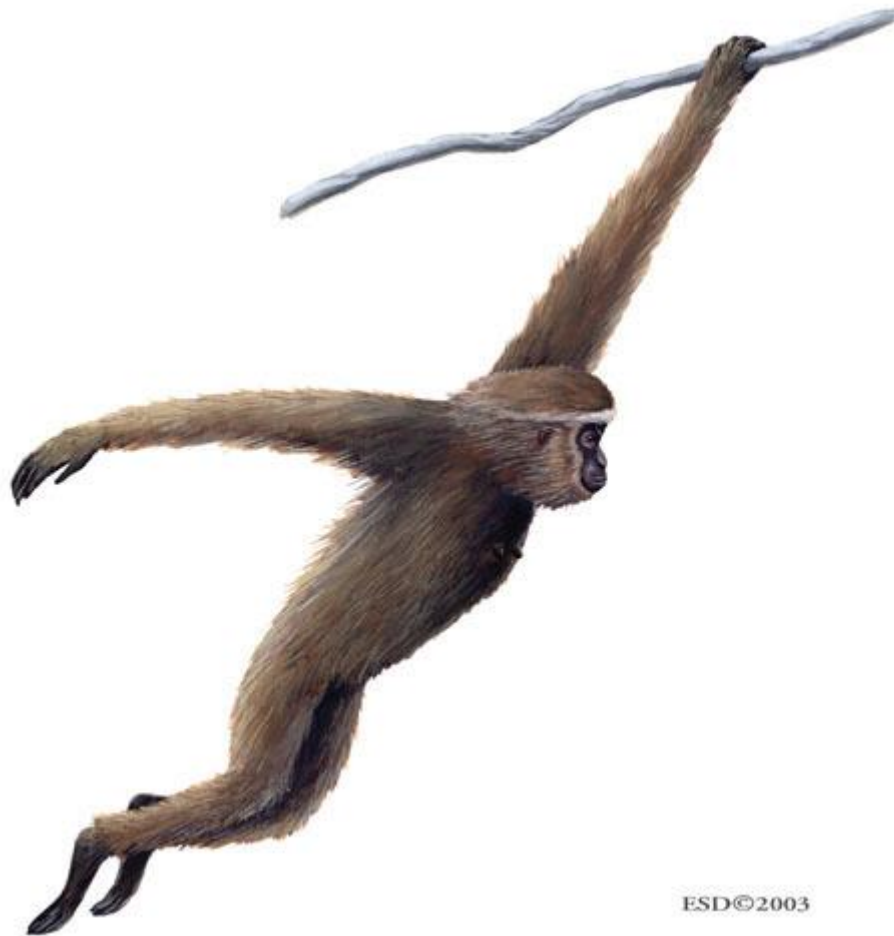
Slika 4. Gibon (Hylobatidae) (Web 10)