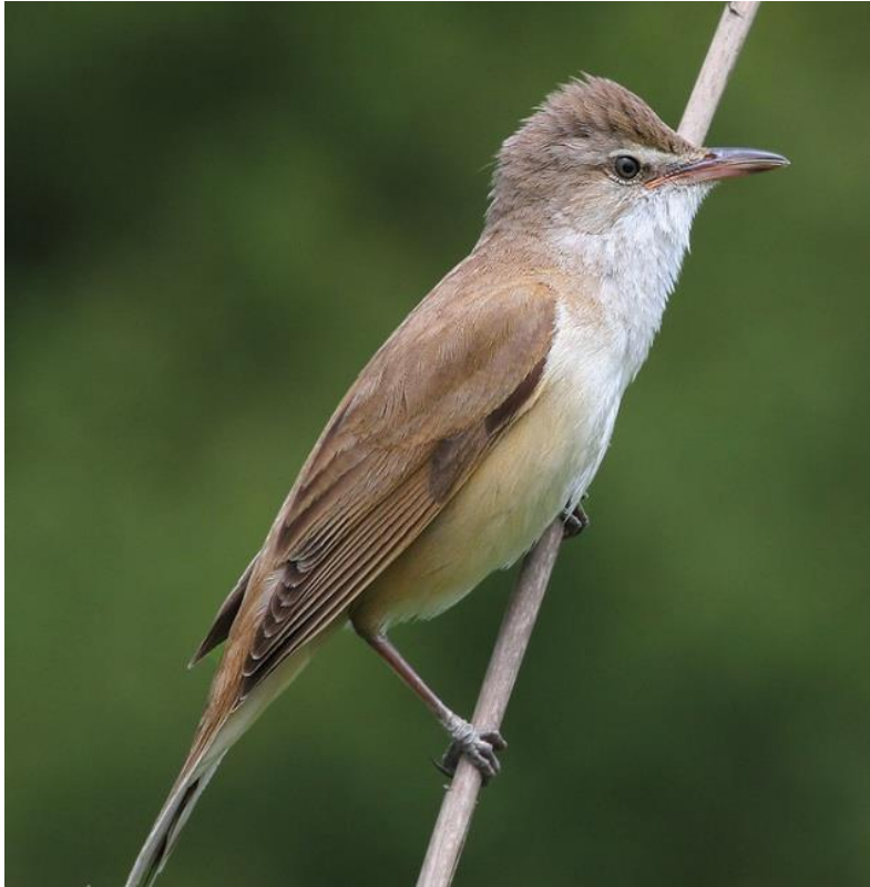
Slika 7. Veliki trstenjak ( Acrocephalus arundinaceus ) (Web 12).