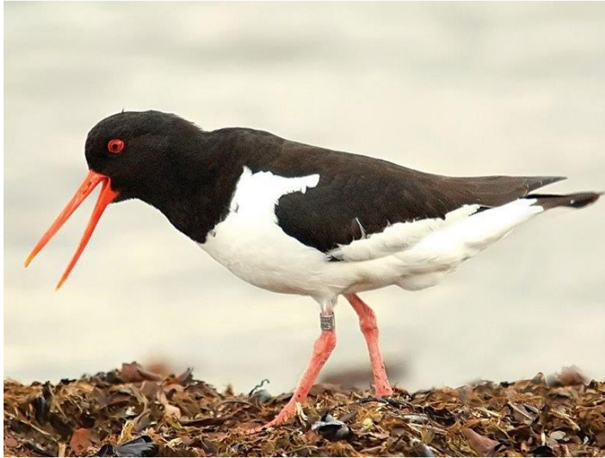
Slika 1. Oštrigar ( Heematopus ostralegus ) (Web 7).