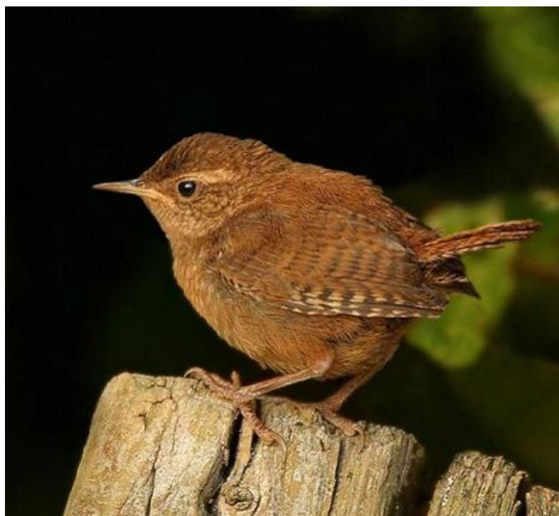
Slika 5. Carić ( Cistothorus palustris ) (Web 11).

Govoreći o poliginiji nameće se pitanje zašto bi neka ženka pristala na nju te postoje dva razloga koji se smatraju prihvatljivim. Prvi je razlog taj da je ženka na to prisiljena jer mužjak kontrolira sva mjesta za gniježđenje, a drugi da je veća korist nego cijena. Na primjer kod vrste carić ( Cistothorus palustris ) ženke se odlučuju pariti s mužjacima koji su se već parili tek nakon što su se svi slobodni mužjaci već parili (Leonard i Picman 1987).