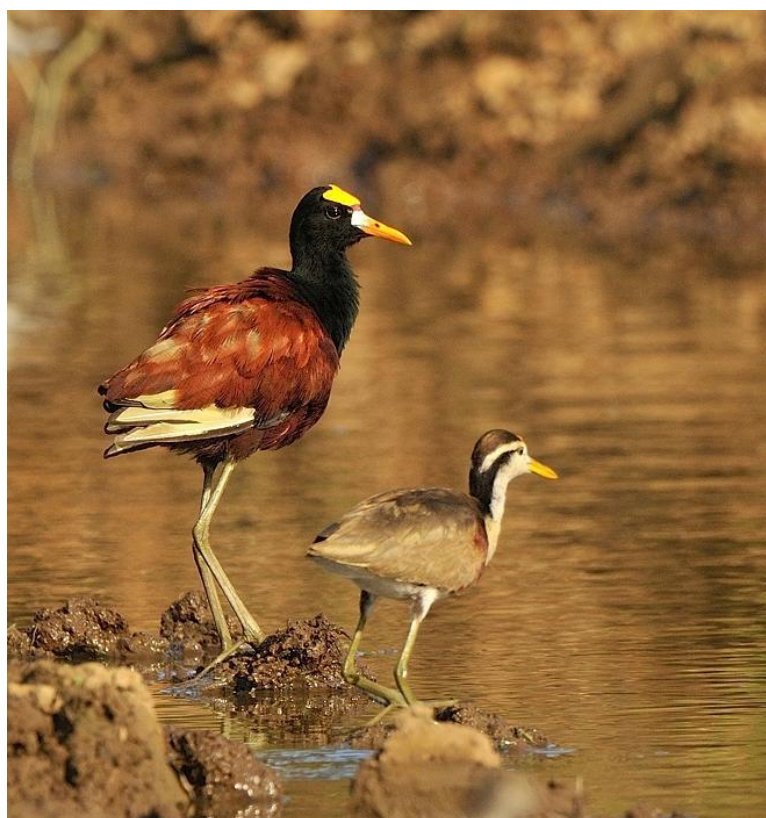
Slika 10. Lokvanjski trkavac ( Jacana spinosa ) (Web 15).