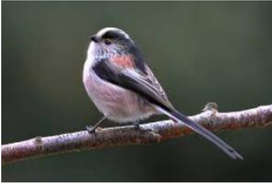
Slika 2. Dugorepa sjenica ( Aegithalos caudatus ) je primjer društvene monogamije (Web 8).