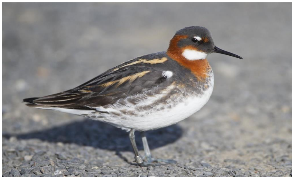
Slika 9. Tankokljuna lisonoga ( Phalaropus lobatus ) (Web 14).

tek postepeno pokazuju interes. Često se događa da nakon što ženka ostavi mužjaka da brine o mladima ona nađe novog mužjaka i položi nova jaja. Gnijezdo se nalazi obično na zemlji u niskoj vegetaciji u blizini vode.