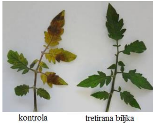
Slika 3. Primjer tretiranja lišća rajčice gljivicom Trichoderma harzianum u svrhu zaštite od patogene gljivice Botrytis cinerea (Web 3).