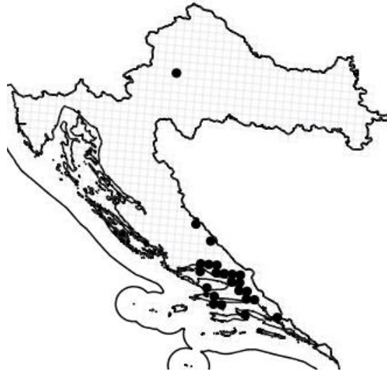
Slika 9. Rasprostranjenost vrste Campanula portenschlagiana Roem. et Schult. u Hrvatskoj

Portenschlagova zvončika (Slika 10) je busenasta trajnica, hemikriptofit, uglavnom gola, sa uspravnim, penjajućim, puzećim ili visećim stabljikama koje dosežu visinu 15 - 20 (- 40) cm. Listovi su poluokrugli do okruglasto srcasti, valovitih ili sitno nazubljenih rubova plojke, s peteljkama dugim do 10 cm. Cvjetovi su brojni te čine bogate, razgranate, rahle gronje ili metlice, a cvatnja traje od svibnja do srpnja. Vjenčić je uspravno, ljevčasto zvončast upadljive plavoljubičaste boje (Nikolić i sur. 2015). Prema najnovijim istraživanjima, ta se vrsta najviše razlikuje od svih svojih srodnika, što se vidi u građi cvijeta (vjenčići nisu širokozvezdasti, već zvonasti), te se čini da je nastao na masivu Biokova (Kovačić 2006).