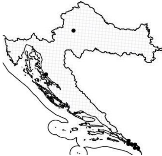
Slika 11. Rasprostranjenost vrste Campanula poscharskyana Degen u Hrvatskoj

Busenasta vrsta je prileglo dlakava trajnica i hemikriptofit, te posjeduje brojne rahle stabljike visine 15 - 20 (- 30) cm. Listovi stabljike su manji, u mladosti gusto sivo čekinjasti, kasnije manje dlakavi (rijetko goli), nazubljeni ili cjeloviti; dok su listovi čaške lancetasti, bijelo čekinjasto-trepavičasti. Vjenčić (Slika 12) je modroljubičast, široko ljevkast (zvjezdast), a tobolac je polukuglast i otvara se trima porama. Cvjeta uglavnom tijekom lipnja i srpnja (Nikolić i sur. 2015).