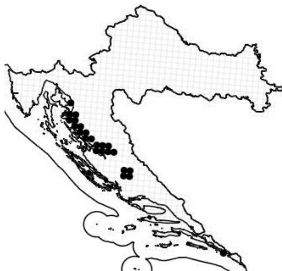
Slika 3. Rasprostranjenost vrste Campanula fenestrellata Feer ssp. fenestrellata u Hrvatskoj

Prozorska zvončika je stenoendem. Rasprostranjena je duž čitavog srednjeg i južnog Velebita sve do Paklenice, ulazeći u kanjone rijeka Zrmanje i Krke (Slika 3) (Kovačić 2006, Web1). Uglavnom obitava na vapnenačkim stijenama, liticama i kamenim blokovima unutar pojasa bukovih šuma, na nadmorskoj visini od 3 do 1300 m (Nikolić i sur. 2015). Preferira vlažnu, ali dobro podnosi i sušnu, bogatu pješčanu ilovaču, uspijeva i na siromašnim tlima (Web 3).