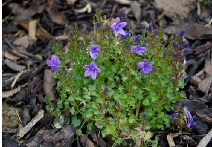
Slika 10. Campanula portenschlagiana Roem. et Schult. (Portenschlagova zvončika)