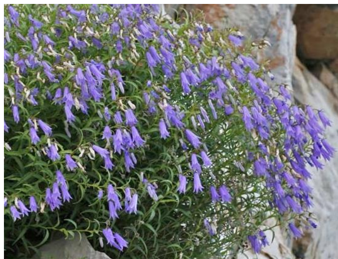
Slika 16. Campanula tommasiniana C. Koch (Tomasinijeva zvončika)

Trajnica je, stabljike su brojne i uspravne sa visinom 20 - 30 (- 40) cm. Kao i kod većine ostalih vrsta i u ovom slučaju prisutna je heterofilija: bazalni listovi vrlo su mali, okruglo-jajasti ili srcasti, u vrijeme cvatnje, koja se odvija od srpnja do rujna, rijetko su prisutni. Donji listovi stabljike imaju peteljke, eliptični su do rombično-jajoliki, nazubljenih rubova; dok su gornji listovi manji, lancetasti i sjedeći (Nikolić i sur. 2015). Vjenčić (Slika 16) je svjetloplav i cjevasto zvončast, a tobolci su viseći što je i najočiglednija razlika u usporedbi sa waldsteinovom zvončikom, s kojom su često miješali ovu vrstu, koja posjeduje široko otvoreni zvjezdasti vjenčić, te uspravne tobolce (Kovačić i Nikolić 2006).