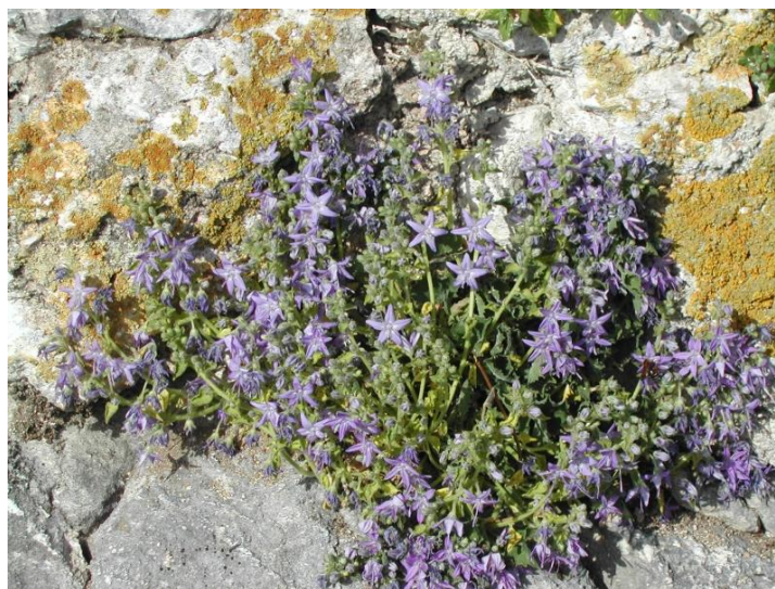
Slika 6. Campanula fenestrellata Feer ssp. istriaca (istarska zvončika)

Višegodišnja je zelen koja cvjeta tijekom lipnja i srpnja, hemikriptofit, cijela je dlakava. Bazalni su listovi grubo nazubljeni, sa do 11 cm dugim peteljka, dok su listovi stabljike jajoliko lancetasti ili okruglasti, pri dnu odrezani ili sroljici. Vjenčić je koturast, svjetloplav (Slika 6), do 20 mm u promjeru i do 8 mm visine. Tobolac posjeduje mnogobrojne sitne izduženo eliptične, crvenosmeđe, sjajne sjemenke (Nikolić i sur. 2015). U prirodnim se uvjetima razmnožava sjemenkama, a u kulturi može vegetativno pomoću bazalnih reznica (u proljeće) - vrsta formira lisne rozete, te se dio novonastale rozete odvoji od matične biljke (Horvatović 2016).