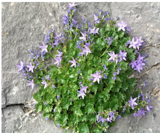
Slika 4. Campanula fenestrellata Feer ssp. fenestrellata (prozorska zvončika)