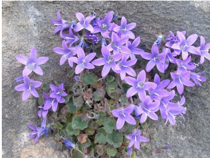
Slika 14. Campanula teutana Bogdanović et Brullo (Teutin zvončić)

tamnosmeđe boje. Na temelju svoje morfologije, a prvenstveno zvonastog tipa vjenčića i općeg izgleda biljke, teutina zvončika najsličnija je portenschlagovoj zvončiki, te iako morfološki slične, ove dvije vrste nisu filogenetski srodne (Nikolić i sur. 2015).