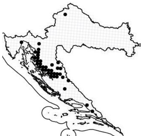
Slika 17. Rasprostranjenost vrste Campanula waldsteiniana Roem. et Schult. u Hrvatskoj

Osim na području hrvatske, dolazi i u susjednoj BiH i Sloveniji, a rasprostranjenost u Hrvatskoj se svodi na planinsko područje Dinarida - Velebit, Poštak, Dinara (Slika 17). Ova vrsta je vitalna na svojim prirodnim staništima, gdje raste u visinskom rasponu od 500 do 1600 m na područjima zaklonjenim od vjetrova, često u bukovim šumama (Nikolić i sur. 2015).