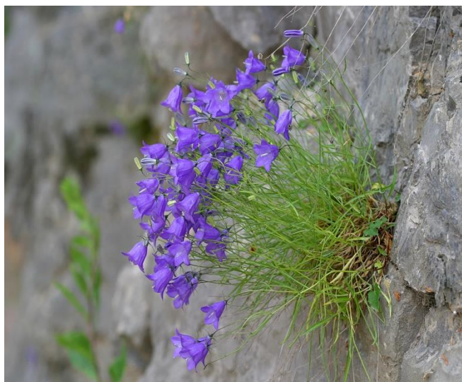
Slika 8. Campanula justiniana Witasek (Justinov zvončić)