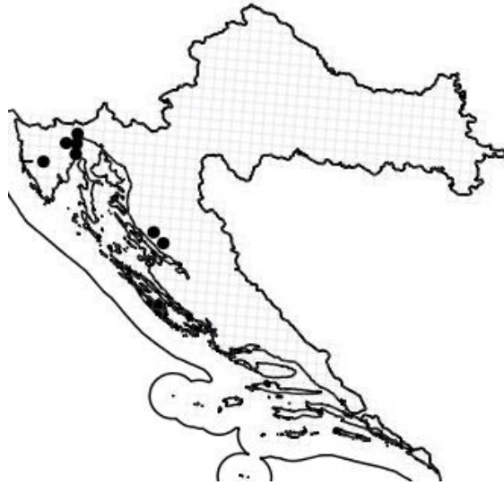
Slika 15. Rasprostranjenost vrste Campanula tommasiniana C. Koch u Hrvatskoj

Trajnica je, stabljike su brojne i uspravne sa visinom 20 - 30 (- 40) cm. Kao i kod većine ostalih vrsta i u ovom slučaju prisutna je heterofilija: bazalni listovi vrlo su mali, okruglo-jajasti ili srcasti, u vrijeme cvatnje, koja se odvija od srpnja do rujna, rijetko su prisutni. Donji listovi stabljike imaju peteljke, eliptični su do rombično-jajoliki, nazubljenih rubova; dok su gornji listovi manji, lancetasti i sjedeći (Nikolić i sur. 2015). Vjenčić (Slika 16) je svjetloplav i cjevasto zvončast, a tobolci su viseći što je i najočiglednija razlika u usporedbi sa waldsteinovom zvončikom, s kojom su često miješali ovu vrstu, koja posjeduje široko otvoreni zvjezdasti vjenčić, te uspravne tobolce (Kovačić i Nikolić 2006).