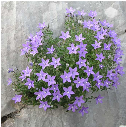
Slika 18. Campanula waldsteiniana Roem. et Schult. (Waldsteinova zvončika)

koturasta oblika, visok 6 mm. Plod je uspravan mnogosjemeni tobolac, sa sitnim i golim sjemenkama svjetlosmeđe boje (Nikolić i sur. 2015).