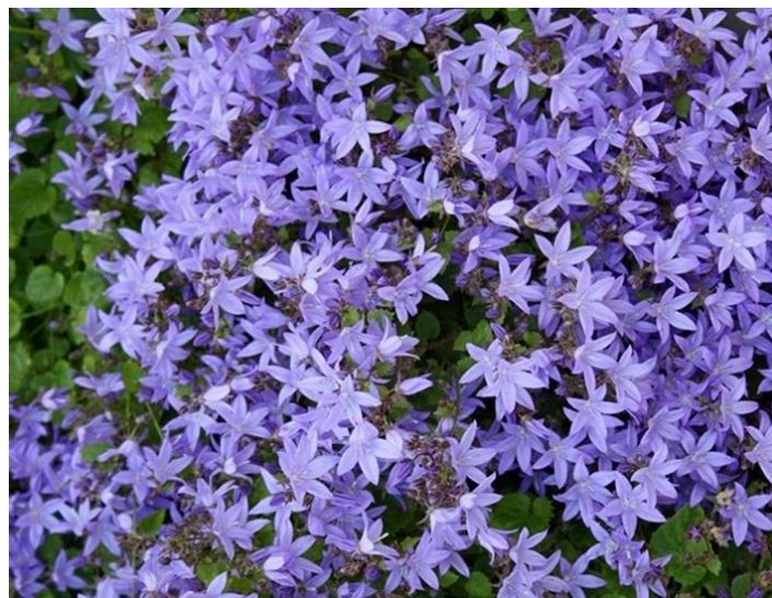
Slika 12. Campanula poscharskyana Degen (Poscharskyev zvončić) (Izvor: Web7)

Busenasta vrsta je prileglo dlakava trajnica i hemikriptofit, te posjeduje brojne rahle stabljike visine 15 - 20 (- 30) cm. Listovi stabljike su manji, u mladosti gusto sivo čekinjasti, kasnije manje dlakavi (rijetko goli), nazubljeni ili cjeloviti; dok su listovi čaške lancetasti, bijelo čekinjasto-trepavičasti. Vjenčić (Slika 12) je modroljubičast, široko ljevkast (zvjezdast), a tobolac je polukuglast i otvara se trima porama. Cvjeta uglavnom tijekom lipnja i srpnja (Nikolić i sur. 2015).