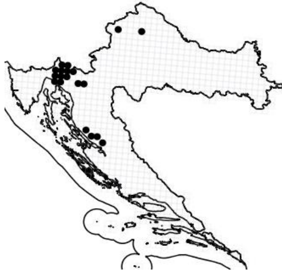
Slika 1. Rasprostranjenost vrste Campanula cespitosa Scop. u Hrvatskoj

Trajnica je, hemikriptofit (biljke s pupovima neposredno iznad tla, preživljavaju nepovoljne uvjete zaštićeni tkivom), te raste u gustim busenovima brojnih izdanaka, od kojih svaki nosi jedan ili nekoliko cvjetova sa visećim pupovima (Slika 2). Cvjeta u periodu od lipnja do kolovoza, a neki primjeri i do rujna. Vjenčić zvonolika oblika, nježne plave boje dug je (10 -) 13 - 16 (- 18) mm, te je sužen na području usta, što ga razlikuje od vrste C.cochlearifolia Lam., koja ne posjeduje suženje. Iz glatke plodnice razvija se viseći, kožast tobolac konusnog oblika, dug 3 - 6 mm. Podanak je tanak i razgranjen. Bazalni listovi su jajoliki do rombični, klinasti pri bazi plojke, sa peteljkom koja se blago okriljena spušta niz stabljiku. Stabljični listovi su elipsasti do lancetalni, razmaknuto pilasti (Nikolić i sur. 2015).