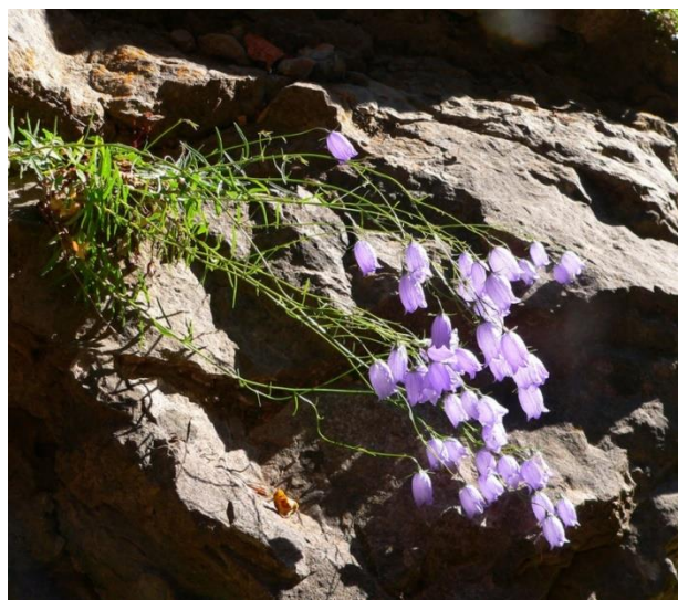
Slika 2. Campanula cespitosa Scop. (busenasta zvončika)

Trajnica je, hemikriptofit (biljke s pupovima neposredno iznad tla, preživljavaju nepovoljne uvjete zaštićeni tkivom), te raste u gustim busenovima brojnih izdanaka, od kojih svaki nosi jedan ili nekoliko cvjetova sa visećim pupovima (Slika 2). Cvjeta u periodu od lipnja do kolovoza, a neki primjeri i do rujna. Vjenčić zvonolika oblika, nježne plave boje dug je (10 -) 13 - 16 (- 18) mm, te je sužen na području usta, što ga razlikuje od vrste C.cochlearifolia Lam., koja ne posjeduje suženje. Iz glatke plodnice razvija se viseći, kožast tobolac konusnog oblika, dug 3 - 6 mm. Podanak je tanak i razgranjen. Bazalni listovi su jajoliki do rombični, klinasti pri bazi plojke, sa peteljkom koja se blago okriljena spušta niz stabljiku. Stabljični listovi su elipsasti do lancetalni, razmaknuto pilasti (Nikolić i sur. 2015).