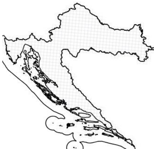
Slika 13. Rasprostranjenost vrste Campanula teutana Bogdanović et Brullo u Hrvatskoj

Populacija ove vrste broji oko 250 jedinki koje rastu na jednom jedinom lokalitetu na Visu, u okolici mjesta Oključina (Slika 13). Većina primjeraka raste u teško pristupačnim pukotinama okomitih stijena koje su okrenute prema sjeveru te imaju nešto više sjene i vlage, te iako takva staništa nisu pod utjecajem čovjeka, vrsta se smatra ugroženom (Nikolić i sur. 2015).