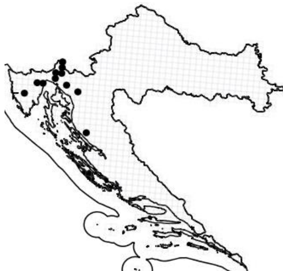
Slika 7. Rasprostranjenost vrste Campanula justiniana Witasek u Hrvatskoj

Vrsta je rasprostranjena u Sloveniji, te na planinama sjeverozapadne Hrvatske: Snježnik, Obruč, Risnjak, Burni Bitoraj, Bijele stijene, Suhi vrh, te istočne padine Učke (Slika 7). Nastanjuje pukotine vapnenačkih stijena ili kamenjare u gorskom pojasu (Nikolić i sur. 2015).