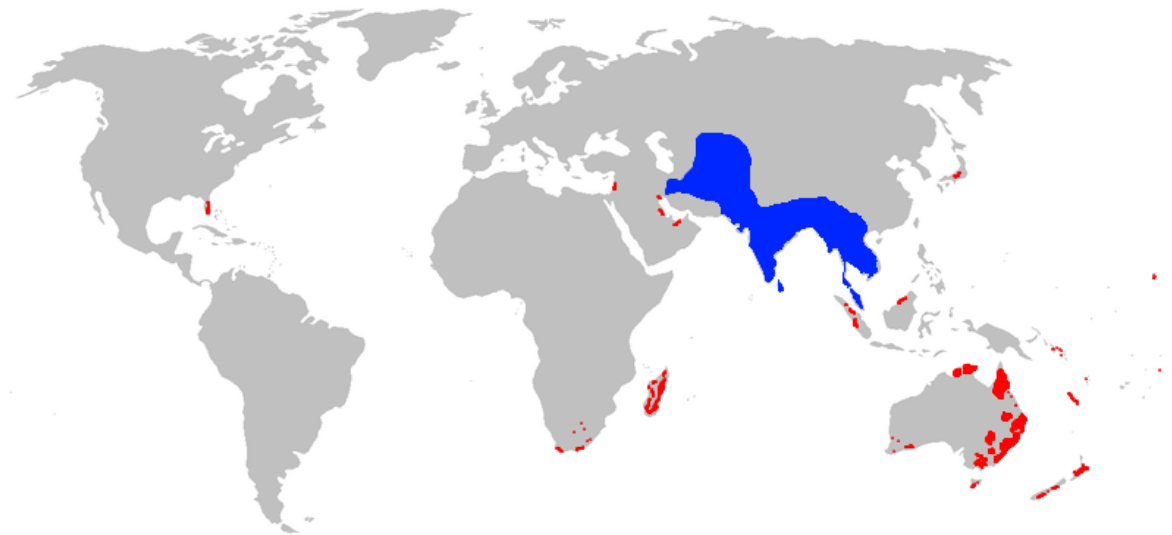
Slika 3. Područje rasprostranjenosti Acridotheres tristis , plava boja-nativno područje, crvena boja-introductory područje (Web 3.)

Ptice uzimaju više faktora u obzir kada odabiru svoj prostor za boravak ili gniježđenje. Faktori su vegetacija područja, količina dostupne hrane za njih i prisustvo predatora. Područje koje ptice odabiru također ovisi i o starosti jedinke ili o sezoni u godini. Na primjer, izglele ptice koje prežive do starije dobi, dobro poznaju svoj okoliš i znaju da je povoljan za gniježđenje, dok starije jedinke imaju iskustva u drugim područjima za gniježđenje. Mnoge ptice koriste tu informaciju kako bi odredili lokaciju za gniježđenje. Također sakupljaju informacije kako druge ptice gnijezde (Part i Doligez 2003).