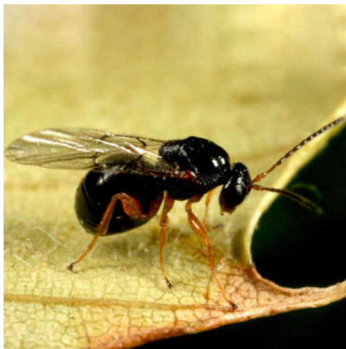
Slika 11. Odrasla jedinka ose šiškariće (Web 11)

Kestenova osa šiškarića dolazi iz porodice Cynipidae, a porijeklom je iz Kine. U Europi je prvi puta zabilježena 2002. godine, a u Hrvatskoj se pojavila 2010. godine. Ova vrsta je vrlo invazivni nametnik na vrstama iz roda Castanea . Naziv šiškarića dobila je zbog stvaranja šiški na listovima i izbojcima pitomog kestena. Ova vrsta je monofagna i razmnožava se jednom godišnje i to partenogenetski. Odrasla ženka veličine je 2,5 – 3 mm, te ima crno tijelo i smeđe noge (Slika 11). Životni vijek odrasle ženke je vrlo kratak, oko 10 dana. Jajašca su bijele boje i polaže ih u pupove kestena, najčešće 30-40 jaja po pupu, a odlaganje se odvija od sredine lipnja do kraja srpnja. Nakon otprilike mjesec dana iz jajašaca izlažu se ličinke (Slika 11) koje prezimljavaju unutar pupa i tek u proljeće počinju s rastom. U proljeće s početkom rasta pupa, ličinke potiču rast „šiške“. Šiške mogu biti zelene ili ružičaste boje i veličine 0,5 – 4 cm. Unutar šiški postepeno se razvijaju ženke ose koje izlaze van, tijekom lipnja i srpnja, kroz izlazne rupe koje se mogu jasno vidjeti. I tako se nastavlja krug širenja i razmnožavanja jer odrasle jedinke odlažu jaja u pupove. Osa šiškarića može se širiti aktivno i pasivno. Aktivno se širi letom, a pasivno transportom i to najčešće zaraženim sadnicama (Matošević, 2012).