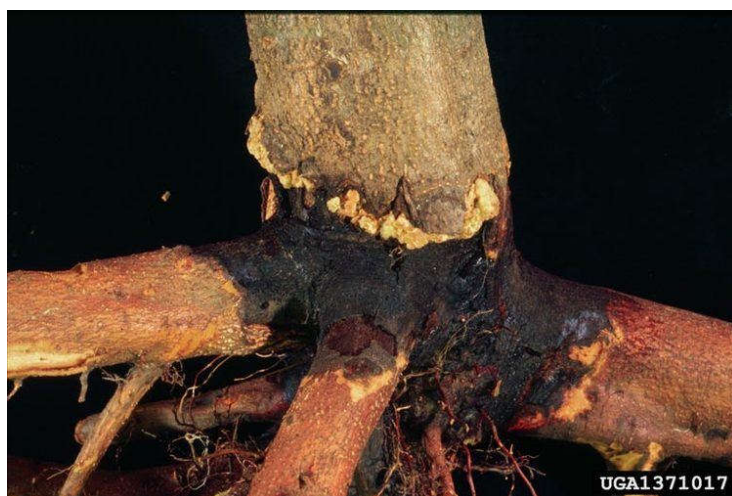
Slika 8. Nekroze na korijenu pitomog kestena prouzročene tintnom bolesti (Web 8)