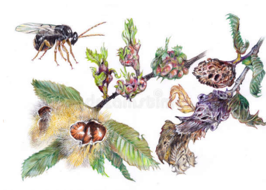
Slika 13. Ilustracija ose šiškarice, pupova i napuštenih šiški (Web 12)

Osa šiškarica svojim napadom na pitomi kesten dovodi do smanjenja lisnih površina zbog prisutnosti šiški, a time i do onemogućavanja rasta izbojaka (Slika 13). U konačnici dolazi i do smanjenja količine uroda i to 50 – 70%. Ukoliko dođe do napada na mladu biljku, može doći i do njenog ugibanja. Šiške također smanjuju fotosintetsku površinu i nakon višegodišnjih napada smanjuje se vitalnost samih stabala (Matošević i sur. 2010).