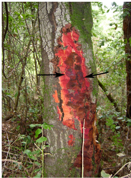
Slika 9. Nekroze na stablu koje uzrokuje vrsta P. ramorum (Web 9)

Ova bolest, kao što i sam naziv govori, prvenstveno zahvaća stabla hrasta, no uočena je i na pitomome kestenu. Uzročnik je također iz roda Phytophthora , a riječ je o P. ramorum . Simptomi bolesti su crne rakaste tvorevine na deblu iz kojih izlazi tamnocrveni iscjedak (Slika 9 i 10 ) i nekroze na listovima, koje na kraju dovode do sušenja i umiranja stabla. Bolest je u Europu došla iz Sjeverne Amerike, a glavnim vektorom smatra se čovjek. Trenutno jedini način zaštite od širenja ove bolesti je stavljanje zaraženog područja u karantenu. Na taj način se sprječava širenje na druge vrste, a one koje su zaražene se u potpunosti uništavaju (Davidson i sur. 2003).