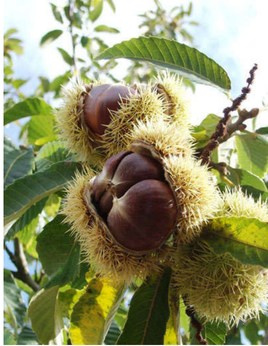
Slika 2. Plod pitomog kestena ( Castanea sativa Mill.) (Web 2)