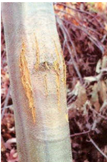
Slika 4. Rak kore pitomog kestena (Web 4)