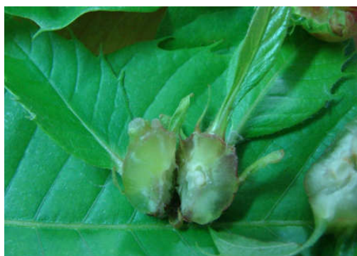
Slika 12. Ličinke ose šiškarice unutar šiške (Web 12)