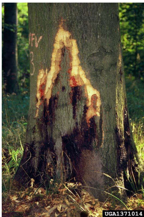
Slika 7. Stablo pitomog kestena s tamnim nekrozama tintne bolesti (Web 7)