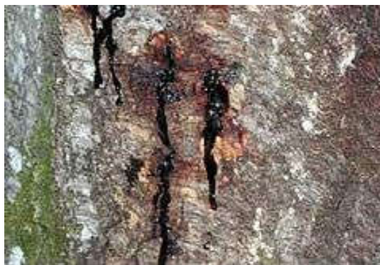
Slika 10. Tamnocrveni iscjedak koji uzrokuje vrsta P. ramorum (Web 10)