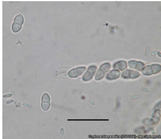
Slika 3. Askus i askospore vrste C. parasitica (Web 3)

vjetrom. Smatra se da vrstu C. parasitica , osim vjetra i kukca, može širiti i čovjek. Kada spore naiđu na povoljne uvjete – u prirodi to najčešće znači neko oštećenje na drvetu, prokliju i tako inficiraju novog domaćina (Halambek 1988; Guerin i sur. 2001). Azijske vrste kestena su zbog duge koevolucije s gljivom postale tolerantne na nju te nemaju nikakve štetne posljedice za razliku od europskih i američkih vrsta.