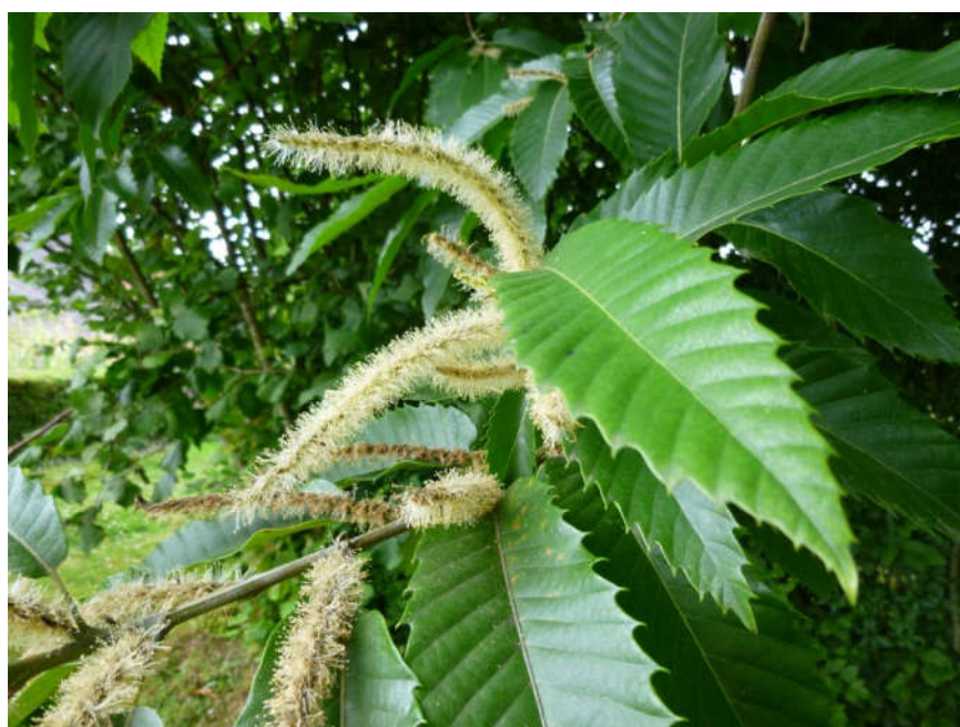
Slika 1. Cvjetovi i listovi pitomog kestena ( Castanea sativa Mill.) (Web 1)