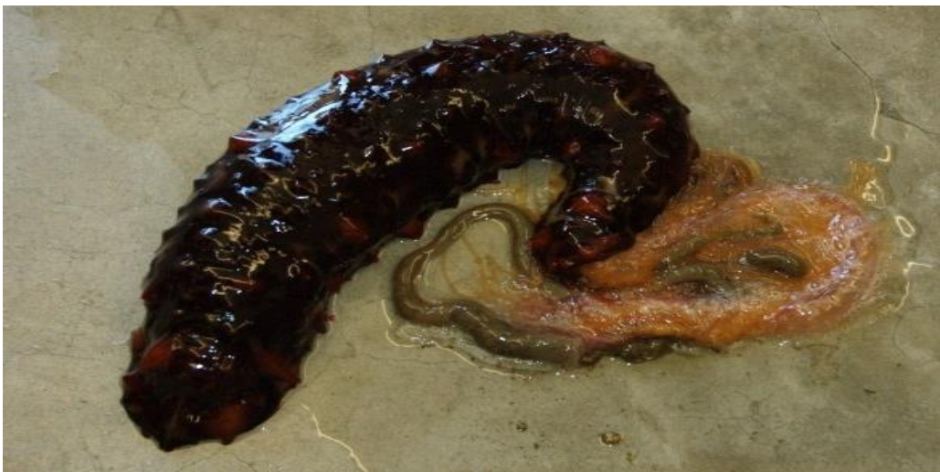
Slika 3. Evisceracija crijeva i vodenih pluća kalifornijskog trpa Parastichopus californicus L. (Web 3)

Ukoliko trpovi dožive stres podliježu procesu evisceracije. Evisceracija je proces prilikom kojega dolazi do raskidanja prednjeg ili stražnjeg dijela tijela kroz koji se izbacuje čitavo probavilo. Tijekom procesa evisceracije dolazi do prekida kontraktilnog vezivnog tkiva na točno određenom mjestu gdje se probavilo veže za stjenku tijela. Dolazi do kidanja vezivnog tkiva koje probavilo povezuje sa stjenkom tijela. Izbačeno probavilo se regenerira, a znanstvenici smatraju da se proces evisceracije događa i spontano u svrhu izbacivanja nakupljenih otpadnih tvari odnosno u svrhu čišćenja organizma. Nakon evisceracije takvo izbačeno probavilo služi za zavaravanje predatora dok trp dobije na vremenu za bijeg (Garcia-Ararras i Greenberg, 2001). Ova pojava tipičan je epimorfni proces u kojemu se formira blastemu slična struktura kao što je zadebljanje srednjeg ruba lamele (Candia Carnevali, 2006). U sljedećim fazama ponovni rast probavila može podrazumijevati dva alternativna mehanizma staničnog grupiranja. Jedan je mehanizam od ostataka jednjaka i kloake, preko morfolaktičkih mehanizama tkiva migracijom i proliferacijom endodermalno izvedenih stanica. Drugi mehanizam od celomskog epitela, izravnom migracijom i proliferacijom novih mezodermalno izvedenih progenitorskih stanica; mehanizam se javlja u situaciji kada se endodermalno izvedena tkiva potpuno izgube evisceracijom.