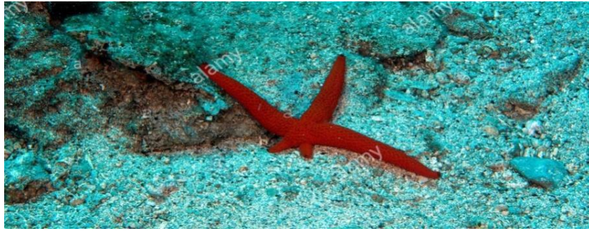
Slika 5. Regeneracija kraka crvene zvjezdače Echinaster sepositus L. (Web 4)