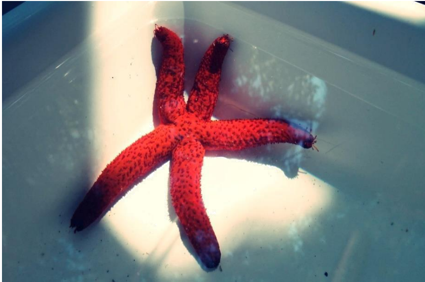
Slika 4. Echinaster sepositus L. – crvena zvjezdača (terenska nastava; Rovinj, 2016.)

Regeneracija kraka zvjezdače pod kontrolom je središnjeg živčanog sustava. Na modelu vrste Asterina gibosa L. u laboratorijskim uvjetima dokazano je da ukoliko se ukloni radijalni živac regeneracija nije moguća. Tijekom regeneracije potreban je živčani sustav u cjelini. Morfolaktički procesi kod zvjezdača prilično su spori u odnosu na epimorfne procese stapkobodljikaša i zmijača. Posebice početna faza popravka može trajati tjedan ili više ovisno o temperaturi mora i vrsti zvjezdače. Aktivnost staničnog ciklusa je prilično niska u početnoj fazi.