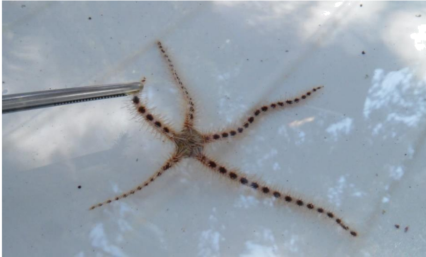
Slika 6. Ophiotrix sp. – dlakava zmijača (fotografija iz privatne zbirke; terenska nastava; Rovinj, 2016)