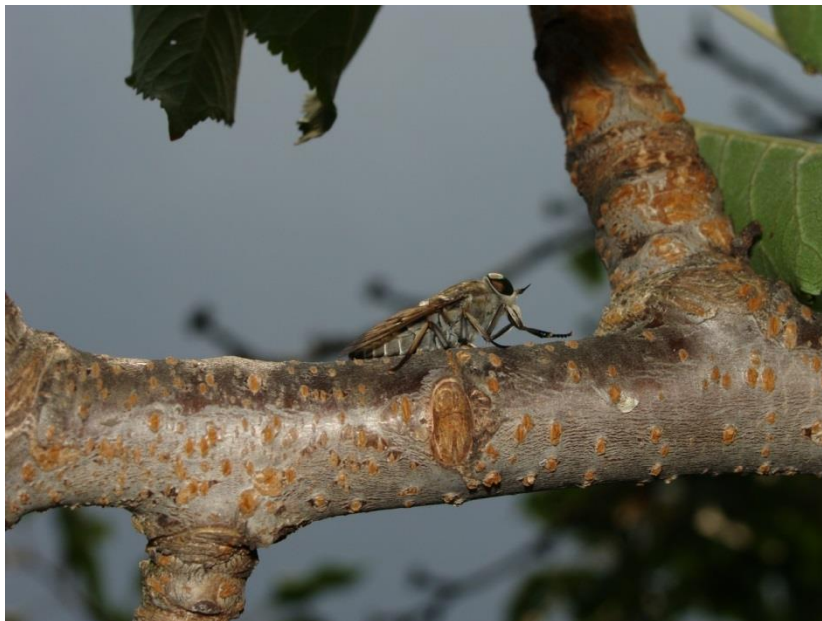
Slika 4. Tabanus bromius , ženka (Papuk)

Obadi su uzorkovani na 152 postaje koje pokrivaju 82 polja na UTM mreži Hrvatske. (Stjepan Krčmar & Jozsef Mikuška, The Horse flies of Eastern Croatia (Diptera: Tabanidae), Anali HAZU-a, Osijek 2001.)