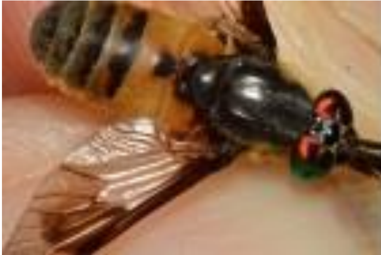
Slika 12. Chrysops viduatus , ženka (Web 7)

Mušjak je sličan mužjaku Chrysops relictusa , ali nema sivo-smeđe sjenčanje blizu stražnjeg ruba krila. Chrysops viduatus ima drugi abdominalni segment žute boje s velikom dobro definiranim kvadratnom crnom točkom. Gole pjege lica su velike, gotovo se susreću u srednjoj liniji. (Web 7)