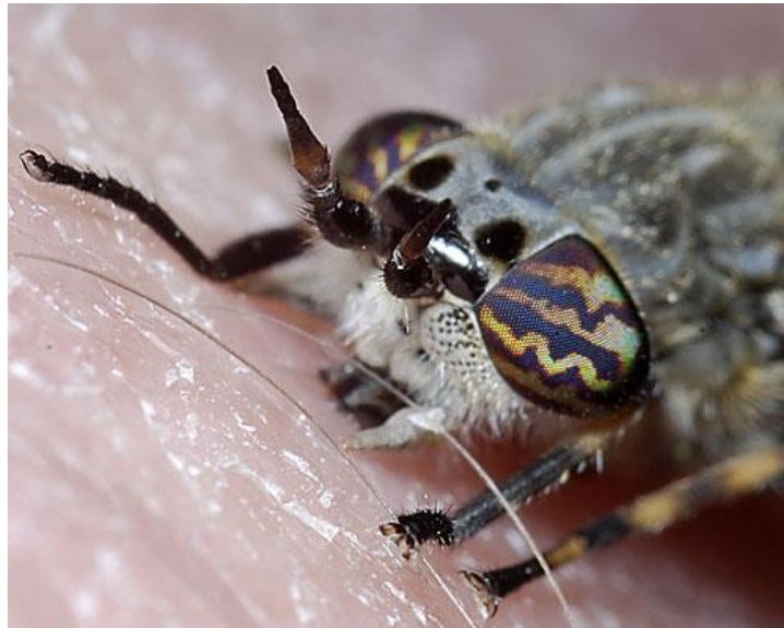
Slika 8. Haematopota pluvialis, ženka (Web 4)

Ženka Haematopota pluvialis (Slika 8.) ima izrazito oblikovane dlakave oči - očne pruge se protežu preko većine oka. (Web 4)