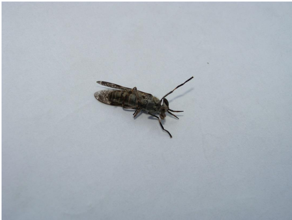
Slika 7. Haematopota pluvialis (Papuk)

Haematopota pluvialis (Kišni obad) (Slika 7.)