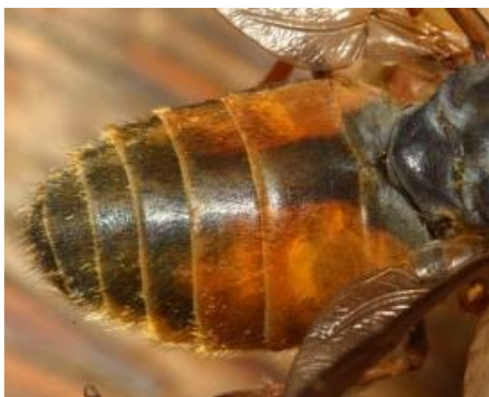
Slika 11. Hybomitra ciureai (Web 6)