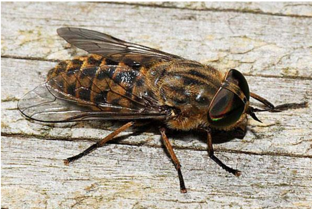
Slika 5. Tabanus bromius, ženka (Web 3)