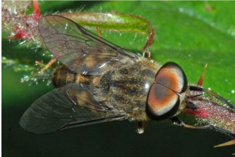
Slika 6. Tabanus bromius , mužjak (Web 3)

Haematopota pluvialis (Kišni obad) (Slika 7.)