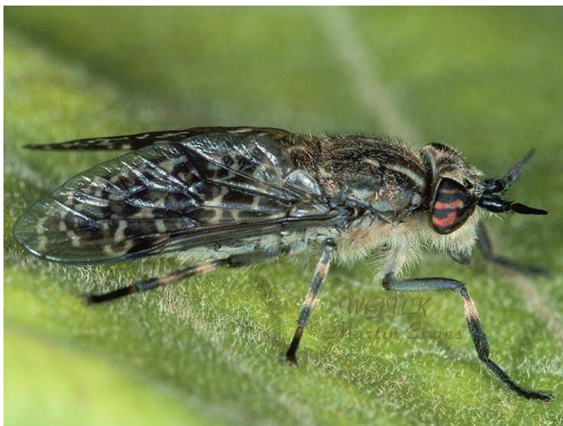
Slika 9. Haematopota crassicornis (Web 5)