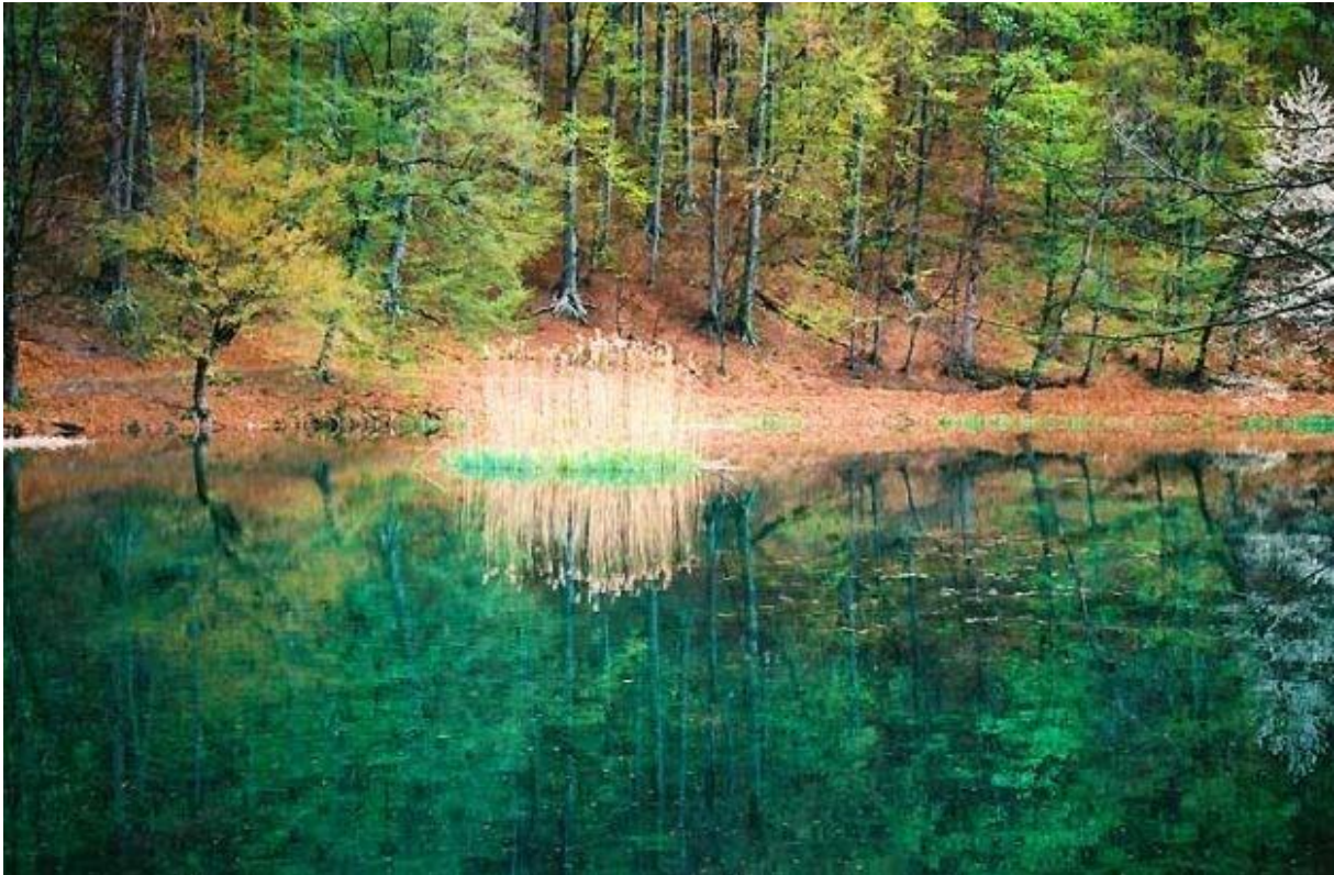
Slika 1. Park prirode Papuk (web 1)

Radonić i G. Pavić, Geološki vodič kroz Park prirode Papuk, J. Pamić, G. Radonić i G. Pavić, Velika 2003.)