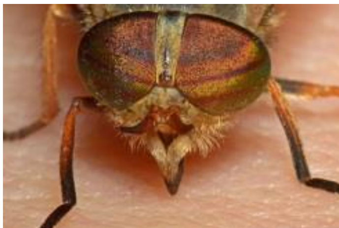
Slika 10. Hybomitra ciureai (Web 6)