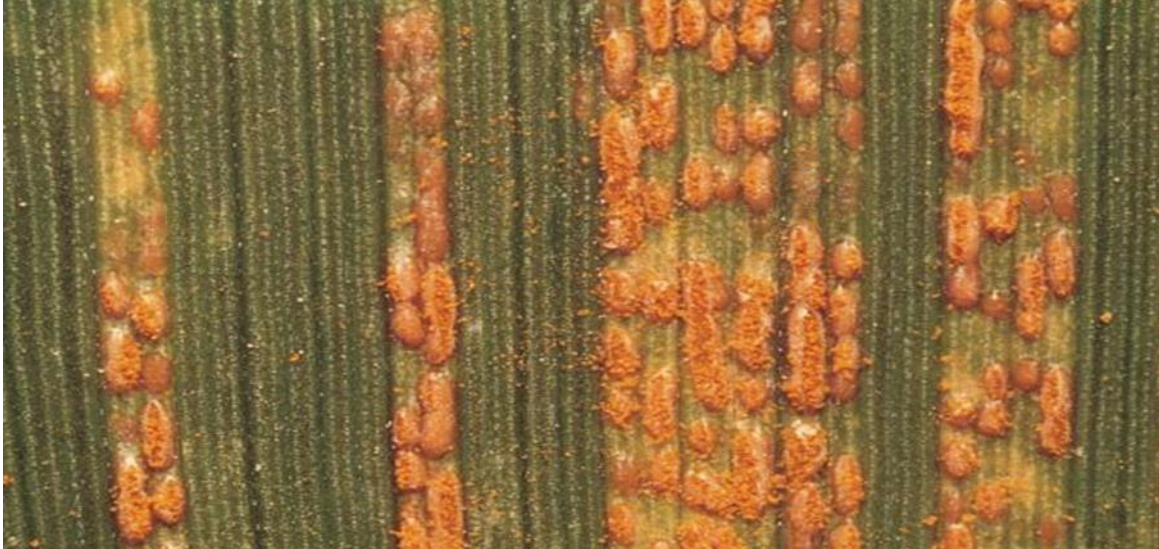
Slika 11. Pšenica zaražena gljivicom Puccinia striiformis ( bolest poznata pod nazivom „žuta hrđa“ ) [ web 17 ]

pojavi prvih simptoma. Fungicidi koje koristimo za suzbijanje bolesti isti su kao i kod smeđe hrđe.