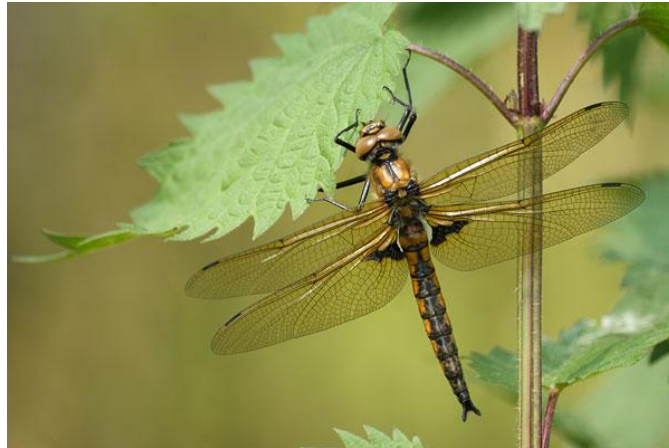
Slika 13. Epiptera bimaculata (Web 21)

Razvoj im traje dvije do tri godine. Odrasle jedinke najčešće možemo vidjeti od sredine svibnja do sredine lipnja (Belančić i sur., 2008).