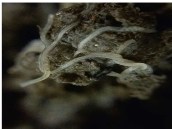
Slika 1 - Modelni organizam Enchytraeus albidus

Enchytraeus albidus (Slika 1) predstavlja jednu od većih vrsta u rodu Enchytraeus te može doseći dužinu do 4 cm. Tijelo je prekriveno tankom kutikulom preko koje tvari iz okoliša ulaze u tijelo i sastoji se od kolutića i kliteluma, a broj kolutića raste sa starošću. Prednji dio tijela se naziva prostomij. Hrana prolazi kroz ždrijelo i jednjak do crijeva i izlazi zajedno sa česticama tla kroz pigidijum. Nemaju respiratorni sustav, nego plinovi prolaze kroz kutikulu. Imaju kloragogene stanice, a celomska tekućina sadrži limfocite koji variraju u obliku, veličini, boji i granulaciji (Nielsen i Christensen, 1959) Enhitreide su hermafroditi, a životni ciklus im je kratak te postaju spolno zrele između 33 dana (18° C) i 74 dana (12 °C). Klitelum se pojavljuje kada je jedinka spolno zrela i zadržava se tijekom ostatka života, a za laboratorijska testiranja se koriste spolno zrele jedinice sa vidljivim klitelumom koje su u laboratorijskim uvjetima uzgajane kroz jedan reprodukcijski ciklus.