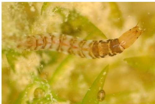
Slika 13. Ablabesmyia sp. (ličinka)