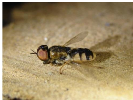
Slika 27. Odontomyia annulata (odrasla jedinka) (web 32, 24.6.2016.)