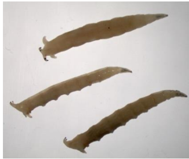
Slika 19. Limnophora riparia (ličinka) (web 20, 24.6.2016.)