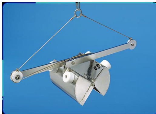
Slika 4. Van Veenovo grabilo (web 8, 24.6.2016.)