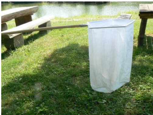
Slika 1. Bentos mreža (web 7, 24.6.2016.)