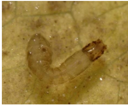
Slika 24. Simulium sp. (ličinka)