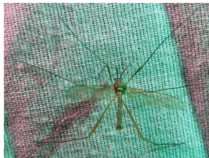
Slika 10. Agathon sp. (odrasla jedinka) (web 6, 24.6.2016.)