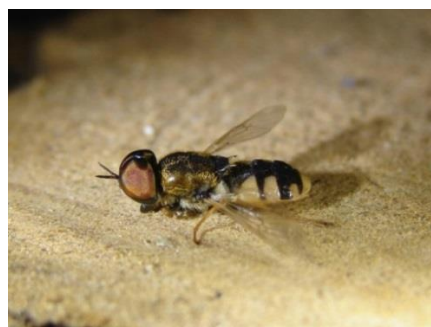
Slika 27. Odontomyia annulata (odrasla jedinka) (web 32, 24.6.2016.)