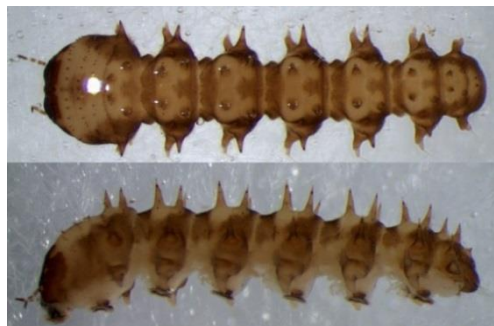
Slika 9. Agathon sp. (ličinka) (web 26, 24.6.2016.)