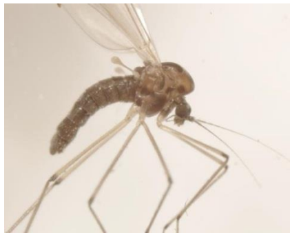
Slika 16. Dixa sp. (odrasla jedinka) (web 24, 24.6.2016.)