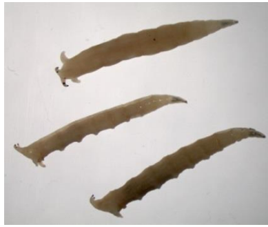
Slika 19. Limnophora riparia (ličinka) (web 20, 24.6.2016.)