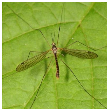
Slika 33. Tipula sp. (odrasla jedinka)