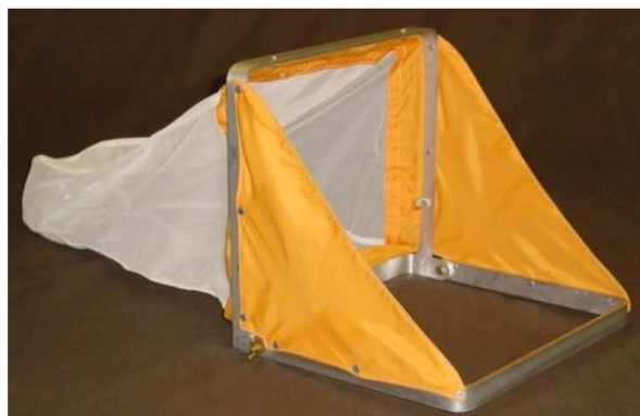
Slika 2. Surberova mreža (web 9, 24.6.2016.)