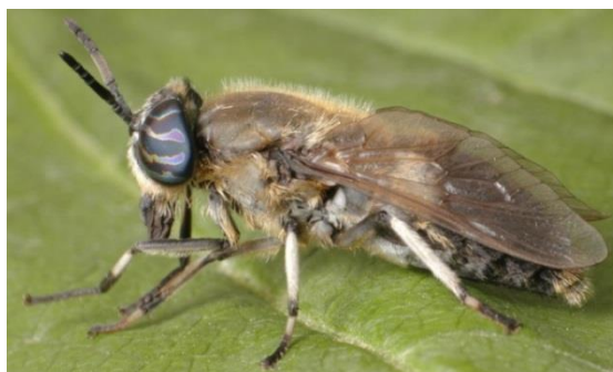
Slika 31. Heptatoma pellucens (odrasla jedinka) (web 14, 24.6.2016.)