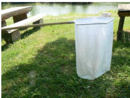
Slika 1. Bentos mreža (web 7, 24.6.2016.)