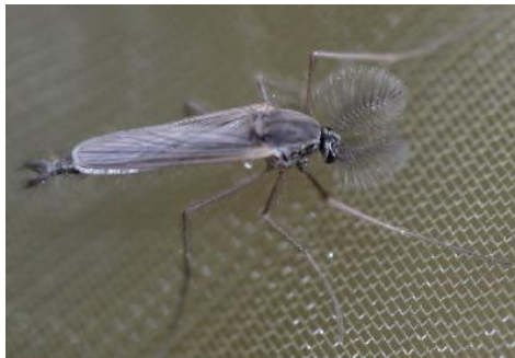
Slika 12. Chaoborus crystallinus (odrasla jedinka) (web 11, 24.6.2016..)