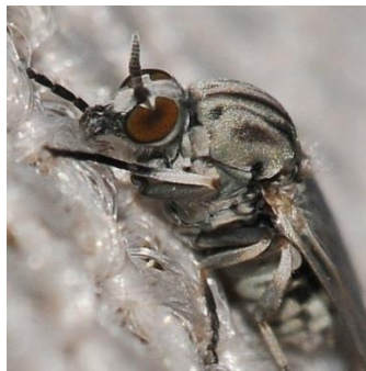
Slika 25. Simulium sp. (odrasla jedinka) (web 28, 24.6.2016.)