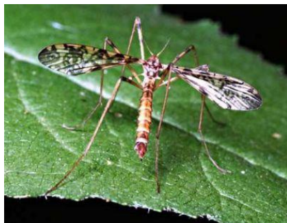
Slika 18. Epiphragma ocellare (odrasla jedinka) (web 13, 24.6.2016.,)