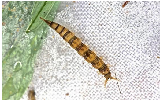
Slika 7. Atherix lantha (ličinka)