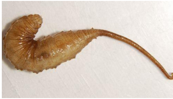
Slika 28. Caliprobola speciosa (ličinka) (web 23, 24.6.2016.)