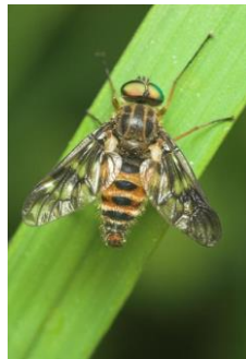
Slika 8. Atherix ibis (odrasla jedinka)