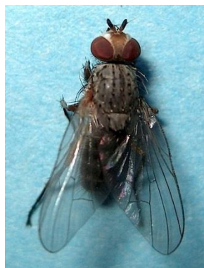
Slika 6. Pegomya sp. (odrasla jedinka) (web 4, 24.6.2016.)