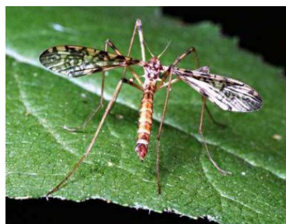
Slika 18. Epiphragma ocellare (odrasla jedinka)