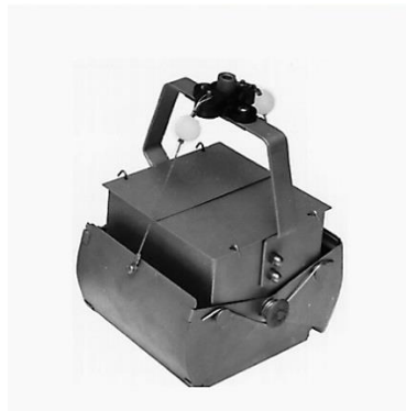
Slika 3. Eckmanovo grabilo (web 35, 24.6.2016.)