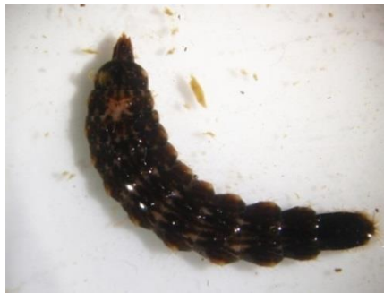
Slika 26. Odontomyia annulata (ličinka) (web 31, 24.6.2016.)