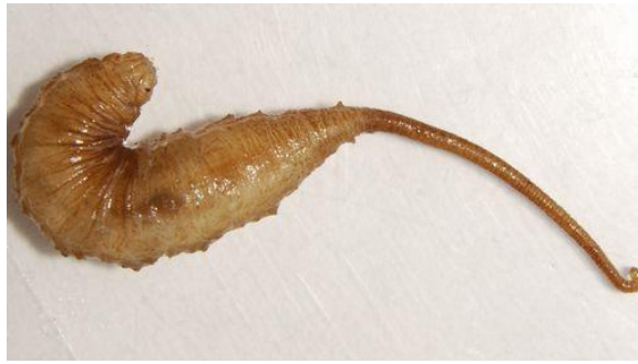
Slika 28. Caliprobola speciosa (ličinka) (web 23, 24.6.2016.)