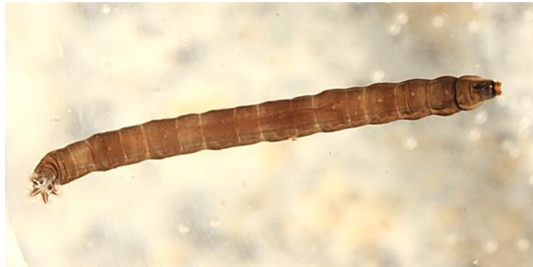
Slika 32. Tipula sp. (ličinka) (web 3, 24.6.2016.)