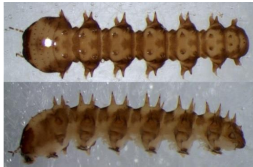
Slika 9. Agathon sp. (ličinka)