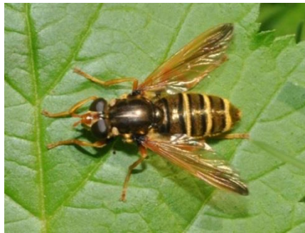
Slika 29. Caliprobola speciosa (odrasla jedinka) (web 27, 24.6.2016.)