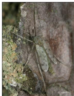
Slika 14. Ablabesmyia sp. (odrasla jedinka) (web 15, 24.6.2016.,)