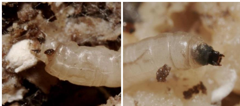
Slika 21. i 22. Ula sp. (ličinka - zadac i glava) (web 17 i 18, 24.6.2016.)