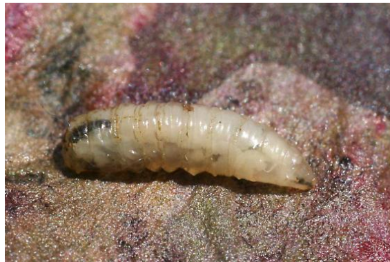
Slika 5. Pegomya sp. (ličinka)