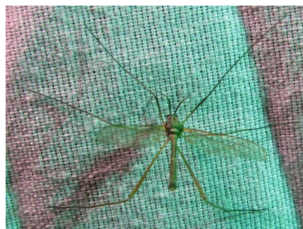
Slika 10. Agathon sp. (odrasla jedinka) (web 6, 24.6.2016.)