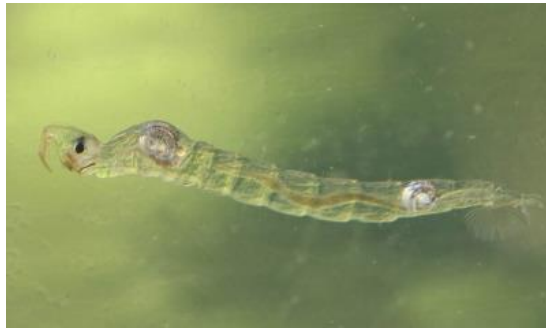
Slika 11. Chaoborus crystallinus (ličinka) (web 12, 24.6.2016.)