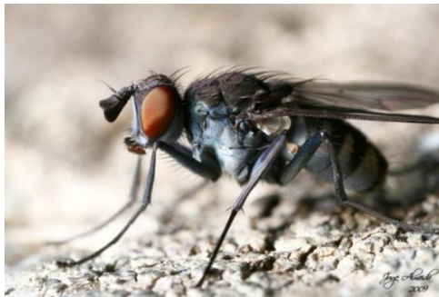
Slika 20. Limnophora riparia (odrasla jedinka) (web 21, 24.6.2016.)