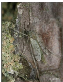
Slika 14. Ablabesmyia sp. (odrasla jedinka) (web 15, 24.6.2016.,)