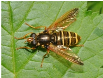
Slika 29. Caliprobola speciosa (odrasla jedinka) (web 27, 24.6.2016.)