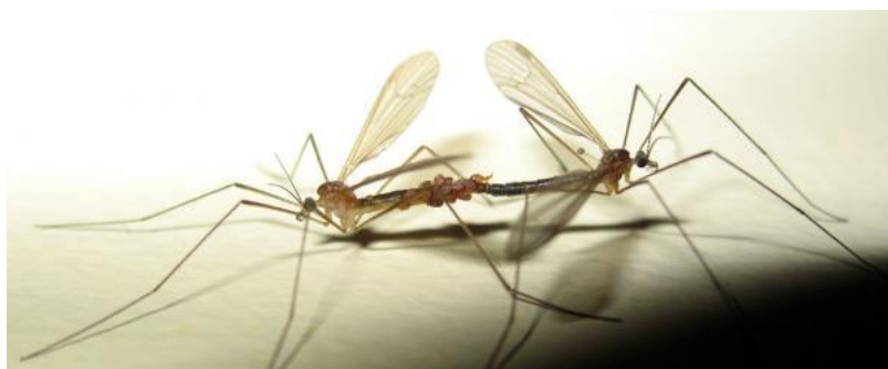
Slika 23. Ula sp. (odrasle jedinke) (web 16, 24.6.2016.)