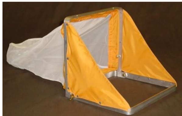
Slika 2. Surberova mreža (web 9, 24.6.2016.)