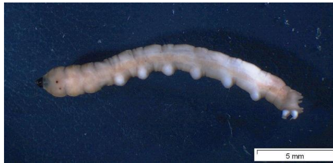
Slika 17. Epiphragma ocellare (ličinka) (web 25, 24.6.2016.,)