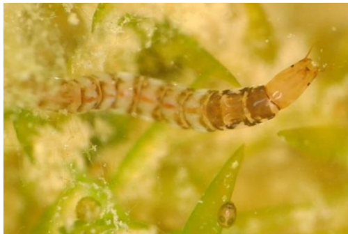
Slika 13. Ablabesmyia sp. (ličinka) (web 33, 24.6.2016.,)