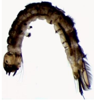
Slika 15. Dixa sp. (ličinka) (web 22, 24.6.2016.)