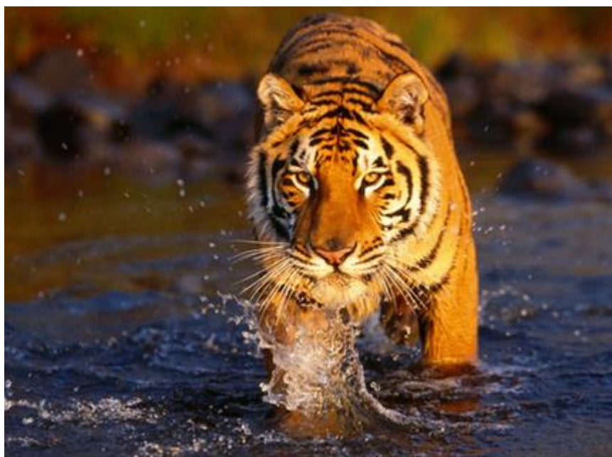
Slika 5. Bengalski tigar u prirodnom staništu