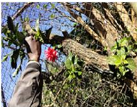
Slika 13. Voće i cvijeće na visini kao dio prirodnog načina hranjenja