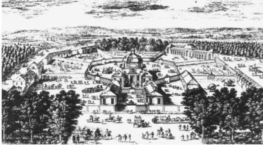
Slika 1. Versailleska menadžerija Historie des ménageries de l'antiquité `a nos jours Gustava Loisela

Mučenje životinja dugim putovanjima je jedan od problema, jer životinje moraju jesti svakodnevno, a na višemjesečnim putovanjima moglo se spremati hrane za nekoliko tjedana, tako osim što su dobivale malo hrane, mnoge su i gladovale. Iz tih razloga uvedena je praksa tovljenja životinja prije preoceanskih putovanja uz stopu preživljavanja od 50%. Mnoge su uginule od slabosti i ozljeda nastalih uslijed ljučenja broda u olujama. Jačanjem flote širio se utjecaj Velike Britanije, Španjolske i Portugala na preoceanska područja. Životinje native u Europi otpremene su u ta područja gdje su osnovane kolonijalne menadžerije prvenstveno za izvor hrane, dok se doseljenici ne snađu u novom okolišu. Ove kolonijalne menadžerije imale su povećani negativni utjecaj na lokalni ekosustav Novog svijeta, jer jednom kada bi životinje pobjegle, pokazale bi se preagresivnima za to područje i uništavale bi lokalnu floru i faunu, izmjenjujući ravnotežu koja je postojala. Prve životinje koje su se slale iz Novog svijeta u Europske menadžerije bile su papige ( Ara macao ) 1496.g., oposumi ( Didelphis virginia ) 1500.g. i iguane ( Iguana iguana ) 1500.g., bizon ( Bison bison ) 1500.g., zamorac ( Cavia porcellus ) 1550.g., divlji puran ( Meleagris gallopavo ) i mošusna patka ( Biziura lobata ) 1520.g., sve na Španjolski dvor. Sa željom za uzgojem jednih životinja ljudi su potisnuli druge, divlje životinje.