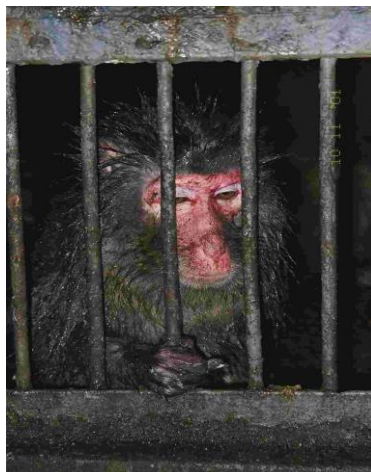
Slika 6. Bolesni siamang ( Symphalangus syndactylus ) u Zigong zoološkom vrtu, NR Kina

Stanje u kojima se životinje mogu pronaći u nekim zoološkim vrtovima je jednostavno zaprepašujuće, jer su skućeni u prostor jedva dvostruko veći od njih samih (Slika 6). Nedostatak prostora se posebno vidi kod oceanarija s kitovima i dupinima, ili pak u zabavnim parkovima gdje se životinje okome na ljude zbog malo prostora.