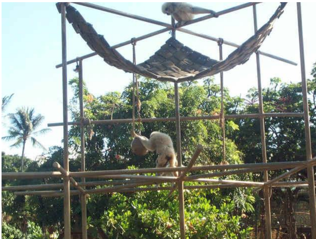
Slika 11. Lopta za hranjenje na visini od oko 30 m, rupičasta, ispunjena sa žitaricama "Captain Crunch Cereal with Crunch Berries"