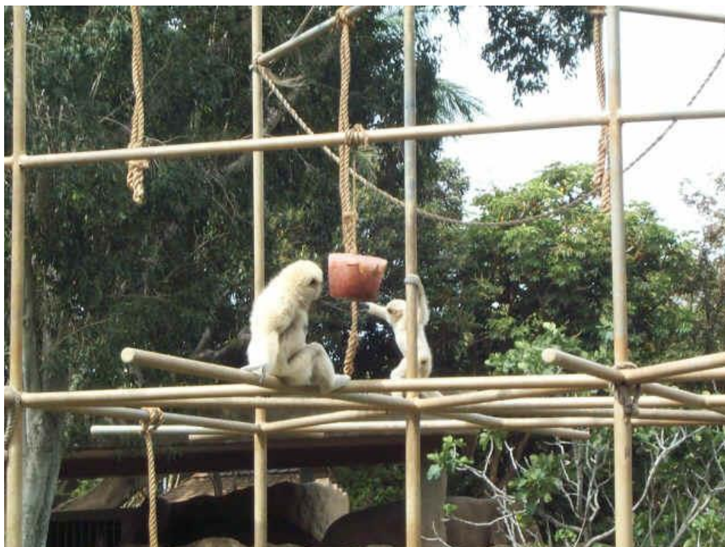
Slika 12. Kanta sa smrznutim voćem, slastica ljeti