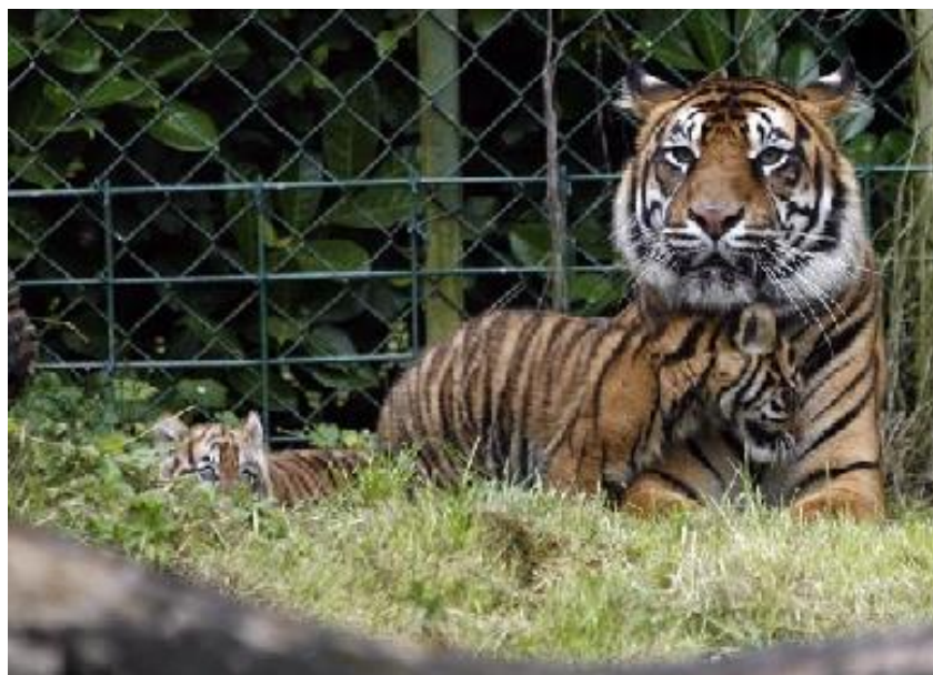
Slika 4. Bengalski tigrovi u zooološkom vrtu u Irskoj