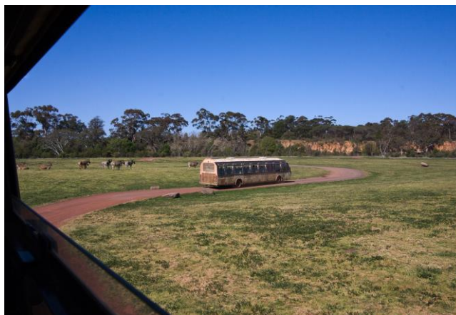
Slika 2. Werribee zoološki vrt otvorenog tipa, blizina Melbourne-a, Australija