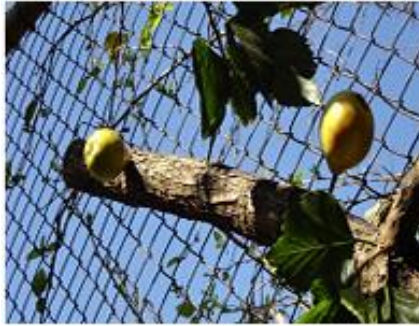
Slika 14. Hrana kao izazov