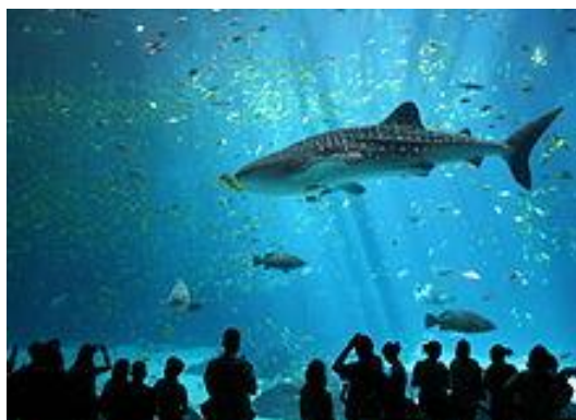
Slika 3. Mužjak kitopsine u "Georgia aquarium", Atlanta

Javni akvariji je suprotnost zoološkom vrtu (8) koji u glavnini ima životinje kopnenih ekosustava. Akvarij ima isključivo životinje vodenih ekosustava. Sam akvariji može biti i oceanarij ako ima dio ili pak cijeli oceanski ekosustav. Sam sustav je koncipiran od jednog velikog i cjelovitog ili nekoliko manjih i povezanih akvarija koji svojom bioraznolikošću simuliraju jedan ekosustav sa svim biljnim, pokretnim i nepokretnim životinjskim vrstama. Prvi veliki javni akvariji (Marino i sur., 2010.) su otvoreni sredinom 19. stoljeća u Londonu, Hamburgu i Münchenu i bili su koncipirani kao staklenici. Daljnjim razvojem tehnologija mogli su se stvoriti veći akvariji, od kojih je daleko najveći "Georgia aquarium" u Atlanti (Slika 3) otvoren za javnost 2005. godine s kapacitetom od 30 milijuna litara vode sa kitopsinom ( Rhincodon typus ) i beluga kitovima ( Delphinapterus leucas ) kao glavnim životinjama. Izgradnja tako velikih akvarija (9) je moguća zbog razvoja sintetičkih polimera. Održavanje je komplicirano i zahtjeva svakodnevno čišćenje, no neki imaju uređen ekosustav koji se sam čisti. S druge strane potrebne su i velike količine hrane, a kod velikih riba i sisavaca i veterinarska njega.