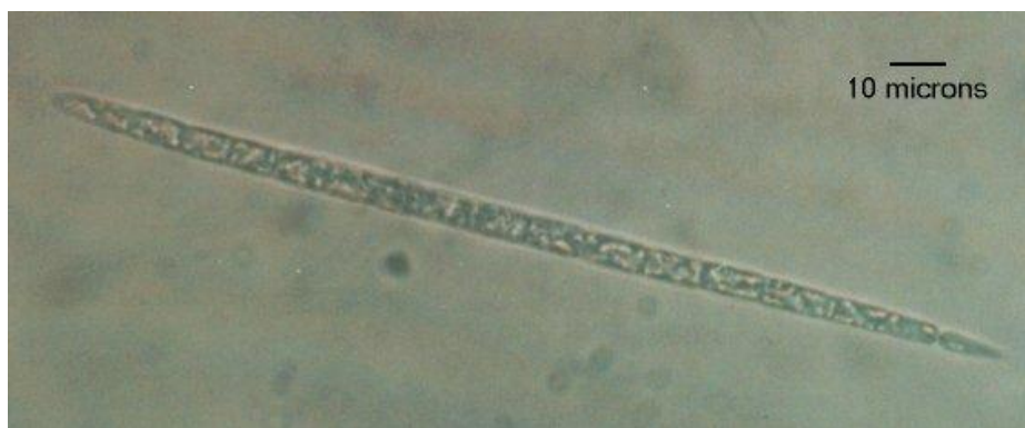
Slika 2a. Morfološki oblik vrste C. raciborskii - ravni trihom (izvor - web 1)

Varijabilnost morfoloških tipova uobičajena je kod mnogih cijanobakterija, ali posebno kod C. raciborskii (McGregor i Fabbro, 2000). Postoje dva glavna morfološka tipa - ravni (Slika 2a) i savijeni (Slika 2b) trihom (McGregor i Fabbro, 2000; Sakeretal., 1999b). Sa svakim oblikom dolazi i velika raznolikost u veličini i broju stanica koje čine trihom (McGregor i Fabbro, 2000). Ravni trihom je uglavnom duži i proizvodi više toksina po stanici (Jones i Sauter, 2005). Rijetko imaju akinete i često narastu bez heterocite (St. Amand, 2002a). Istraživanja su pokazala da su ravni morfološki tipovi brojniji, ali savijeni trihomi povećavaju svoju brojnost za vrijeme ili neposredno poslije masovnog razvoja ravnih trihoma (Saker i Griffiths, 2001).