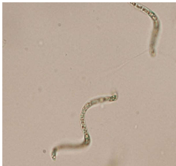
Slika 2b. Morfološki oblik vrste C. raciborskii - savijeni trihom