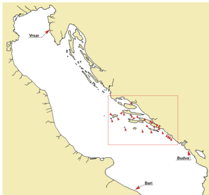
Slika 6. Rasprostranjenost alge Caulerpa racemosa u Jadranskom moru na kraju 2005. godine.

Samo godinu dana kasnije (2006.) broj nalazišta bio je 55. Tijekom 2007. godine alga Caulerpa racemosa zabilježena je na 12 novih područja te ukupno u hrvatskom podmorju na 70 nalazišta od kojih su dva u Nacionalnom parku Kornati i šest u Nacionalnom parku Mljet (Žuljević i sur., 2007). Osnovni razlog ovako brzog širenja je što se alga primarno širi morskim strujama. Jedini projekt uklanjanja alge Caulerpa racemosa var. cylindracea provodi se u Nacionalnom parku Mljet na lokalitetima Kanal Soline, Veliko jezero i Brana. Primijenjene metode za uklanjanje alge bile su ručno sakupljanje talusa i prekrivanje crnim folijama. Pretpostavka da alga ne može preživjeti duže od 6 mjeseci ispod folija bila je netočna i prerano podizanje folija tijekom 2006. godine rezultiralo je širenjem alge na nalazištima Kanal Soline i Veliko jezero. Naime Caulerpa racemosa ispod crne folije može preživjeti barem dvije godine (Žuljević, 2001).