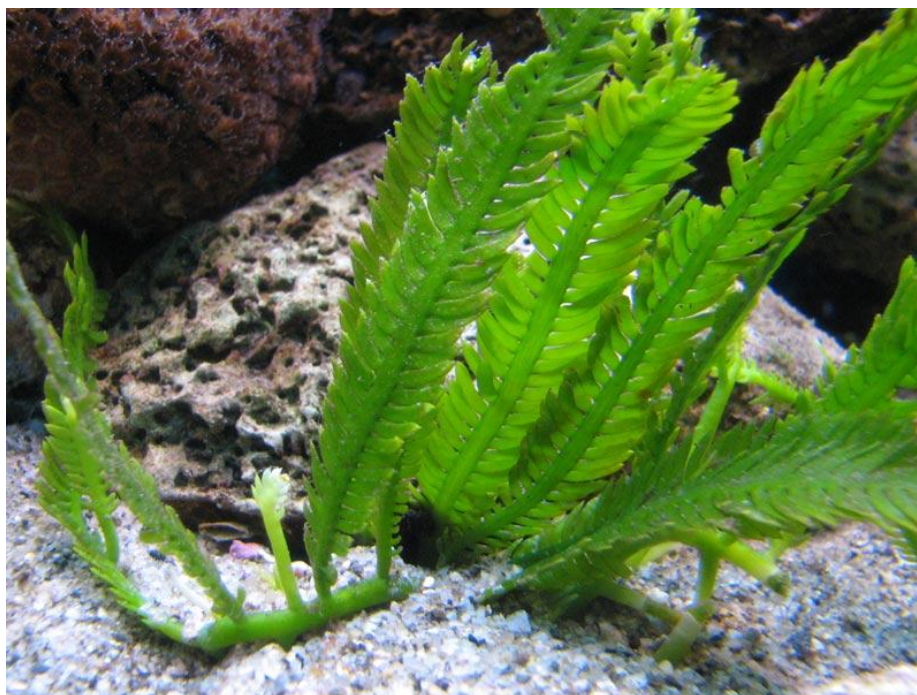
Slika 2. Caulerpa taxifolia (Vahl) C. Agardh

Kada alga naseli novo područje započinje njen brzi rast tijekom ljeta raste brzinom od čak 2 cm na dan, a u najgušćim naseljima može imati preko 14 000 listića i 300 metara puzajućeg stabalca po kvadratnom metru. Brojni listići podložni su otkidanju uslijed djelovanja valova, a svaki se nastali fragment kroz desetak dana razvije u novu algu. Fragmentacija alge i njeno obnavljanje su jedini način razmnožavanja u Sredozemnom moru. Do spolnog razmnožavanja ne dolazi unatoč ispuštanju gameta. Sve gamete u Sredozemnom moru su isključivo muške te nije poznato iz kojih razloga ne dolazi do razvoja ženskih gameta (Panayotidis i Žuljević, 2001). Zbog toga se alga razmnožava u Sredozemlju isključivo vegetativno te su sve alge u Sredozemlju genetički jednake odnosno klonovi.