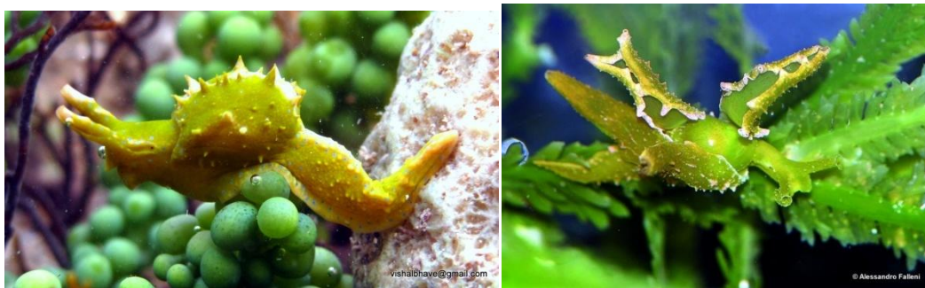
Slika 8. Sredozemni puževi golaći Oxynoe olivacea (lijevo) i Lobiger serradifalci (desno)

Osim što se vrlo uspješno razmnožava, brzo raste i ima cjelogodišnji talus, dodatni razlog njene uspješnosti je što ne postoje herbivorni organizmi koji kontroliraju njeno širenje. Salpa ( Sarpa salpa ) i hridinski ježinac ( Paracentrotus lividus ) osnovni su makroherbivori u Sredozemnom moru. Međutim, ovi makroherbivori se ne hrane kaulerpom jer ona proizvodi niz toksičnih i odbijajućih spojeva. Kaulerpin je jedan od glavnih metabolita koji kaulerpa proizvodi, a taj alkaloidi neurotoksin ima negativan utjecaj na većinu organizama (Vidal i sur., 1984). Jedina dva sredozemna organizma koja se bez posljedica mogu hraniti kaulerpom su endemični sredozemni puževi golaći Oxynoe olivacea i Lobiger serradifalci (slika 8).