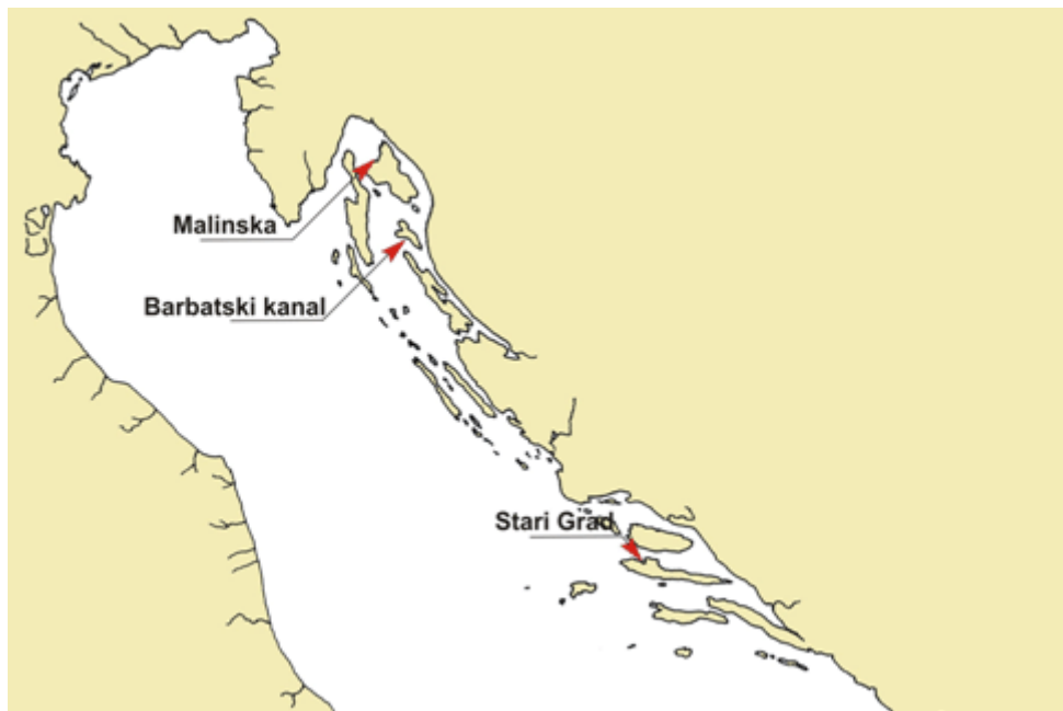
Slika 3. Nalazišta alge Caulerpa taxifolia u Jadranskom moru

Vrsta Caulerpa taxifolia u Jadranu je prvi put zabilježena 1994. godine u Starogradskom zaljevu. Do danas je alga pronađena u Jadranskom moru jedino u hrvatskom podmorju i to na tri područja s većim brojem lokaliteta (slika 3) - Starigradski zaljev na otoku Hvaru, Malinska na otoku Krku i Barbatski kanal između otoka Raba i otočića Dolin (Iveša, 2001; Žuljević, 2001). Malinska predstavlja jedan od najsjevernijih lokaliteta rasprostranjenosti roda Caulerpa u svijetu (Iveša i sur., 2006). Danas je Caulerpa taxifolia prisutna jedino na području Starigradskog zaljeva, dok u Barbatskom kanalu i Malinskoj alga nakon provedenih projekata uklanjanja i vrlo niskih zimskih temperatura nije više uočena. U Barbatskom kanalu alga je uspješno uklonjena 2001., a Malinskoj krajem 2005. godine (Iveša i sur., 2006)