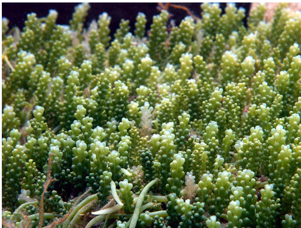
Slika 5. Caulerpa racemosa var. cylindracea

Mjesta pojavljivanja većinom nisu sidrišta i ribolovne pozicije, nego su to često područja izložena snažnim valovima i morskim strujama. Mjesta pojavljivanja sugeriraju kako su morske struje glavni mehanizam njenog širenja (Žuljević i Antolić, 2004). Nalazišta vrste Caulerpa racemosa uz istočnu Jadransku obalu (područje Albanije, Crne gore, južni dio hrvatske obale i otoci) potvrđuju ovu teoriju. Većina ovih nalazišta vjerojatno su nastala djelovanjem obalnom jadranskom strujom i valovima tijekom snažnih istočnih i južnih vjetrova. Zbog svoje karakteristične građe tijela Caulerpa racemosa sporije tone te se tijekom snažnih valova i strujanja mora fragmenti alge prenose na puno veće udaljenosti od fragmenata vrste Caulerpa taxifolia .