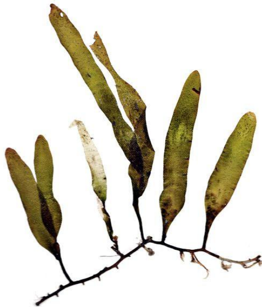
Slika 1. Caulerpa prolifera (Forsskål) J. V. Lamouroux

Do danas je u Sredozemnom moru pronađeno osam svojiti roda Caulerpa : Caulerpa mexicana , Caulerpa racemosa var. turbinata – uvifera , Caulerpa racemosa var. lamourouxii f. requienii , Caulerpa racemosa var. cylindracea , Caulerpa scalpelliformis , Caulerpa sertularoides i Caulerpa taxifolia alohtone su sredozemne svojite roda Caulerpa . Od njih čak sedam svojiti nisu autohtoni sredozemni organizmi. Caulerpa prolifera (slika 1) jedina je vrsta koja se smatra autohtonom sredozemnom algom. Ona je vjerojatno relikat iz vremena tropskog Tethys mora koje je prije 50 milijuna godina bilo na području današnjeg Sredozemnog mora (Giaccone i Di Martino, 1995). Caulerpa prolifera osim u Sredozemnom moru, rasprostranjena je i u mnogim tropskim morima gdje najčešće naseljava plitko, pjeskovito – muljevito dno i raste zajedno s morskim cvjetnicama. U Jadranskom moru, ova vrsta je rijetka, osim na području Albanije. U Hrvatskoj je pronađena na šest lokaliteta, no krajem 2004. godine njeno je prisustvo potvrđeno jedino uz otočić Lokrum, dok se na ostalim područjima povukla, ali razlozi njenog povlačenja nisu posve jasni. Naselje alge Caulerpa prolifera uz otočić Lokrum netipično je naselje ove vrste jer raste na kamenitom podmorskom strmcu gdje su iznimno jaki valovi i smanjena količina svjetla (Špan i sur.,1998).