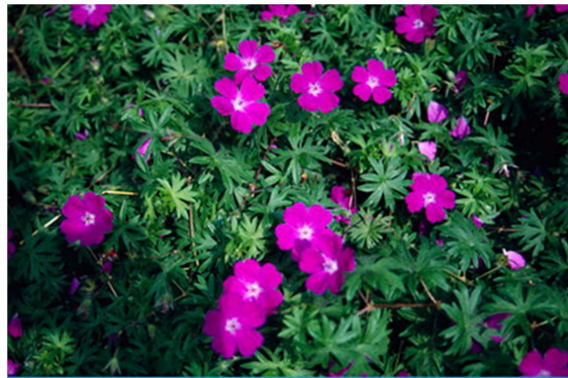
Slika 8. Geranium sanguineum L.

Crvena iglica je zeljasta, višegodišnja biljka koja može narasti do 25 cm u visinu. Listovi su joj na stabljici nasuprotno postavljeni i razdijeljeni. Cvjetovi crvene iglice su dvospolni, pentamerni, pojedinačni i crveno obojeni. Plod se raspada na 5 plodića s dugim kljunastim nastavcima (Šilić, 1977; Domac, 1989; Moore, 2009).