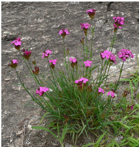
Slika 4. Dianthus carthusianorum L.

Kartuzijanski karanfil je zeljasta, višegodišnja biljka, uske ravne stabljike koja naraste i do 40 cm u visinu. Cijela stabljika je prekrivena nasuprotno postavljenim, uskim, šiljastim listovima. Na vrhu nosi ružičaste ili ljubičaste cvjetove skupljene u glavičaste cvatove. Latice cvjetova su nazubljene i tvore usku cijev u obliku čaške (Domac, 1989; Moore, 2009).