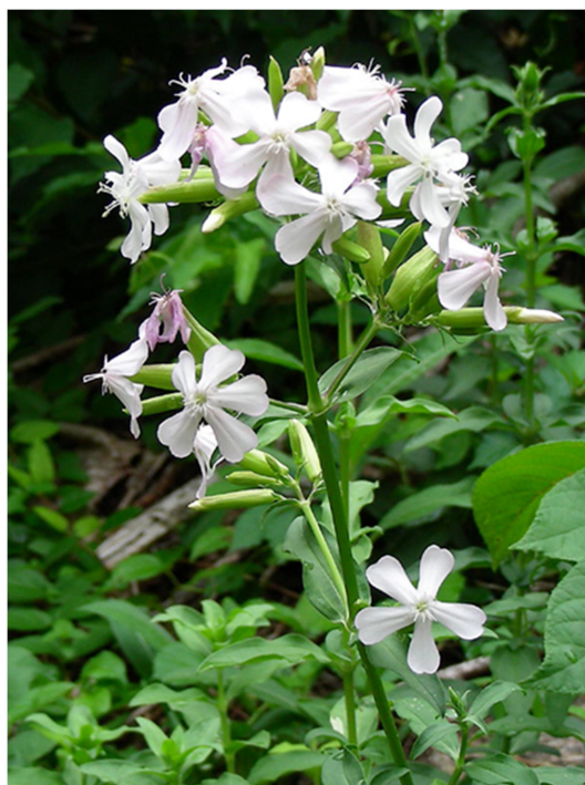
Slika 5. Saponaria officinalis L.

Sapunika je zeljasta trajnica čija stabljika može narasti i do 60 cm u visinu. U tlu ima razgranjeni debeli korijen, izvana crvenosmeđ, a iznutra žut. Listovi biljke su nasuprotni, duguljasti, tamnozeleni i grubo izrubljeni. Ima bijele ili blijedoružičaste cvjetove koji su skupljeni na vrhu stabljike u rahli paštitasti cvat (Domac, 1989; Moore, 2009). Blagog su mirisa.