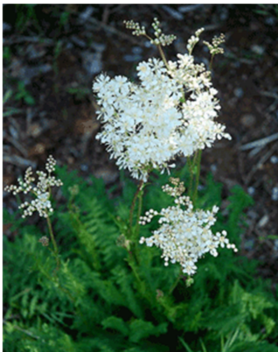
Slika 3. Filipendula vulgaris Moench

Gomoljasta končara sadrži eterično ulje u čijem sastavu prevladava salicil aldehyd, a prisutni su i različiti spojevi kao što su \alpha -asaron, metil salicilat i benzaldehid (Radulović i sur., 2007). Također je bogata taninima i flavonoidima (Katanić i sur., 2015; Pukalskienė i sur., 2015). Zbog prisutnosti različitih aktivnih spojeva, ova biljna vrsta ima dobra antioksidativna i antimikrobna svojstva (Imbrea i sur, 2010; Katanić, i sur., 2015). Korijen i nadzemni dijelovi gomoljaste končare od davnina se koriste u narodnoj medicini. Nadzemni dijelovi biljke prikupljaju se u vrijeme cvatnje (od lipnja do kolovoza) i suše na zraku. Usitnjeni korijen koristi se za liječenje problema s bubrezima, otežanog disanja, upale grla i bolova u stomaku (Tucakov, 1973). Čaj od osušenih dijelova biljke se koristi za liječenje reume i gihta te pročišćavanje krvi (Pahlow, 1989).