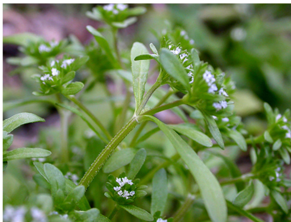
Slika 10. Valerianella locusta (L.) Laterrade

Obični matovilac je jednogodišnja zeljasta biljka s uspravnom, razgranjenom stabljikom koja može narasti i do 40 cm u visinu. Na stabljici su nasuprotno postavljeni duguljasti listovi bez palistića. Biljka ima dvospolne, sitne cvjetove bijele ili bijelomodre boje. Plod je oraščić (Domac, 1989; Moore, 1989).