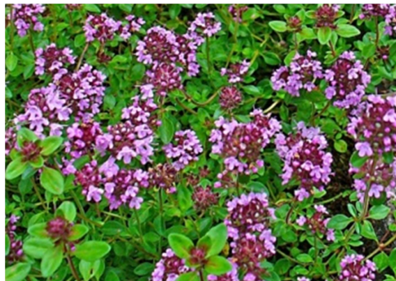
Slika 2. Thymus serpyllum L.

Majčina dušica je višegodišnja biljka koja može narasti do 7 cm u visinu. Pretežno je grmolika i razvija brojne izdanke i vriježe. Stabljika joj je polegnuta ili se uzdiže, zeljasta, a u donjem dijelu odrvenjela. Stabljika nosi male, uske, nasuprotno postavljene listove cjelovitog ruba na kratkoj peteljci. Listovi sadrže brojne uljne žlijezde (Dubravec i Dubravec, 2001). Cvjetovi majčine dušice su ružičasti, dvospolni i razvijaju se na vrhu stabljike u pazušcu listova. Plod joj je kalavac koji se raspada na 4 suha kuglasta plodića (Domac, 1989).