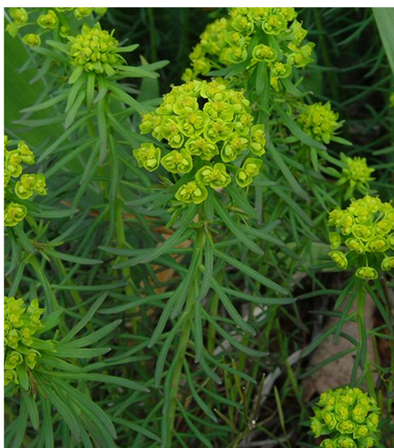
Slika 7. Euphorbia cyparissias L.

Uskolisna mlječika je zeljasta biljka, s uspravnom, razgranjenom stabljikom koja može narasti i do 20 cm u visinu. Listovi na stabljici su gusto raspoređeni i linealnog su oblika. Cvjetovi su neugledni. Po jedan ženski i više muških cvjetova razvijaju se u zajedničkom ovoju i čine cvat – cijatij (Domac, 1989; Moore, 2009).