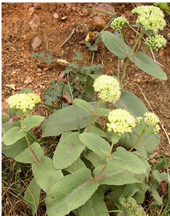
Slika 6. Sedum telephium L. subsp. maximum (L.) Krock.

Veliki žednjak je zeljasta biljka čija stabljika može narasti u visinu do 60 cm. Ima čvrstu, valjkastu stabljiku modrozeline boje koja nosi nasuprotno smještene mesnate listove. Cvjetovi su mu dvospolni, žućkasti i združeni u cvat – paštitac (Domac, 1989).