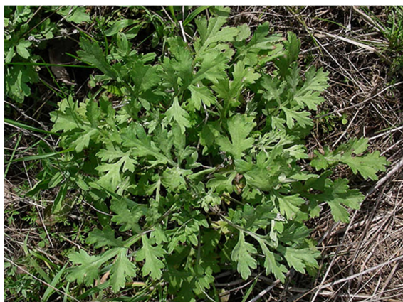
Slika 1. Artemisia vulgaris L.

Pelin sadrži niz aktivnih tvari kao što su flavoni, kumarini, eterično ulje tujon i polisaharid inulin (Govindaraj i sur., 2008; Locatelli Corrêa-Ferreira i sur., 2014). Istraživanja su pokazala da je zastupljenost pojedinih aktivnih tvari u biljkama pelina vrlo različita i mijenja se ovisno o geografskom položaju, okolišnim uvjetima i utjecaju stresnih čimbenika kojima su biljke bile izložene tijekom rasta. Ulja iz biljaka pelina s područja Italije posebno su bogata kamforom i verbenonom (Mucciarely i sur., 1995), dok su \beta -tujon, \alpha -pinen i 1,8-cineol najzastupljeniji u biljkama pelina prikupljenim u Hrvatskoj (Blagojević i sur., 2006).