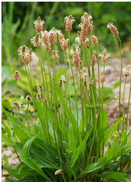
Slika 9. Plantago lanceolata L.

Uskolisni trputac je višegodišnja zeljasta biljka. Ima kratki podanak i jak korijen, a može narasti do 40 cm u visinu. Listovi biljke su prizemni, dugi, lancetastog oblika i cjelovitog ili nazubljenog ruba. Cvjetovi uskolisnog trputca su sitni, dvospolni, pravilni, bjelkasti i skupljeni u guste, klasaste cvatove. Plod je tobolac (Domac, 1989; Šarić, 1989; Moore, 2009). Uskolisni trputac cvate od svibnja do rujna (Dubravec i Dubravec, 2001).