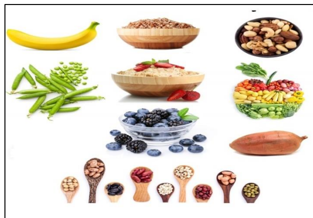
Slika 5. Složeni ugljikohidrati (Web 5.)