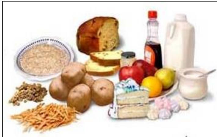
Slika 4. Jednostavni ugljikohidrati (Web 4.)