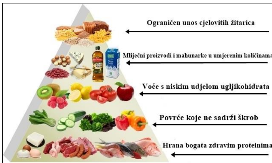
Slika 3. Piramida namirnica preporučena za prehranu s niskim udjelom ugljikohidrata (Web 3.)

Razlikujemo jednostavne i složene ugljikohidrate. Jednostavni ugljikohidrati su škrob i šećeri, lakše se probavljaju nakon kuhanja, a namirnice u kojima su najzastupljeniji su žitne pahuljice, riža, krumpir te brašno i proizvodi od brašna (Slika 4.). Složeni ugljikohidrati su vlaknaste tvari (Slika 5.), a nalaze se u povrću i voću, cjelovitim žitaricama te ubrzavaju odstranjivanje štetnih sastojaka iz organizma (Eliasson, 2006). Najviše štetni ugljikohidrati se nalaze u gaziranim pićima koja se sve više konzumiraju, koja ne sadrže gotovo ništa mikronutrijenata, stoga bi njihov unos trebalo smanjiti (Arvidsson-Lenner i sur., 2004).