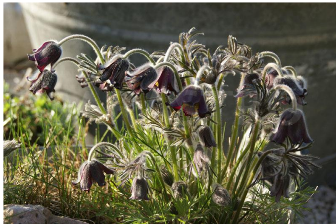
Slika 2. Crnkasta sasa

Crnkasta sasa (Slika 2) pripada porodici žabnjaka (Ranunculaceae). Prema životnom obliku je geofit. Nastanjuje suhe travnjake i pijeske (Nikolić i Topić, 2005). Rasprostranjena je u zemljama srednje i istočne Europe, a u Hrvatskoj dolazi samo na nekoliko lokaliteta - na Đurđevačkim pijescima, Žumberačkom gorju, u Hrvatskom zagorju, Istri, Međimurju i istočnoj Slavoniji (Šegota i Posavec Vukelić, 2008).