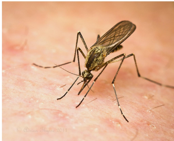
Slika 5. Odrasla ženka roda Aedes (Izvor: web 6)

Odrasla jedinka (Slika 5) predstavlja završni stadij metamorfoze komaraca. Kukuljica se postavlja u horizontalni položaj i zatim guta zrak kako bi se povećao pritisak između kutikule kukuljice i odrasle jedinke što dovodi do pucanja kutikule kukuljice duž ekdisalne linije (Mohrig, 1969). Nakon pucanja, odrasla jedinka polako napušta kukuljicu. Mužjaci komaraca kasnije spolno dozrijevaju nego što to čine ženke, zbog čega njihov stadij odrasle jedinke nastupa obično dan do dva prije nego u ženki (Gillett, 1983). Kako bi se to postiglo skraćuje se vrijeme ličinke mužjaka što za posljedicu ima da su odrasli mužjaci pojedine vrste manji nego odrasle ženke iste vrste komaraca.