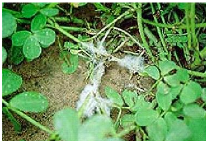
Slika 8. Kikiriki zaražen gljivicom Sclerotinia minor (Web 7).

Mogući agensi biokontrole koji su predmet istraživanja su antagonistički organizmi kao Trichoderma spp. , Gliocladium spp. , Penicillium spp. , Talaromyces spp. , i Sporodesmium spp. Ovi organizmi proizvode komponente kao što su beta-1,3-glukanazu i hitinazu, enzime koji mogu probiti staničnu stijenku uzrokujući smrt te napadaju sklerocij mnogih gljivičnih patogena. Geni ovih enzima su izolirani, klonirani i primjenjuju se na biljkama u svrhu zaštite od gljivičnih patogena (Jabnoun-Khiareddine i sur., 2009).