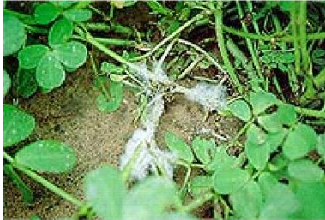
Slika 8. Kikiriki zaražen gljivicom Sclerotinia minor (Web 7).

Mogući agensi biokontrole koji su predmet istraživanja su antagonistički organizmi kao Trichoderma spp. , Gliocladium spp. , Penicillium spp. , Talaromyces spp. , i Sporodesmium spp. Ovi organizmi proizvode komponente kao što su beta-1,3-glukanazu i hitinazu, enzime koji mogu probiti staničnu stijenku uzrokujući smrt te napadaju sklerocij mnogih gljivičnih patogena. Geni ovih enzima su izolirani, klonirani i primjenjuju se na biljkama u svrhu zaštite od gljivičnih patogena (Jabnoun-Khiareddine i sur., 2009).