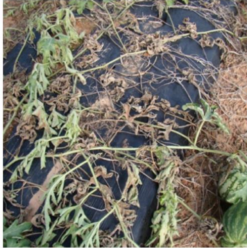
Slika 2. Primjer napada gljivice Rhizoctonia solani na stabljiku lubenice (Web 2).

narušavanja biodiverziteta te gljivice ovog roda pomažu u ponovnom uspostavljanju ravnoteže. Poznato je i djelovanje u kontroli korova. Osim gore navedenih prednosti ova gljivica je od iznimne važnosti i kada su u pitanju alternativni izvori energije.