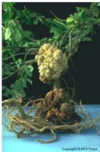
Slika 7. Napad bakterije Agrobacterium tumefaciens koja uzrokuje rak biljaka (Web 6).

da su vrste A. tumefaciens i A. rhizogenes sposobne zauzeti Ti ili Ri-plazmid, dok su sojevi vrste A. grobacterium vitis ograničeni na vinovu lozu i mogu imati Ti-plazmid.