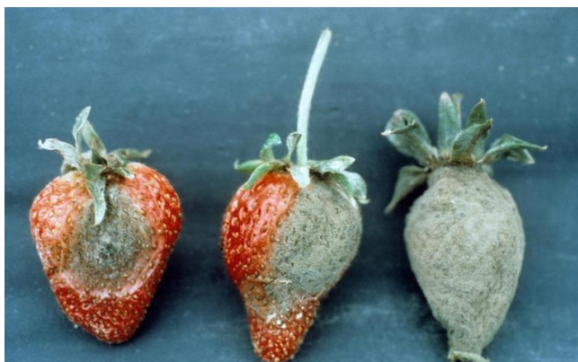
Slika 5. Primjer napada sive plijesni Botrytis cinerea na jagode (Web 4).

Vrsta Botrytis cinerea je nekrotični gljivični patogen, uzrokuje bolest sivih plijesni u preko 200 biljnih vrsta domaćina te je posebno destruktivna na voću i povrću (Williamson i sur., 2007).