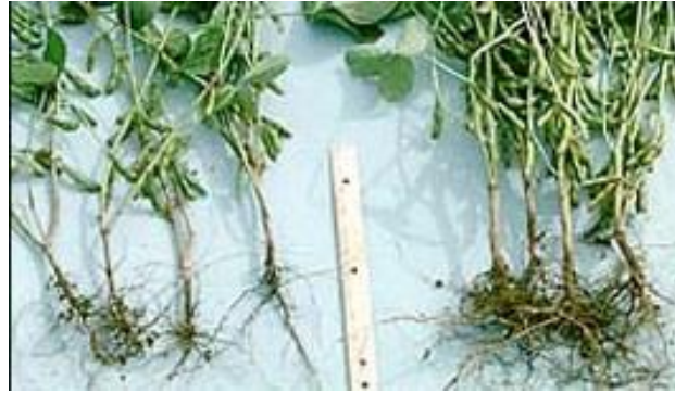
Slika 1. Primjer zaštite biljke preparatom koji sadrži gljivicu Trichoderma asperellum (Web 1).

Gljivice iz roda Trichoderma asperellum koloniziraju i zauzimaju životni prostor drugih štetnih gljivica i stvaraju biološke stimulanse te hormone (auksin, citokinin, giberlin) koji potiču bolji rast biljke i veći prinos (Chet i sur., 2006). Auksin je fitohormon čiji je glavni predstavnik indol-3-octene kiselina koja stimulira rast adventivnog korjenja (rizogeneza) i inhibira rast glavnog korijena, povećava vegetativnu masu biljke i stimulira cvjetanje. Međutim, visoka koncentracija auksina je štetna za biljku jer se sporo i nikako ne razgrađuju. Citokinin, još jedna skupina biljnih hormona je s druge strane odgovorna za odgađanje starenja, stimuliranje stanične diobe, djelovanje na sazrijevanje kloroplasta, kontroliranje apikalne meristeme te utječe na staničnu diferencijaciju. Citokinini u svojim produktima sadržavaju korisne tvari koje poboljšavaju rast biljaka, te razgrađuju nepovoljne oksidativne tvari (enzime i toksine) koje su nastale u izlučevinama mikroba i drugih štetnih organizama.