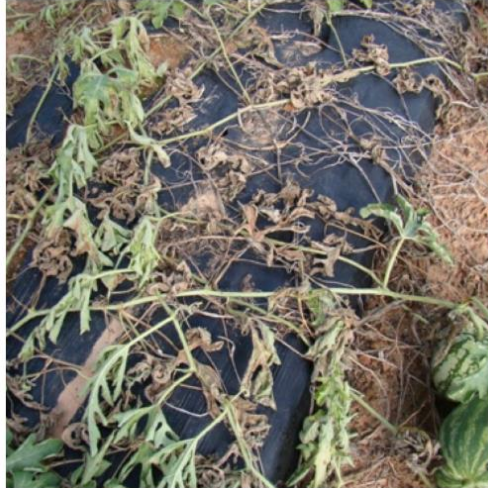
Slika 2. Primjer napada gljivice Rhizoctonia solani na stabljiku lubenice (Web 2).

narušavanja biodiverziteta te gljivice ovog roda pomažu u ponovnom uspostavljanju ravnoteže. Poznato je i djelovanje u kontroli korova. Osim gore navedenih prednosti ova gljivica je od iznimne važnosti i kada su u pitanju alternativni izvori energije.