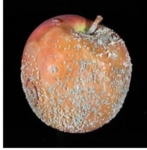
Slika 6. Primjer napada plave plijesni Penicillium expansum na plod jabuke (Web 5).

Kompeticija za hranjive tvari imala je najznačajniju ulogu u aktivnosti oba kvasca, naročito izolata R. glutinis . Direktna interakcija s hifama patogena utvrđena je samo kod izolata R. glutinis , dok kod aktivnijeg izolata Cryptococcus laurentii , ovakva pojava nije zabilježena. U odnosu na Rhodotorula glutinis , izolat Cryptococcus laurentii je in vitro producirao značajno više ekstracelularne beta-1,3-glukanaze, kada je uzgajan u prisustvu hifa patogena P. expansum i B. cinerea antibioza nije bila registrirana.