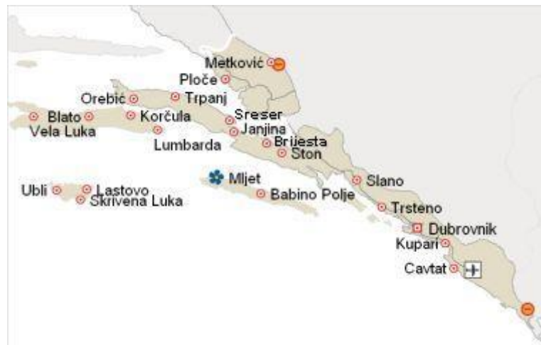
Slika 6: Geografski smještaj Arboretuma Trsteno (Web 6)

Arboretum Hrvatske akademije znanosti i umjetnosti u Trstenu najstariji je arboretum na svijetu smješten na hrvatskoj jadranskoj obali. Trsteno je primorsko mjesto smješteno 25 kilometara zapadno od Dubrovnika (Slika 6). U Trstenu je 1494. godine izgrađen ljetnikovac s perivojem. Prirodna ljepota krajolika prošarana raznovrsnim biljem i arhitektura stara nekoliko stoljeća glavne su odlike koje privlače turiste u najstariji arboretum. Za ovakvu ljepotu i sklad zaslužna je obitelj Gučetić/Gozze. Kulturni i gospodarski razvoj nekadašnje Dubrovačke Republike potaknula je ova obitelj u čijem je vlasništvu bio arboretum Trsteno (Obad Šćitaroci i Kovačević 2014).