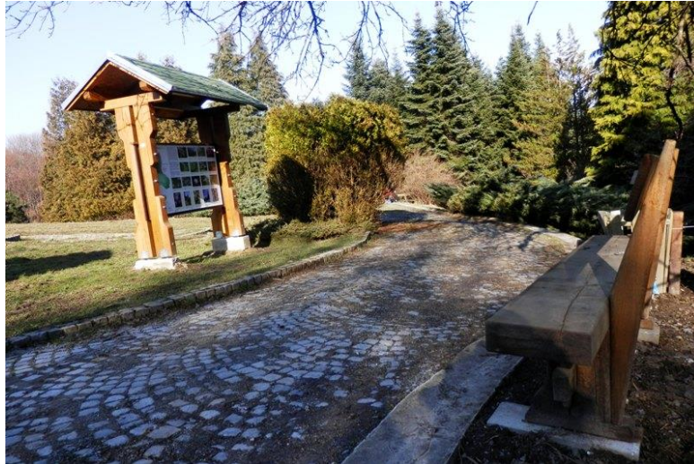
Slika 2: Arboretum Lisičine (Web 2)