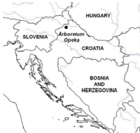
Slika 9: Geografski smještaj arboretuma Opeka (Preuzeto i prilagođeno prema Borak Martan i Šoštarić 2014)

godina, egzotične biljke dale su poseban značaj ovom arboretumu. Ipak, za izgled arboretuma najzaslužniji je Marko Bombelles mlađi. Za vrijeme njegove vladavine, 1884. godine, park je dobio svoj konačan izgled, kakav je i danas. Grof Marko Bombelles iskoristio je putovanja po čitavom svijetu kako bi povećao hortikulturni značaj svoga parka.