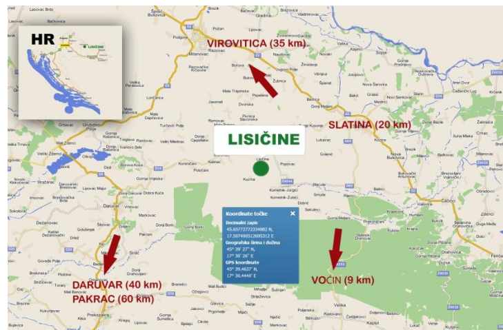
Slika 1: Geografski smještaj Arboretuma Lisičine (Web 1)

Arboretum Lisičine nalazi se na Papuku, a smješten je sjeverozapadno od sela Lisičine (Vidaković 1986). Taj je prostor podijeljen na manje dijelove, a to su Trešnjik, Bukvik, Japaga i Potoci. Na prva tri arboretum je smješten u užem smislu, dok su Potoci stara bukova sastojina (Vidaković 1986). Arboretum Lisičine nalazi se na području Šumarije Voćin (Slika 1.), UŠP Našice (Idžojić 2011).