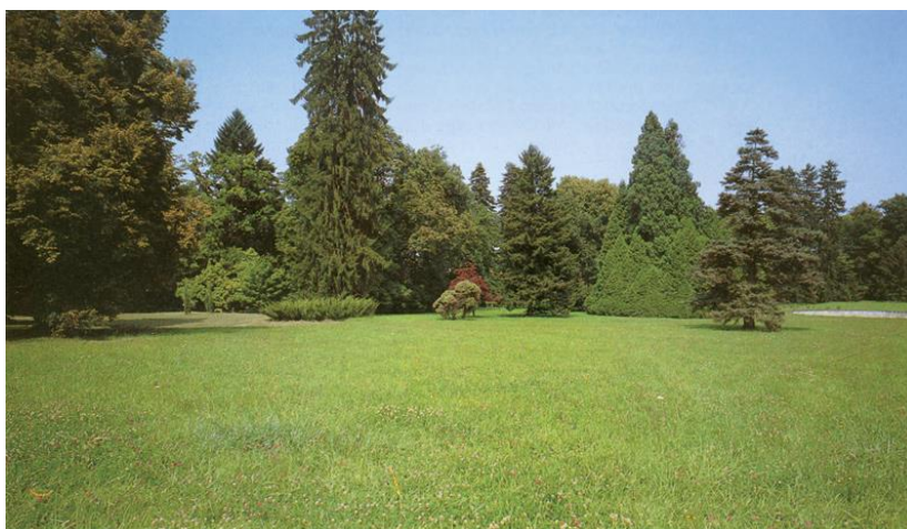
Slika 11: Travnjak arboretuma Opeka (Web 8)

Arrhenatherum elatius , Knautia arvensis , Pastinaca sativa , Trifolium pratense , Dactylis glomerata , Poa pratensis i Daucus carota . Fritillaria meleagris rijetka je biljka hrvatske flore koja naseljava vlažne travnjake. Na istraživanom području pronađene su i vrste koje se mogu ubrojiti u određene kategorije ugroženosti. Osjetljive vrste na ovom području su Fritillaria meleagris , Lilium martagon , Platanthera bifolia i Taxus baccata . Gotovo ugrožene vrste su Cephalanthera damasonium , Cyclamen purpurascens i Ruscus hypoglossum . U kategoriju najmanje zabrinjavajućih vrsta pripadaju Galanthus nivalis i Poa annua (Borak Martan i Šoštarić 2014). Također se u Arboretumu Opeka nalazi 36 zaštićenih vrsta i 9 strogo zaštićenih vrsta. Osim zaštićenih vrsta, u Arboretumu se nalaze invazivne vrste koje narušavaju biološku raznolikost područja. Osam invazivnih vrsta pronađenih ovdje su: Conyza canadensis , Erigeron annuus , Rudbeckia lacinata , Solidago gigantea , Phytolacca americana , Veronica persica , Parthenocissus quinquefolia i Galinsoga ciliata . Redovitim košenjem travnjaka (Slika 11) može se spriječiti širenje invazivnih vrsta (Borak Martan i Šoštarić 2011; Vitasović Kosić i sur. 2011; 2012).