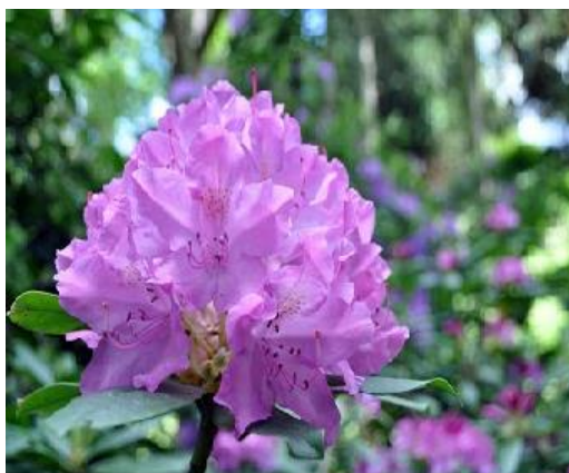
Slika 3: Rhododendron sp. (Web 3)