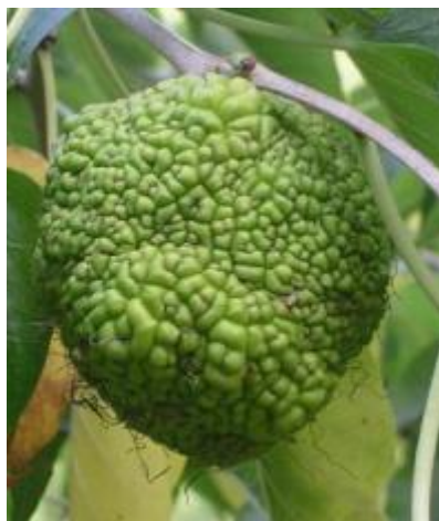
Slika 5: Plod vrste Maclura pomifera L. (Web 5)

pomifera / Raf. / C. K. Schneid, svojim zanimljivim plodom (Slika 5) također pridodaje ljepoti polja IX (Idžojić 2011).