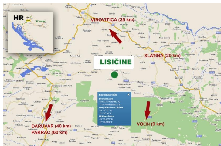
Slika 1: Geografski smještaj Arboretuma Lisičine (Web 1)

Arboretum Lisičine nalazi se na Papuku, a smješten je sjeverozapadno od sela Lisičine (Vidaković 1986). Taj je prostor podijeljen na manje dijelove, a to su Trešnjik, Bukvik, Japaga i Potoci. Na prva tri arboretum je smješten u užem smislu, dok su Potoci stara bukova sastojina (Vidaković 1986). Arboretum Lisičine nalazi se na području Šumarije Voćin (Slika 1.), UŠP Našice (Idžojić 2011).