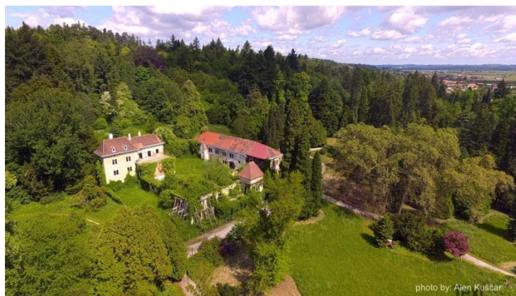
Slika 10: Dvorac arboretuma Opeka (Web 7)