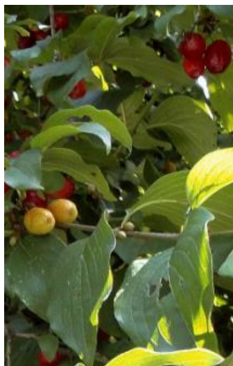
Slika 4: Cornus mas L. (Web 4)

'Cunningham's White' ima bijele cvjetove tijekom svibnja, ružičaste cvjetove ima Rhododendron Roseum 'Elegans', a žute cvjetove ima Rhododendron luteum Sweet koji je listopadna vrsta (Idžojić 2011).