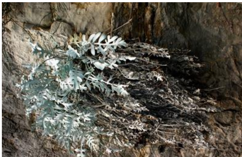
Slika 3. Dubrovačka zečina ( Centaurea ragusina )

naseliti neki od hazmofita, metodom uzgoja iz sjemena, pa tako i Dubrovačka zečina ( Centaurea ragusina ) čije su populacije bile nestale (slika 3) (Web 7).