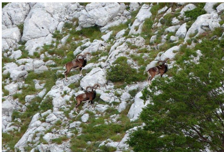
Slika 2. Botanički vrt „Kotišina“ PP Biokovo

nalaze se i endemi (38), zaštićene vrste (12), te strogo zaštićene vrste (4) (Popović i sur. 2011). U Vrtu se nalazi i slap koji je veći dio godine suh, ali za vrijeme kiša predstavlja vrlo lijep prizor za posjetitelje (Web 6).