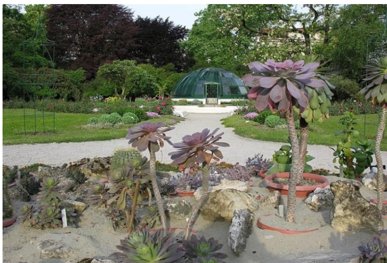
Slika 1. Botanički vrt PMF-a u Zagrebu

Vrt naseljavaju različite vrste beskraljeznjaka i kraljeznjaka, a zanimljivost Botaničkog vrta PMF-a u Zagrebu je i "vrtek", mali dječji vrtić uređen 2013. godine, u kojem se nalazi mala vrtlarska kućica, kompost i gredice za uzgajanje voća, povrća i cvijeća, pa se u tim pothvatima mogu okušati i oni najmlađi (Web 5).