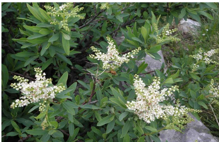
Slika 5. Hrvatska sibireja ( Sibirea altaiensis ssp. croatica )

U Vrtu postoji program volontiranja u kojem volonteri vode brigu o biljkama i na taj način ih održavaju u dobrom stanju (Šilić, 2011). Unatoč tome, Vrt i dalje nije u najidealnijem stanju po pitanju broja velebitskih vrsta koje predstavlja, ali i po pitanju ostalih funkcija koje jedan botanički vrt treba obavljati (Šilić, 2011).