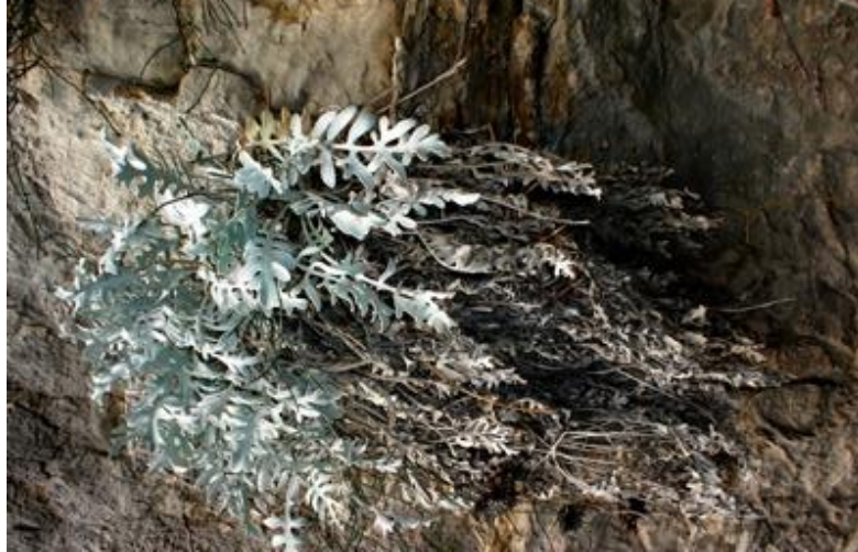
Slika 3. Dubrovačka zečina ( Centaurea ragusina )

naseliti neki od hazmofita, metodom uzgoja iz sjemena, pa tako i Dubrovačka zečina ( Centaurea ragusina ) čije su populacije bile nestale (slika 3) (Web 7).