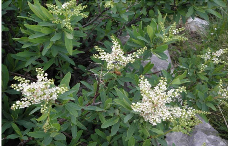
Slika 5. Hrvatska sibireja ( Sibirea altaiensis ssp. croatica )

U Vrtu postoji program volontiranja u kojem volonteri vode brigu o biljkama i na taj način ih održavaju u dobrom stanju (Šilić, 2011). Unatoč tome, Vrt i dalje nije u najidealnijem stanju po pitanju broja velebitskih vrsta koje predstavlja, ali i po pitanju ostalih funkcija koje jedan botanički vrt treba obavljati (Šilić, 2011).