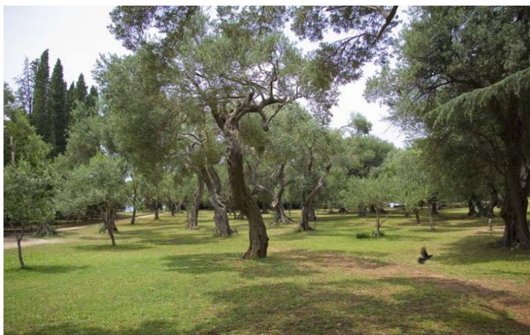
Slika 7. Botanički vrt na Lokrumu Sveučilišta u Dubrovniku

Botanički vrt na Lokrumu osnovan je 1959. godine u svrhu unošenja i istraživanja prilagodbe biljaka iz tropskih i suptropskih krajeva (Dolina i Jasprica, 2011). Vrt je u sklopu Posebnog rezervata šumske vegetacije od 1976. godine (Web 10), a tijekom Domovinskoga rata pretrpio je veliku štetu, kako u vidu biljaka, tako i u vidu objekata i dokumentacije (Dolina i Jasprica, 2011). Obnova Vrta započela je 1993. godine, a od 2006. godine djeluje u sastavu Instituta za more i priobalje Sveučilišta u Dubrovniku. Botanički vrt danas zauzima površinu od 2 hektara sa oko 400 biljnih vrsta, a posebna pozornost posvećena je biljkama važnim za šumarstvo, hortikulturu i farmaciju, odnosno drveću i grmlju mediteranskih klimata (slika 7). Zanimljivost ovog botaničkog vrta je zbirka eukaliptusa koja je osamdesetih godina prošloga stoljeća procijenjena kao najbogatija zbirka roda Eucalyptus izvan Australije i Novog Zelanda (Dolina i Jasprica, 2011).