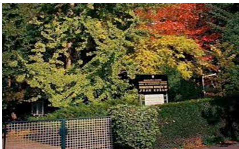
Slika 4. Farmaceutski botanički vrt "Fran Kušan"