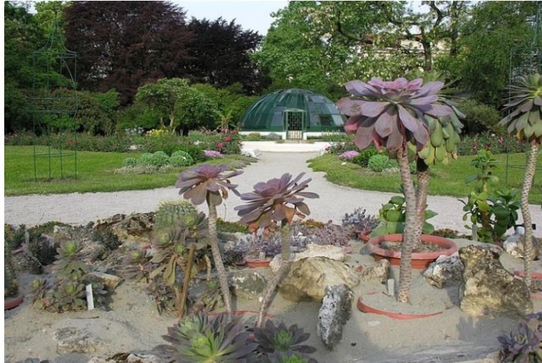
Slika 1. Botanički vrt PMF-a u Zagrebu

Vrt naseljavaju različite vrste beskraljeznjaka i kraljeznjaka, a zanimljivost Botaničkog vrta PMF-a u Zagrebu je i "vrtek", mali dječji vrtić uređen 2013. godine, u kojem se nalazi mala vrtlarska kućica, kompost i gredice za uzgajanje voća, povrća i cvijeća, pa se u tim pothvatima mogu okušati i oni najmlađi (Web 5).