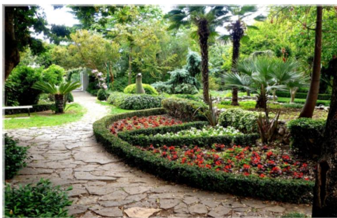
Slika 8. Školski botanički vrt „Ostrog“, Kaštel Lukšić (Web 11)