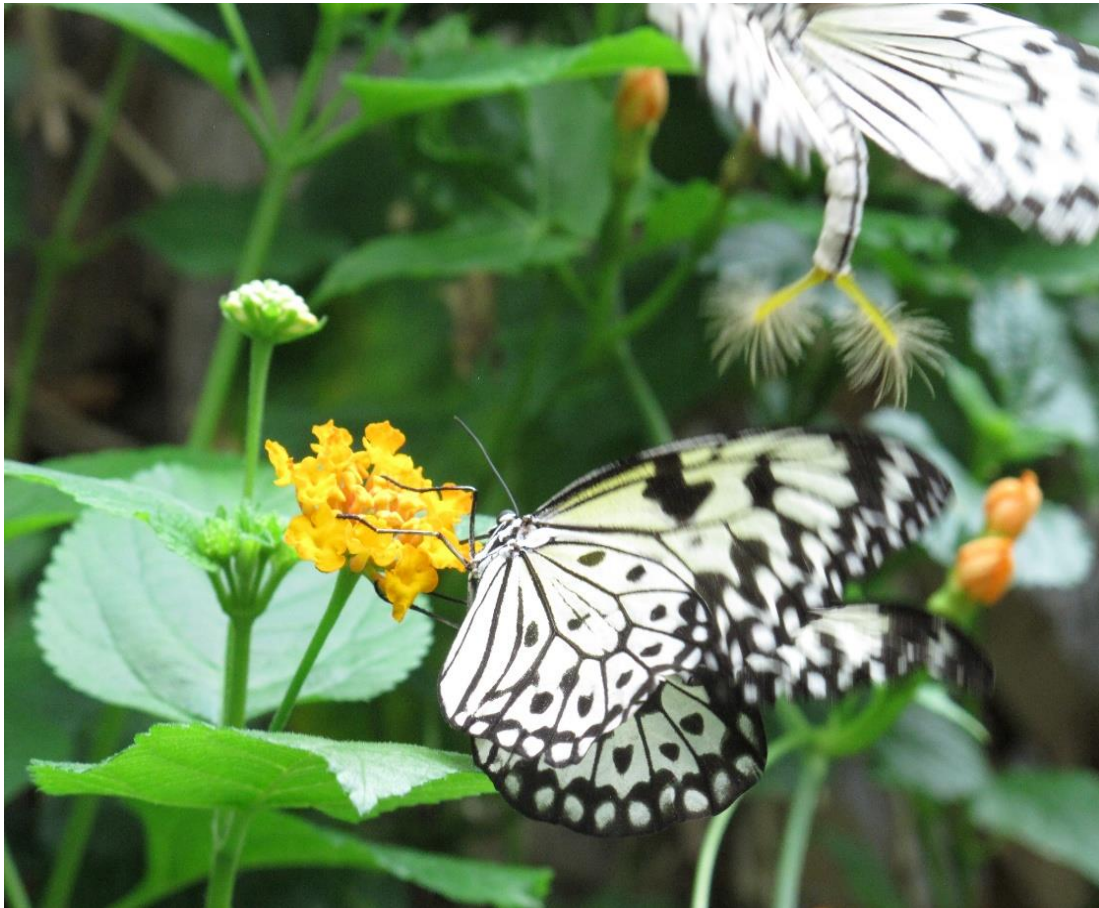
Slika 4. Mužjak lebdi iznad ženke i priprema se za parenje.