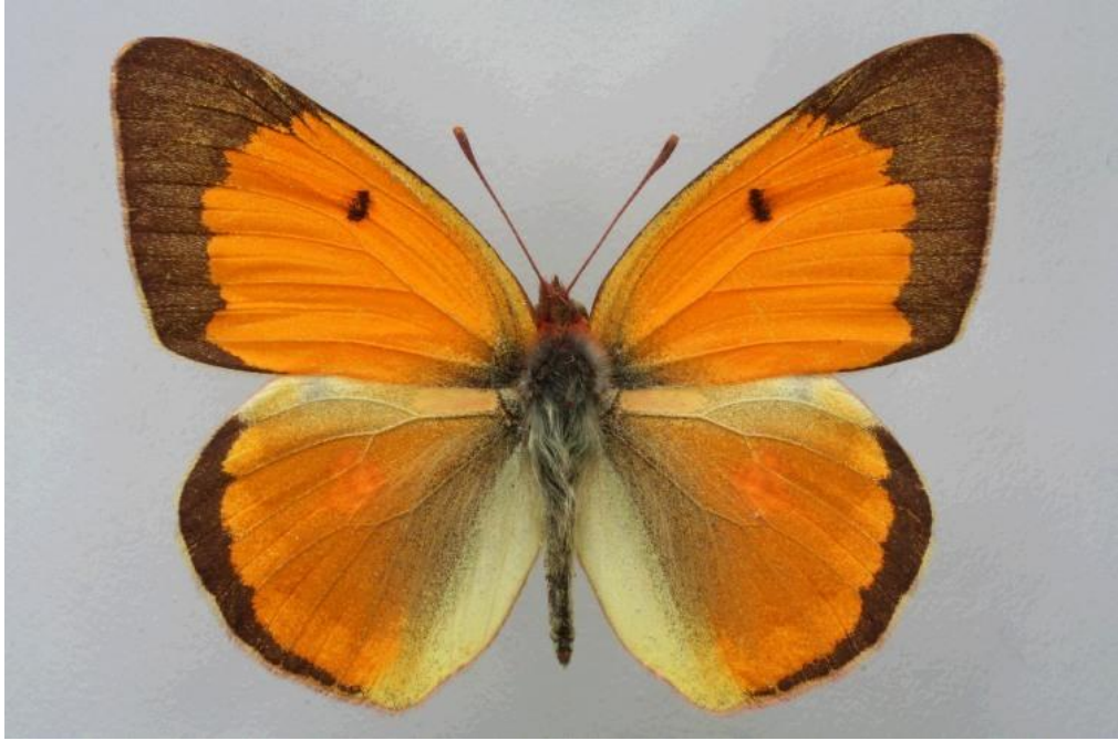
Slika 2. Morfologija odraslog leptira narančasti poštar ( Colias myrmidone )