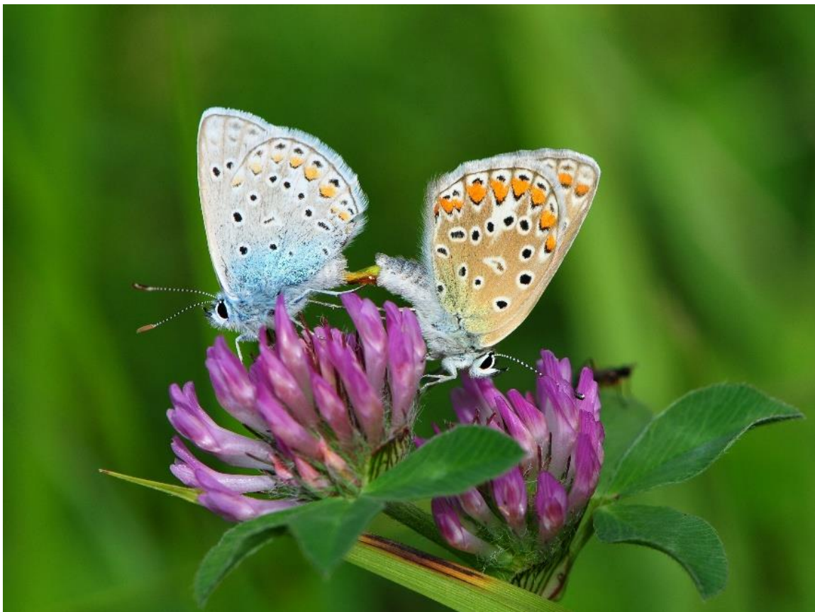
Slika 3. Spolni dimorfizam običnog plavca ( Polyommatus icarus ). Mužjak običnog plavca (lijevo) i ženka (desno).

Boja krila ima značaj u komunikaciji leptira. U komunikaciji mužjaci i ženke koriste obojenost krila i pokret. Kod danjih leptira mužjaci i ženke mogu biti različito obojeni što je jedno od obilježja spolnog dimorfizma. Spolni dimorfizam uobičajen je kod većine vrsta iz porodice plavaca ( Lycaenidae ) gdje je osnovna boja gornje strane prednjih i stražnjih krila mužjaka plava, a ženki smeđa (Web 5) (Slika 3) (Web 6).