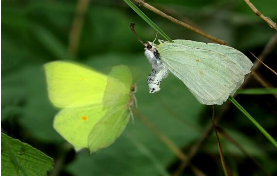
Slika 6. Ženka vrste Gonepteryx rhamni podiže zadak kako bi signalizirala odbijanje mužjaka.

prethodnog rituala. Većina leptira ostaje u kopulaciji sat vremena ili nešto duže, ali kod žučka ostaju u kopulaciji i do 17 dana (Web 8).