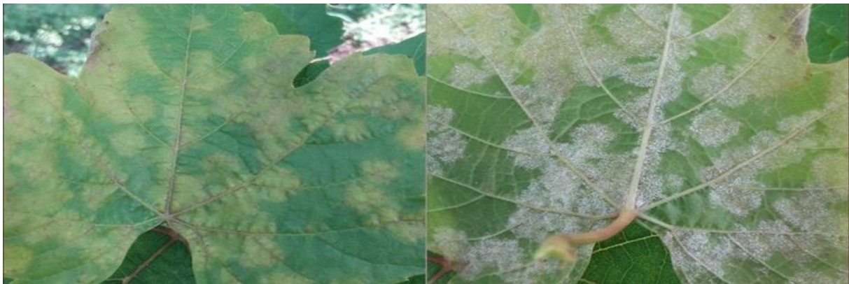
Slika 7. List vinove loze zahvaćen plamenjačom [ web 14 ]

Postoji nekoliko načina zaštite od infekcije. Prije svega, kod sadnje vinograda bilo bi dobro izabrati one vrste koje su otpornije na ovaj patogen. Osim toga redovito uklanjanje zaraženih listova, vitica, cvjetova i ostaloga smanjuje mogućnost širenja bolesti. I naravno redovito tretiranje fungicidima. [ Web 14 ]