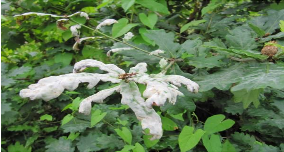
Slika.3. List hrasta zaražen fitopatogenom gljivom Erysiphe alphitoides [ web 9 ]

Najveću štetu ova gljiva čini sadnicama hrasta, dok starija stabla puno lakše podnose prisutnost ovog patogena. Međutim, ukoliko je prisutnost patogena u kombinaciji sa nekim drugim štetnim čimbenikom, kao što je naježda insekata koji se hrane lišćem, tada to može dovesti propadanja hrasta [ web 9 ].