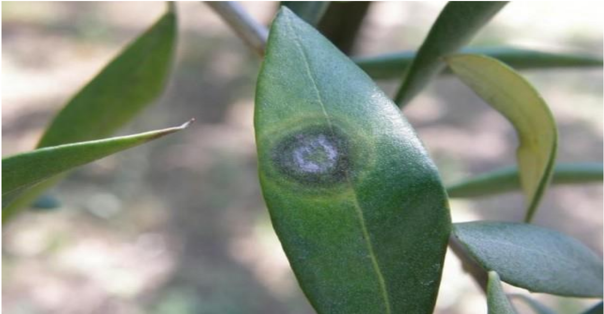
Slika 12. List masline zaražen bolešću paunovo oko [ web 19 ]

Najčešća bolest maslina u Hrvatskoj je pojava „paunovog oka“, bolesti koju izaziva gljivica Spilocaea oleagina [ 4 ]. Na bolest „paunovog oka“ najviše u osjetljiva stabla koja žive u uvjetima sjene i visoke vlage. Simptomi bolesti pojavljuju se uglavnom na gornjoj strani listova, gdje se pojavljuju kruglaste pjege ili mrlje, veličine 10 do 12 mm, a vremenom se oko pjega formira žuto-zeleni prsten, dok centralni dio posmeđi, odakle i dolazi naziv „paunovo oko“. Pjege obično pokriju cijeli list, što vremenom dovodi do otpadanja listova. Ostali organi biljke rjeđe su podložni zarazi ovom bolesti, a ukoliko dođe do nje, tada je ona prepoznatljiva po smeđim pjegicama. Suzbijanje ove zaraze provodi se dva puta godišnje, s obzirom na vrijeme početka infekcije, kod nas još pomoću fungicida na bazi bakra, dok se u ostalim zemljama EU rabe se fungicidi na organskoj bazi. Bakar iz fungicida, osim što suzbija spomenutu bolest, povoljno djeluje i na rak masline. [ web 18 ]