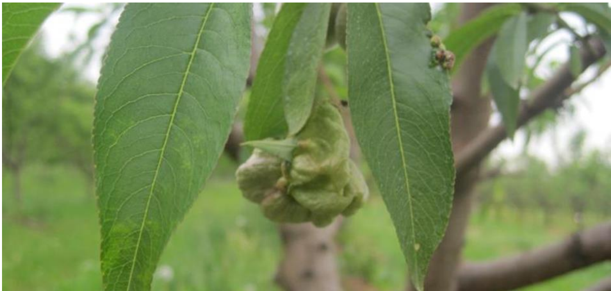
Slika 9. List breskve zaražen fitopatogenom gljivom Taphrina deformans [ web 16 ]

Nekoliko je načina zaštite od ovog patogena. Ako se radi o manjoj površini inficiranoj ovim patogenom, infekciju je moguće smanjiti kidanjem inficiranih listova te rezidbom zaraženih izbojaka. Također je infekciju moguće smanjiti tretiranjem breskve različitim fungicidima.