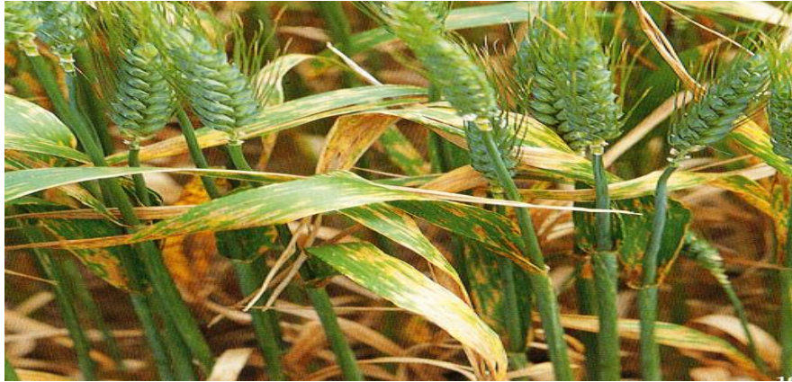
Slika 5. List pšenice zaražen fitopatogenom gljivom Septoria tritici [ web 12 ]

stotina tisuća dolara. Usprkos tomu, i dalje je vrlo teško kontrolirati ovu fitopatogenu gljivu jer je vrlo otporna, a i genetički gledano vrlo raznolika. Drugim riječima vrlo brzo postaje otporna na sredstva zbog brzih varijacija u genetičkom kodu kroz generacije [ Web 12 ].