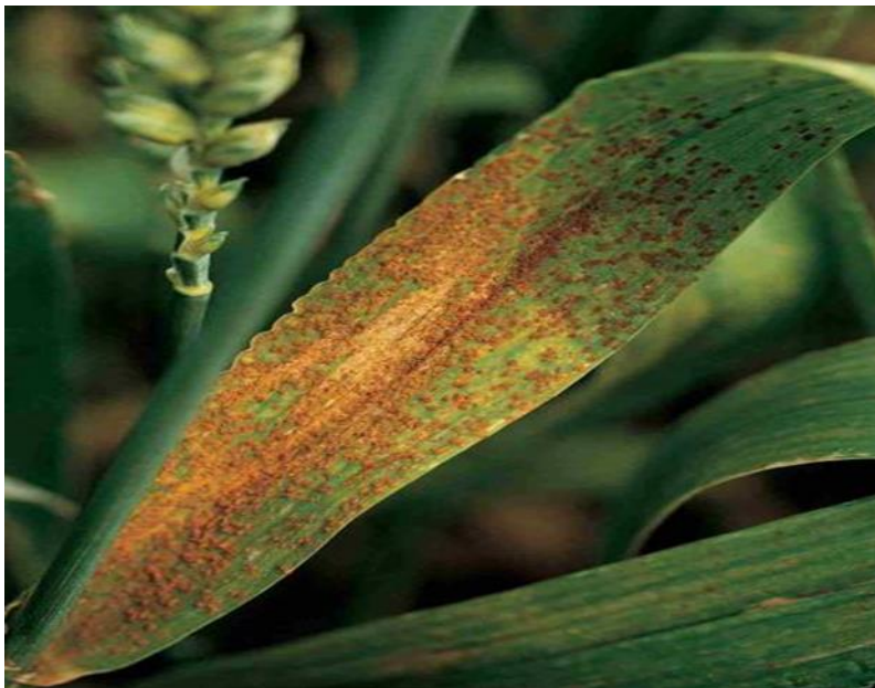
Slika 10. Pšenica zaražena fitopatogenom gljivom Puccinia recondita (bolest poznata kao „smeđa hrđa“) [ web 17 ]

Smeđa hrđa pšenice bolest je koju uzrokuje fitopatogena gljiva Puccinia recondita . Redovito dolazi sa pšeničnim usjevom, a napada zelene listove pšenice, jer jedino na takvom listu ovaj patogen može opstati. Optimalne temperature za klijanje spora ove fitopatogene gljive su od 15°C do 20°C, te treba vioku vlažnost zraka. Bolest se suzbija preventivno, prije same pojave simptoma, ili pri pojavi prvih simptoma bolesti. Pri tretiranju se koriste fungicidi na bazi strobilurina ili triazola [ web 17 ].