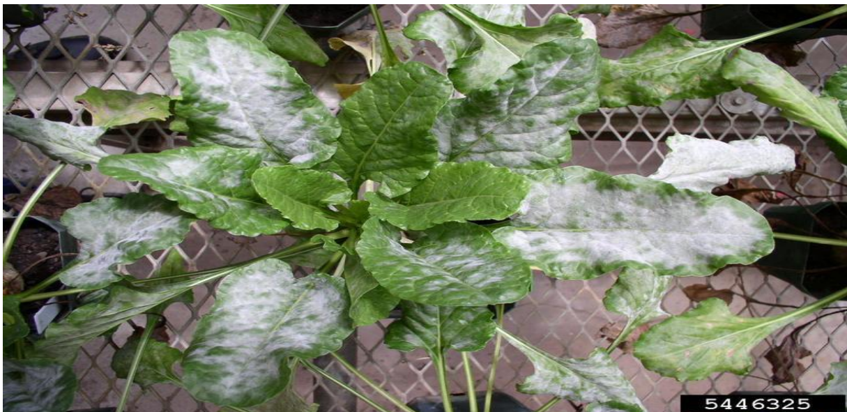
Slika 4. List zaražen fitopatogenom gljivom Erysiphe betae [ web 10 ]

Sredstava za tretiranje ovog patogena u pravilu nema, najbolja prevencija je pokušati zaštititi sjeme da ne dođe u kontakt s patogenom. [Web 10 ]