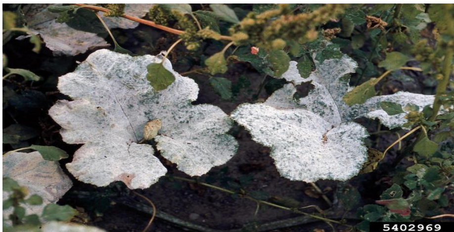
Slika 2 Biljka zaražena Erysiphe cichoracearum [ web 8 ]

Prvi simptomi prisutnosti ove gljive su bijele točke na površini listova i stabljike.