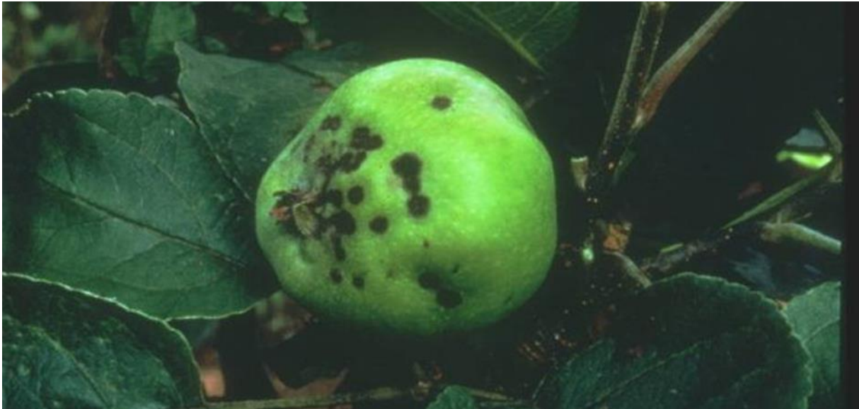
Slika 8. Plod jabuke zaražen fitopatogenom gljivom Venturia inaequalis [ web 15 ]

vrijeme cvatnje koriste se strobilurinimi. Što su plodovi jabuke stariji, to su otporniji na pojavu bolesti, stoga je vrlo važno reagirati pri pojavi prvih simptoma na mladim listovima. [Web 15 ]