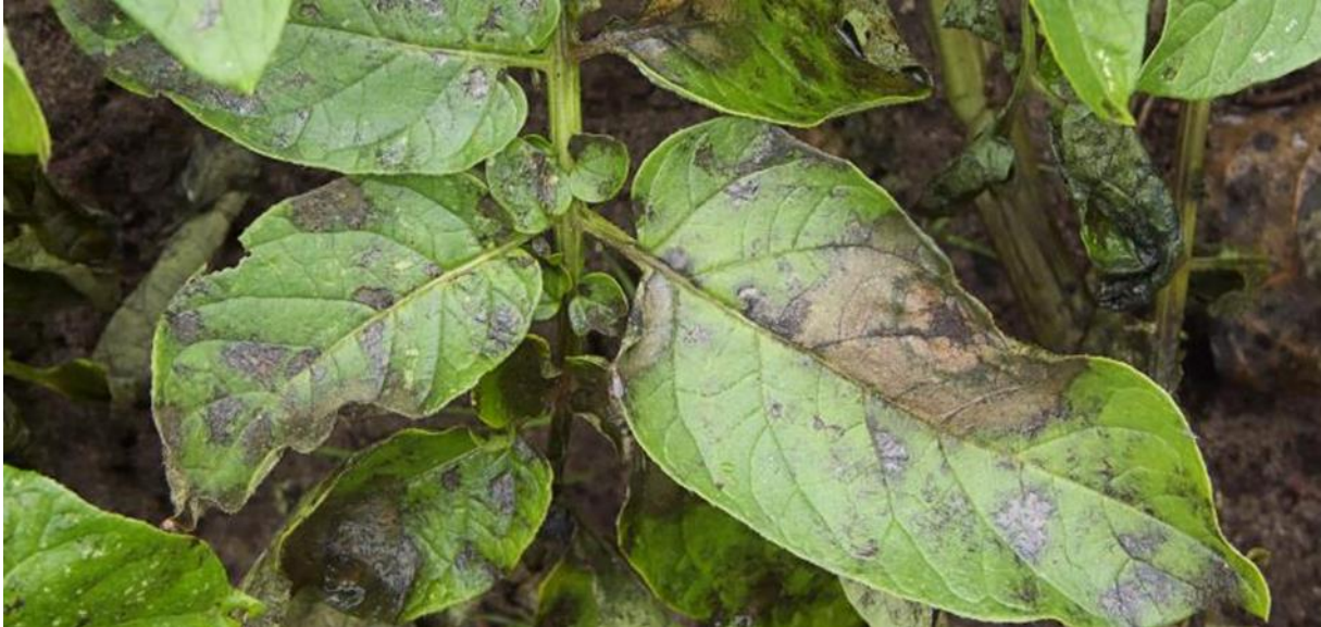
Slika 6. Plamenjača na listu krumpira [web 13 ]

Kako bi se spriječila pojava ove bolesti, ili bar pokušala spriječiti, potrebno je napraviti nekoliko stvari. Prije svega, treba se držati plodoreda, jer se patogen zadržava ostacima biljaka. „Osim toga treba saditi zdrave gomolje, jer su oni glavni izvor zaraze. Zaraženi gomolji imaju površinska udubljenja plavo-smeđe boje. Ukoliko nismo sigurni je li gomolj zaražen ili nije, to se lako može potvrditi na njegovom presjeku.“ [ web 13 ] Naime, zaraženi gomolj ispod površinskih udubljenja ima tkivo hrđavo-smeđe boje. Osim toga, suzbijanju će svakako doprinijeti izbor otporne sorte krumpira, sadnja u toplo tlo koje nije preduboko, kvalitetna gnojidba i slično.