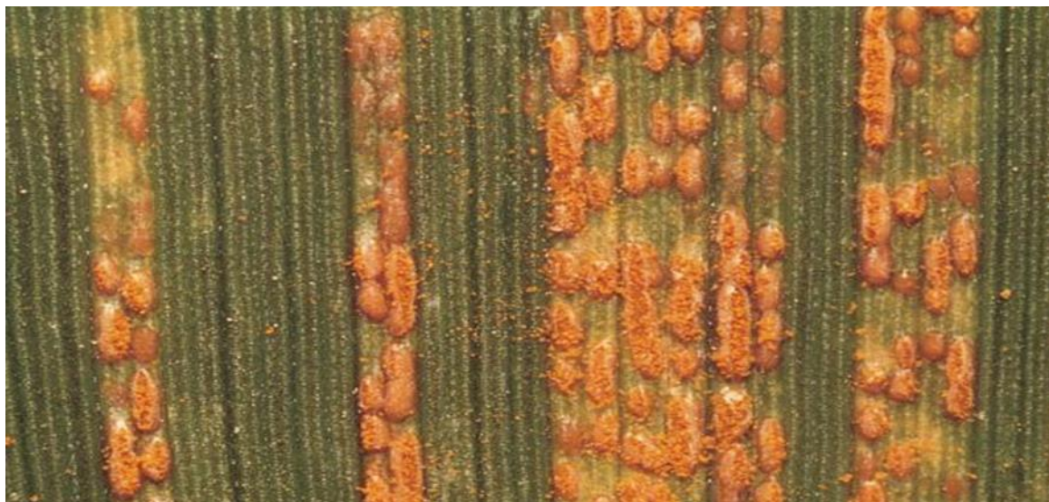
Slika 11. Pšenica zaražena gljivicom Puccinia striiformis ( bolest poznata pod nazivom „žuta hrđa“ ) [ web 17 ]

pojavi prvih simptoma. Fungicidi koje koristimo za suzbijanje bolesti isti su kao i kod smeđe hrđe.