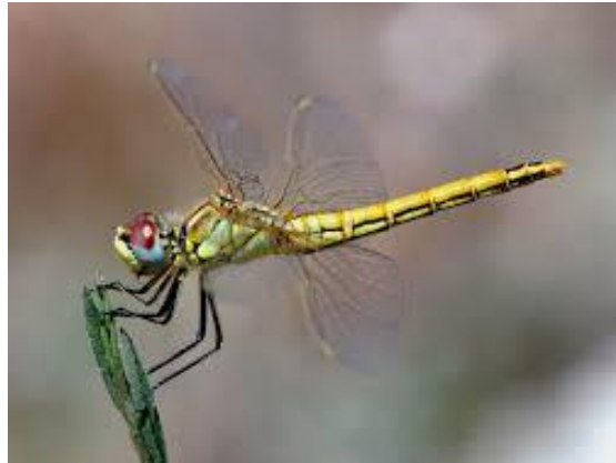
Slika 24. Sympetrum fonscolombii (Web 32)

plitke. Ličinke žive na mulju ili na vodenim biljkama gdje miruju i iščekuju plijen. Najčešće se vrsta viđa između lipnja i listopada (Belančić i sur., 2008).