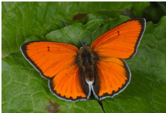
Slika 4. Lycaena dispar (Web 12)