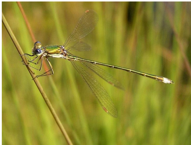
Slika 18. Lestes virens (Web 26)

boje brončana odsjaja, preko oprsja protežu se bljedo žućkaste pruge koje na donjem dijelu prelaze u potpunosti u žućkasto obojenje. Pterostigma je na krilima mužjaka i ženke jednolično smeđa. Veličine je 30-39 mm. Malu zelendjevicu obično možemo pronaći na grmlju ili visokim travama uz rubove lokava i jezera u kojima se razmnožava. Lokve u kojima se razvijaju ličinke te elegantne vrste pripadaju sezonskom tipu, odnosno presušuju, a okružuje ih sloj trske ili slične močvarne vegetacije. Ženka polaže jaja sama ili u paru, obično krajem ljeta, i to često u žive ili suhe stabljike roda Juncus ili Oenanthe . Malu zelendjevicu u odraslom obliku možemo vidjeti već od travnja pa sve do listopada (Belančić i sur., 2008).