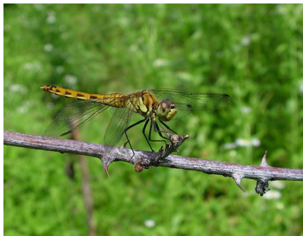
Slika 22. Sympetrum depressiusculum (Web 30)

Oprsje u mužjaka močvarnog strijelca žuto je do smeđe, ipak izrazitije žuto po bokovima. Zadak je spljošten i širok, tamno narančaste boje koja se po bokovima prelijeva u žutu. Parovi crnih trokutastih pjega ukrašavaju bočnu stranu od četvrtog do sedmog zadčanog kolutića. Samo na osmom i devetom kolutiću tamne su pjege i na gornjoj strani zatka. Na ženkama prevladavaju žute i smeđe boje sa sličnim rasporedom crnih pjega kao i na mužjaku. Krila su oba spola ukrašena dugačkom crvenkastom pterostigmom i, za razliku od ostalih strijelaca, gušćim ožiljenjem na vrhovima. Samo je osnovica stražnjeg para krila blago žute boje. Noge obaju spolova potpuno su crne. Veličine tijela 29-34 mm. Stanište močvarnog strijelca stajace su vode, lokve, ribnjaci, močvare, i to u nizinama. Za razliku od mnogih strijelaca, močvarni strijelac neradi se seli te ga nalazimo blizu mjesta na kojima se razmnožava. Vrsta je osjetljiva na promjenu staništa. Ličinke se razvijaju brzo; za otprilike dva mjeseca već su spremne za presvlačenje. Nakon parenja ženka polaže jajašca u vodu među biljke. Tek idućeg proljeća iz njih će se razviti ličinke. Vrsta najčešće izlijeće u kasno ljeto, u srpnju, a pokoja jedinka zabilježena je već i od svibnja. Najbrojnija je u kolovozu, ali je katkada možemo vidjeti i do listopada (Belančić i sur., 2008).