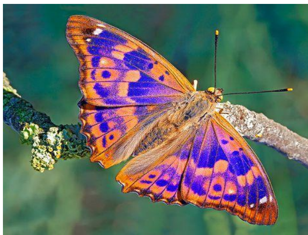
Slika 5. Apatura ilia (Web 13)

Apatura iris (Linnaeus, 1758) – velika modra preljevalica