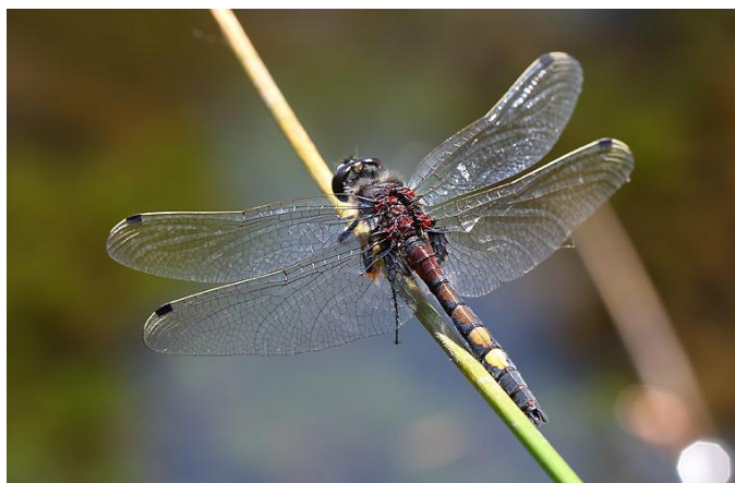
Slika 20. Leucorrhinia pectoralis (Web 28)

Orethrum ramburii (Selys, 1848) – istočni vilenjak