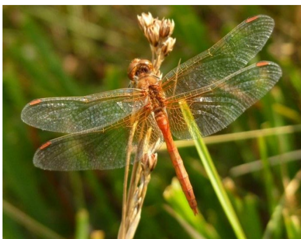
Slika 23. Sympetrum flaveolum (Web 31)

kao i ostalim strijelcima. Razlikuju se po crno obojenoj bočnoj strani mužjakova zatka i crnoj neprekinutoj crti koja se pruža po boku ženkinog zatka. Crna pruga na bazi čela je izrazitija i spušta se duž prednjih rubova očiju. Gledano s bočne strane, prednja kukica na sekundarnom spolnom organu mužjaka vrlo je mala, dok, gledano odozdo, leglica ženke ima dva ušiljena izbočenja. Veličine je 32-37 mm. Razmnožava se u malim, plitkim stajaćim vodama koje se brzo zagrijavaju i obiluju vegetacijom, primjerice na povremeno poplavljenim livadama zamočvarenih dolina. Ličinke možemo naći ili na dnu ili na vegetaciji, a odrasli se često skupljaju na sunčanim livadama nedaleko od mjesta s kojeg su izletjeli. Polaže jajašca u dvojcu, a za to izabire rubna livadna područja koja poplavljuju u proljeće. Vrsta je najbrojnija u kolovozu (Belančić i sur., 2008).