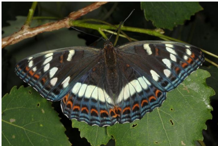
Slika 7. Limenitis populi (Web 15)

Veličinom imaga od 70 do 80 mm topolnjak pripada među naše najveće danje leptire. Odlikuje se prepoznatljivom tamno smeđom bojom gornje strane krila, manjim bijelim područjima na prednjim krilima i krivudavom bijelom linijom na stražnjim krilima te prepoznatljivom crvenkastom linijom uz apikalne rubove prednjih i posebno stražnjih krila. Donja strana krila ima specifične šare u bijeloj, crvenkasto-smeđoj i sivkasto-plavoj boji, a bočni rubovi krila izraženu bijelu isprekidanu liniju. Tipična su staništa topolnjaka otvorene bjelogorične i miješane šume na čijim rubovima raste biljka hraniteljica jasika, Populus tremula . S gornje strane listova ženka odlaže okrugla zelena jaja (Šašić i sur., 2015).