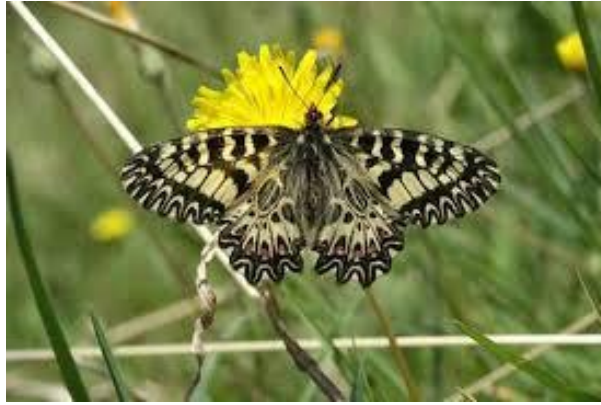
Slika 8. Zerynthia polyxena (Web 16)