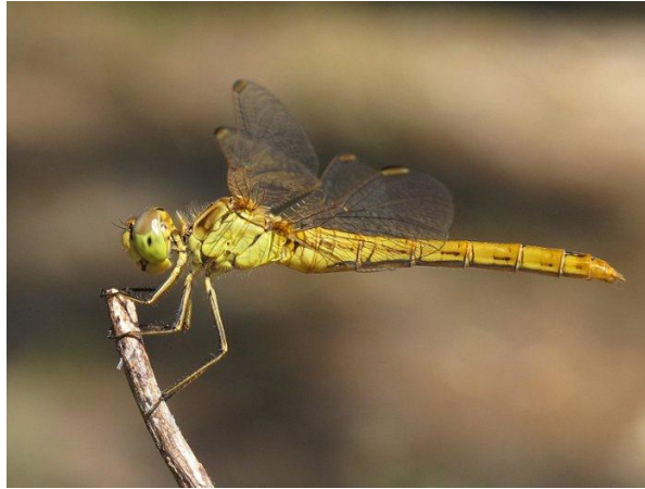
Slika 25. Sympetrum meridionale (Web 33)

Sympetrum vulgatum (Linnaeus, 1758) - mali strijelac