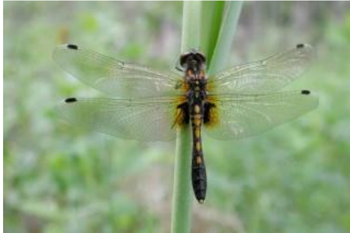
Slika 19. Leucorrhinia caudalis (Web 27)

neprijatelja. Često borave na donjoj strani plutajućeg vodenog bilja gdje vrebaju plijen – ličinke drugih kukaca ili račiće. Razvoj im traje dvije godine. Vrlo su brojni u svibnju, lipnju i srpnju (Belančić i sur., 2008).