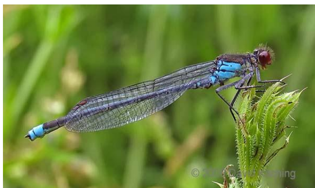
Slika 12. Erythroma najas (Web 20)

žučkasto zelenkast. Zadak mužjaka je gotovo crn, svijetlo plav samo na prvom i na zadnja dva zadčana kolutića. Zadak ženke je tamno smeđ, a mlađih jedinka brončan. Zadčani nastavci mužjaka su tamni i ravni, za razliku od ostalih pripadnika roda kojima su zadčani nastavci savijeni poput kliješta. Vrhovi stražnjih krila gušće su ožiljeni od prednjih. Veličine je 30-36 mm. Velika crvenookica bira stajaće ili sporo tekuće vode bogate vegetacijom: lokve, jezera, kanale i stare rukavce. Stanište mora imati i pogodno mjesto za polaganje jajašaca; ovoj će vrsti odgovarati stabljike lopoča, lokvanja i sličnog bilja koje imaju plutajuće lišće. Ženke polažu jajašca u pratnji mužjaka. Najbrojniji su u lipnju (Belančić i sur., 2008).