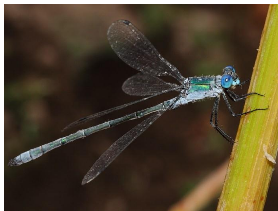
Slika 16. Lestes dryas (Web 24)

Zbog slične boje i veličine gorsku zelendjevicu lako je pobrkati sa sjevernom zelendjevicom. Međutim od nje se razlikuje po tome što su joj oči intenzivnije plave, a što je prvi i samo djelomično drugi zadčani kolutić mužjaka plavičasto voštano obojen. Zadčani nastavci su crni, a donji su širokih, prema unutra zakrivljenih vrhova. Ženke su izrazito robusne građe. Zelene su boje bez plavičasto voštane obojenosti. Zeleno im zahvaća i bočne dijelove prednjeg kolutića prsa, a mrlje na gornjoj strani drugog zadčanog kolutića su četvrtaste. Leglica prelazi stražnji rub desetog zadčanog kolutića. Veličine je 35-40 mm. Gorska zelendjevica nalazi stanište u širokom rasponu neutralnih do kiselih stajaćih voda koje ljeti većinom presušuju ili su reducirane na male lokvice u kojima preživljavaju ličinke. Ženka polaže jajašca u biljke Scirpus sp. , Eleocharis palustris , Alisma plantago , Galium palustre , Juncus sp. Najbrojnije su u srpnju i kolovozu (Belančić i sur., 2008).