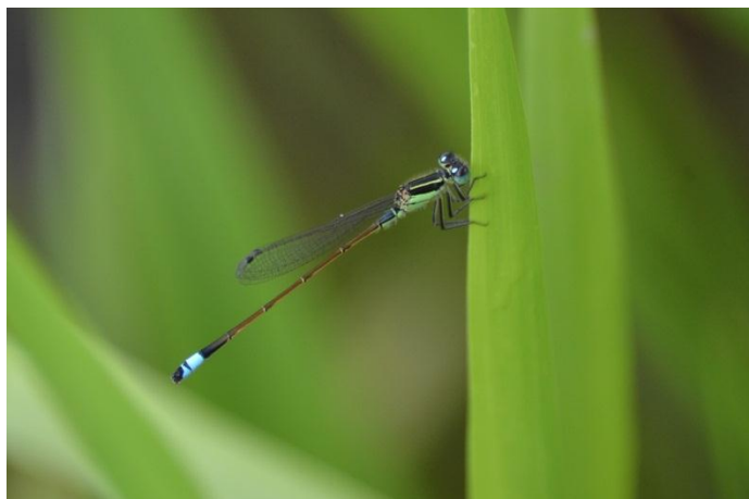
Slika 21. Orethrum ramburii (Web 29)

Uz primorskog vilenjaka jedina je naša svojta vilenjaka potpuno modra tijela. Sličan i srodan zapadnom vilenjaku od kojeg se razlikuje modrim i razmjerno širim oprsjem, žućkastim licem, koje lijepo ističe plave oči, građom spolnog ustroja, ušiljenim i vitkijim zatkom, prozirnim krilima te nešto kraćom, 3,5 mm dugom pterostigmom. Oprsje je spolno zrelih mužjaka potpuno presvučeno plavičastim voskom i nema svijetlih pruga. Gledano s bočne strane, prednja izbočina na sekundarnom spolnom ustroju mužjaka je trokutasta i blago povijena unatrag. Ženka je svjetlo smeđa i ima prozirna krila. Veličine je 36-45 mm. Neki autori istočnog vilenjaka smatraju podvrstom zapadnog vilenjaka. Zbog toga njegova biologija još nije potpuno rasvijetljena. Isto kao i u srodnog zapadnog vilenjaka, stanište istočnog vilenjaka čine stajaće i tekuće vode, uključujući i male potoke i izvorišta. Odrasli se u Hrvatskoj pojavljuju od konca travnja do studenog (Belančić i sur., 2008).