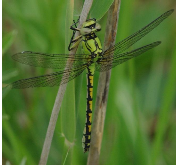
Slika 14. Ophiogomphus cecilia (Web 22)