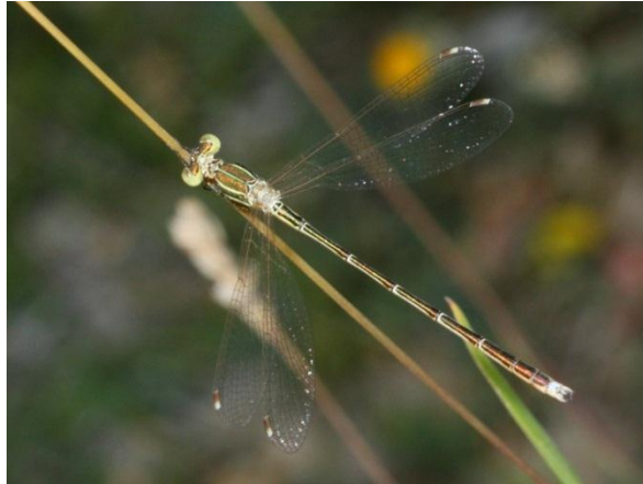
Slika 15. Lestes barbarus (Web 23)

Lestes dryas (Kirby, 1890) – gorska zelendjevica