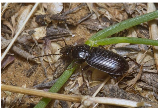
Slika 3. Pterostichus taksonyis (Web 11)

Informacije o opisu i biologiji vrste Pterostichus taksonyis nisu dostupne.