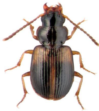
Slika 1. Acupalpus meridianus (Web 8)

Veličine 3-4,4 mm. Nije vezan uz vodu, uglavnom boravi na sušim mjestima (Web 5). Nalazi se na otvorenim sunčanim područjima, izbjegava sjenu. Voli pjeskovitu ilovaču i glinu (Web 6). Toraks je crn i ima duboki centralni uzdužni žlijeb. Pokrov krila je žute boje, ali ima crnu mrlju otraga, 2/3. Hiberniraju i pare se u proljeće (Web 7).