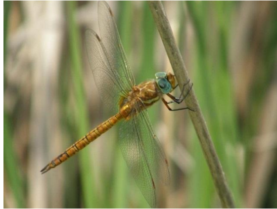
Slika 9. Anaciaeschna isosceles (Web 17)