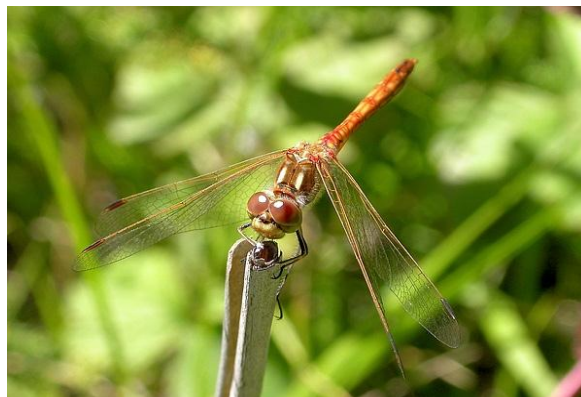
Slika 26. Sympetrum vulgatum (Web 34)

Mužjaci malog strijelca imaju smeđa oprsja s crnim prugama i crveno-narančast zadak s uočljivo širim šestim, sedmim i osmim kolutićem. Crne pjege u obliku trokutića na gornjoj strani osmog i devetog kolutića jako su male, ali ipak uočljive. Boja tijela ženki više je žuta ili smečkasta, s crnim pjegama, nešto većim no u mužjaka, na osmom i devetom kolutiću zatka. Crna pruga na osnovici čela proteže se niz prednjih rubova očiju. Baza krila obaju spolova je čista, posve lišena pjega, ali s blagim žućkastim (ženka) i crvenim (mužjak) odsjajem žilica. Pterostigma na vrhu krila dugačka je i tamno smeđa. Gledano s bočne strane, leglica ženki zauzima pravi kut u odnosu na zadak i vrlo je uočljiva, dok je prednja kukasta izbočina na sekundarnom spolnom ustroju mužjaka malena. Veličine je 35-40 mm. Ličinke malog strijelca mogu se naći u stajaćim vodama s bogatom vegetacijom: u lokvama, jezerima, močvarama, katkada i izrazito sporo tekućim potocima. Ženke polažu jajašca uz rub vode, a mužjaci ih pri tome prate i nadgledaju (Belančić i sur., 2008).