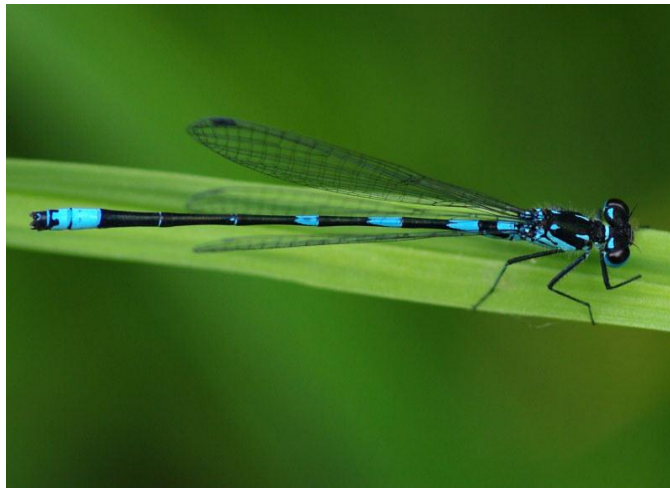
Slika 11. Coenagrion pulchellum (Web 19)

Izduženo i vitko plavo vretence dojmljivo je zbog crnih oznaka po tijelu. Mužjacima ljupke vodendjevojčice svojstven je crni znak na drugom kolutiću zatka, najčešće sličan slovu Y. S gornje strane crno-plavog oprsja jasno se razaznaju dvije plave pruge, koje imaju izgled uskličnika. Treći do peti kolutići zatka mužjaka većinom su modri, ali postoje i jedinke s većinom crnim kolutićima. Šesti i sedmi kolutić zatka uglavnom su crni dok je osmi potpuno modar. Ženke su slične boje kao i mužjaci, ali su uglavnom zelenkasto-plavkaste, u kombinaciji s crnim oznakama koje u njih nalazimo u više inačica nego u bilo kojih ženki ostalih svojta roda. Gledano bočno, gornji i donji zadčani privjesci mužjaka gotovo su iste dužine, a gledano odozgo, pri osnovi se gotovo dotiču. Pterostigma je na prozirnim krilima obaju spolova mala i sivkasta. Veličine je 34-38 mm. Jezera, lokve, sporo tekući potoci, rijeke i kanali, obično s bujnom vegetacijom, stanište su ljupke vodendjevojčice. Pri spolnom sazrijevanju odrasle jedinke borave na livadama i poljima nedaleko od vode. Par polaže jajašca na donju stranu plutajućih listova živućih ili već uginulih vodenih biljaka, stvarajući osobitu spiralnu šaru na plojki lista. Vrsta je najbrojnija kasno u svibnju i lipnju (Belančić i sur., 2008).