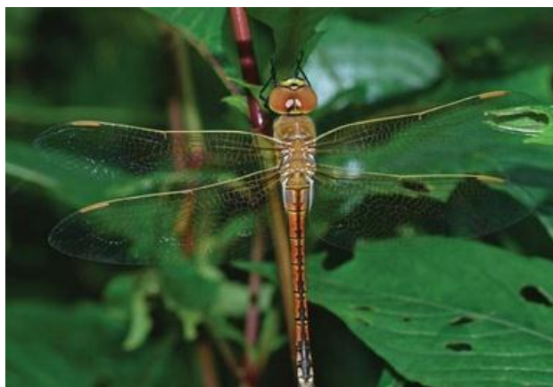
Slika 10. Hemianax ephippiger (Web 18)

Tijelo svojte je boje pijeska. Svjetlo plava boja drugoga kolutića zatka u mužjaka uočljiva je na prvi pogled. Plavi dio ženkin zotka nije izrazit ili ga uopće nema. Smeđe oči nerazmjerno su veličinom njegovu kratkom i vitkom zotku. Smeđa boja očiju i oprsja obaju spolova ograničena je samo na gornji dio tijela dok je donji žućkasto zelenkast. Pješčana podloga zotka ukrašena je tamnim oznakama koje se protežu duž srednjeg dijela svakog kolutića. Mužjaci od osmog do desetog kolutića imaju uočljive svjetlo smeđe do žućkaste točke. Gornji zadčani nastavci završavaju oštro dok je trokutasti donji nastavak pun zubaca. Ženke imaju velike, široke i zašiljene zadčane nastavke. Krila obaju spolova umrežena su crnim i smeđim žilama, djelomično blago žućkasto obojena s velikom smeđom pretostigmom. Veličine je 61-70 mm. Grof skitnica razmnožava se u malim, plitkim, toplim i često privremenim vodenim staništima koja mogu biti i blago bočata. To je pokretljiva i seobama sklona vrsta koja se pojavljuje na različitim mjestima, ali izbjegava šumovita područja. Jaja većinom polažu u dvojcu, i to u raspadnuti biljni materijal na dnu vodene površine (Belančić i sur., 2008).