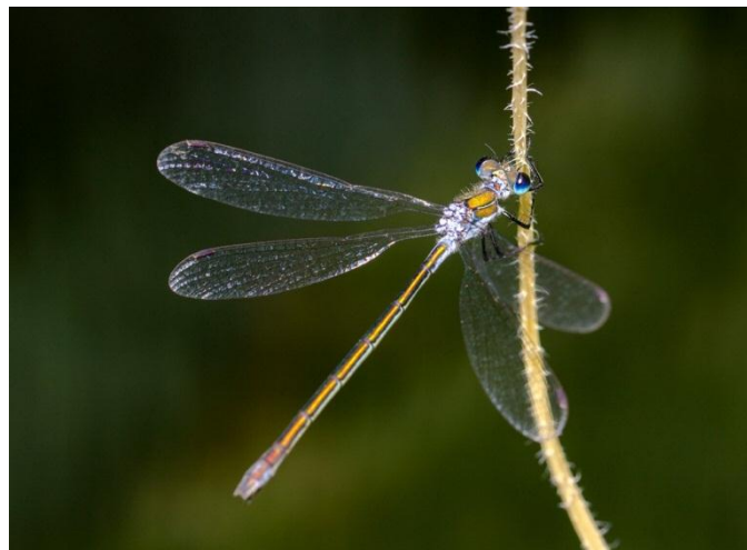
Slika 17. Lestes sponsa (Web 25)

Ovo vretence je prepoznatljivo po tamnoj boji stražnjeg dijela glave, tamnoj pterostigmi i plavkasto voštanoj boji tijela. Plav je donji dio oprsja, prvi, drugi, pa deveti i deseti zadčani kolutić mužjaka što ga čini lako prepoznatljivim među zelendjevicama. Zadčani nastavci su crni, a donji su ravni, uskih i ravnih vrhova. Kao što naziv roda upućuje (zelendjevica), ostatak zatka je zelenkast, a tu osobinu dijeli sa ženkom koja je u cijelosti zelenkasta, osim dijela oprsja i donjeg dijela zatka koji je svjetlije žućkasti. Ženka na žutoj podlozi gornje strane drugog zadčanog kolutića ima dvije zelene trokutaste mrlje. Leglica doseže do stražnjeg ruba desetog zadčanog kolutića. Veličine je 35-39 mm. Staništa pogodna za razvoj sjeverne zelendjevice gotovo su sve stajaće vode s raskošno razvijenom močvarnom vegetacijom, uglavnom u planinskim područjima. Ličinke žive uz vodeno ili močvarno bilje. Ženka leglicom buši rupe u preslicama, trsci, rogozu i sličnim biljkama kako bi u njih ubacila jajašca. Ličinke se izliježu u proljeće. Najviše jedinki možemo vidjeti u kolovozu (Belančić i sur., 2008).