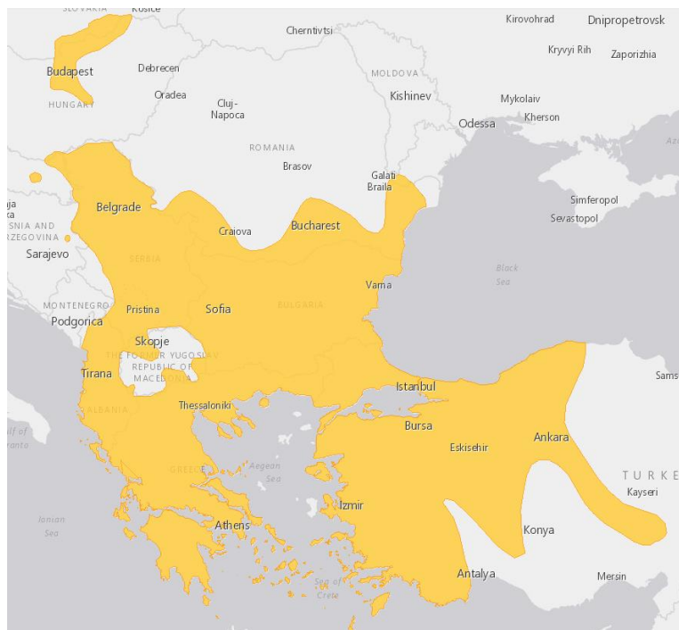
Slika 2. Okvirna distribucija A. kitaibelii i pripadajućih podvrsta (web 1)