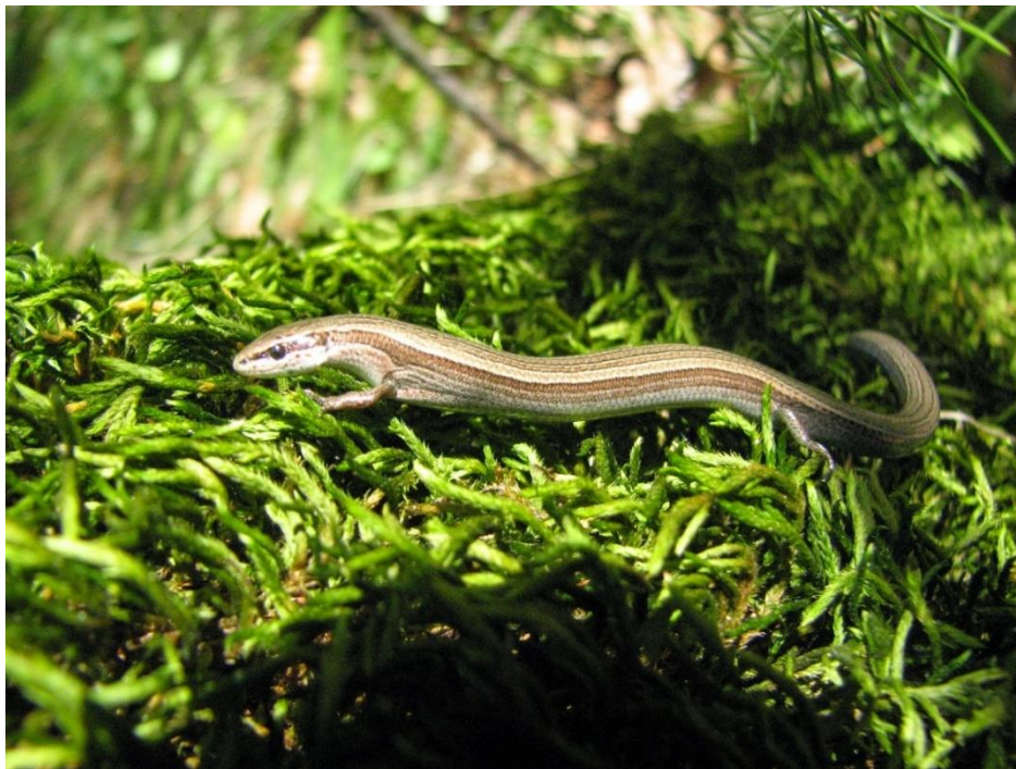
Slika 1. A. kitaibelii Turjaka (Papuk) (web 2)

zahtjeva brz bijeg, udove savije uz tijelo i zmijolikim kretnjama bježi pod lišće i gustu vegetaciju (Arnold, 2002). S dorzalne strane tijelo je brončano smeđe do metalik maslinaste boje, bez uzorka ili s malim tamnim i svjetlijim mrljama organiziranim u redove i mogu tvoriti četiri uske, isprekidane ili pune pruge. I na pileusu mogu biti prisutne tamne točkice i crtice. Od nosnica, preko oka, duž boka i djelomično na rep, sa svake strane proteže se tamna pruga, omeđena s gornje strane i djelomično s donje svjetlijom prugom. Ventralna strana je zelenkasta ili plavkasto-sivobijela (Gruber, 1981; Göçmen i sur. , 1996; Arnold, 2002). A. kitaibelii je izraziti predator širokog spektra plijena. Uglavnom se hrani sitnim člankonošcima neletačima, što je u korelaciji s njegovom veličinom i načinom kretanja (Herczeg i sur., 2007). Maksimalna starost zabilježena je kod jedinki iz zatočeništva i iznosi 3,5 godina (Arnold, 2002; Gruber, 1981).