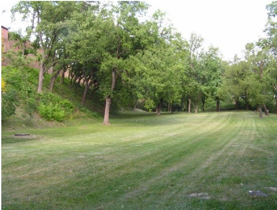
Slika 5. Stanište A. kitaibelii u Iloku (Gradski park): nepokošena padina na lijevoj strani fotografije (Szövényi i Jelić 2011)

razvijenim prizemnim biljnim slojem ( Festuca sp. , Carex sp. ). Dio obronka obrastao je invazivnim pajasenom ( Ailanthus altissima (Mill.) Swingle) i amorfom ( Amorpha fruticosa L.) što stanište čini nepogodnim za ivanjskog rovaša, a takva su i mjesta gdje se travnjačka vegetacija intenzivno kosi. Ivanjski rovaš zabilježen je u parku i na poluprirodnom staništu sa svjetlom bagremovom šumom ( Robinia pseudoacacia L.) koja ima dobro očuvani prizemni sloj biljaka (Szövényi i Jelić, 2011).