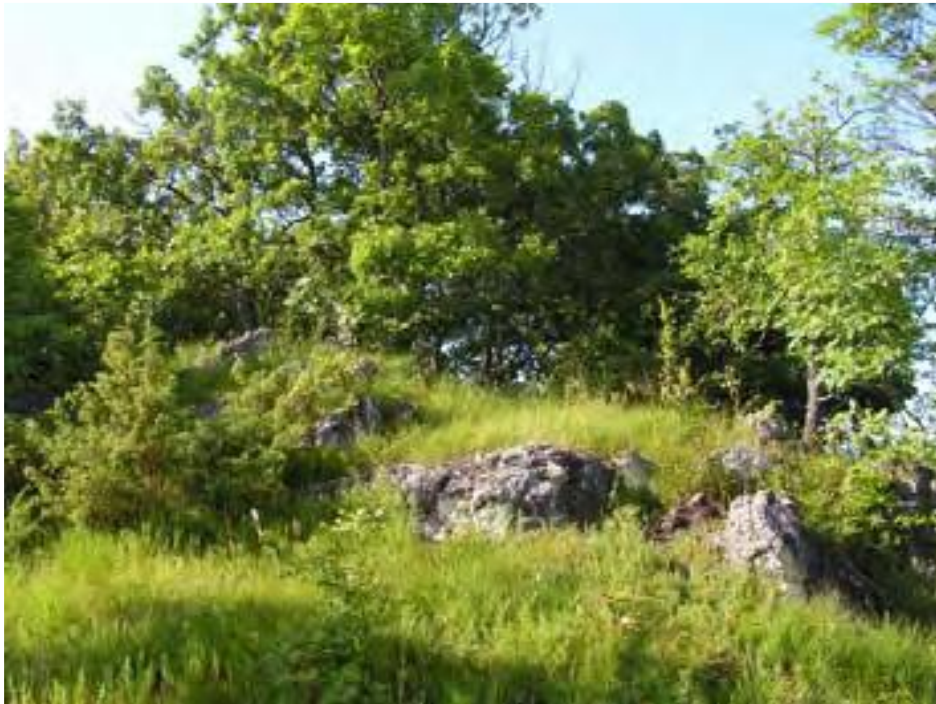
Slika 4. Stanište A. kitaibelii na Papuku (vrh Turjak) (Szövényi i Jelić 2011)

nekoliko manjih područja s dolomitnim stijenama kao supstratom u samoj blizini naselja Velika (vrhovi Turjak, Pliš i Mališćak) (Szövényi i Jelić, 2011).