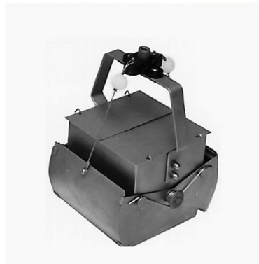
Slika 3. Eckmanovo grabilo