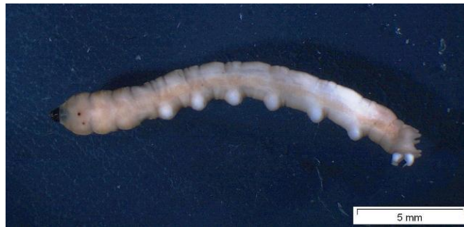
Slika 17. Epiphragma ocellare (ličinka) (web 25, 24.6.2016.,)