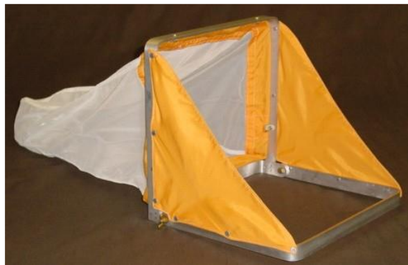
Slika 2. Surberova mreža (web 9, 24.6.2016.)