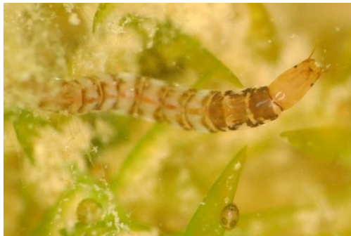
Slika 13. Ablabesmyia sp. (ličinka) (web 33, 24.6.2016.,)