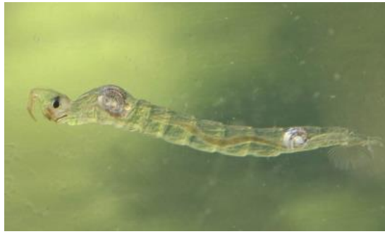
Slika 11. Chaoborus crystallinus (ličinka) (web 12, 24.6.2016.)