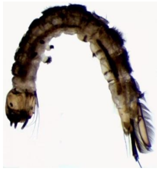
Slika 15. Dixa sp. (ličinka)