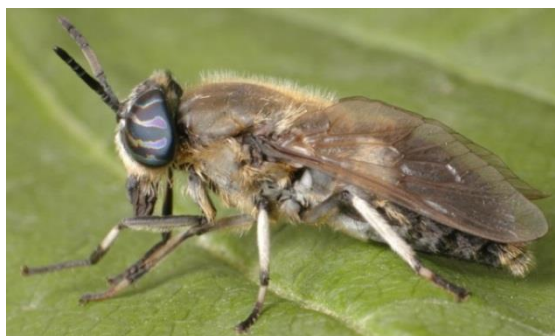
Slika 31. Heptatoma pellucens (odrasla jedinka) (web 14, 24.6.2016.)