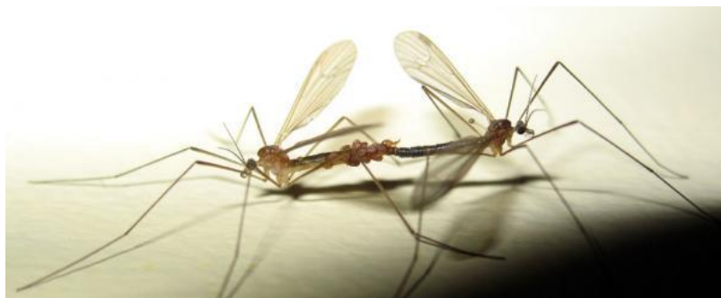
Slika 23. Ula sp. (odrasle jedinke)