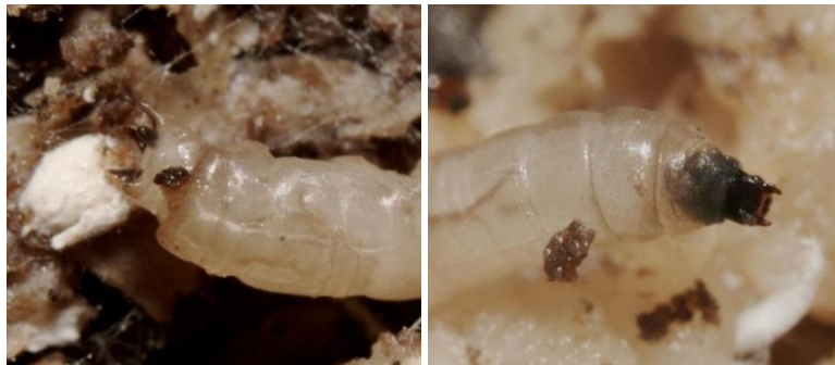
Slika 21. i 22. Ula sp. (ličinka - zadac i glava) (web 17 i 18, 24.6.2016.)