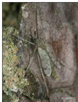
Slika 14. Ablabesmyia sp. (odrasla jedinka) (web 15, 24.6.2016.,)