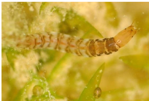
Slika 13. Ablabesmyia sp. (ličinka) (web 33, 24.6.2016.,)