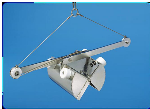
Slika 4. Van Veenovo grabilo (web 8, 24.6.2016.)