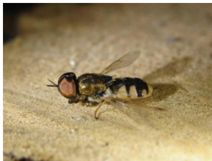
Slika 27. Odontomyia annulata (odrasla jedinka)