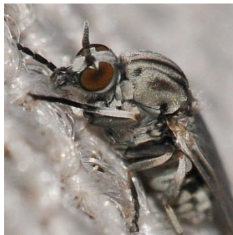
Slika 25. Simulium sp. (odrasla jedinka)