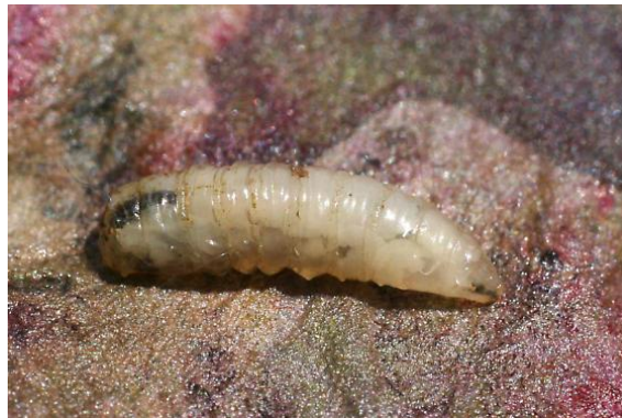
Slika 5. Pegomya sp. (ličinka) (web 2, 24.6.2016.)