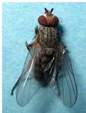
Slika 6. Pegomya sp. (odrasla jedinka) (web 4, 24.6.2016.)