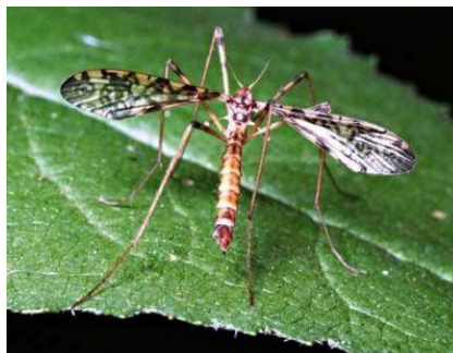
Slika 18. Epiphragma ocellare (odrasla jedinka) (web 13, 24.6.2016.,)