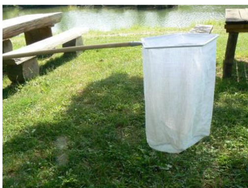
Slika 1. Bentos mreža (web 7, 24.6.2016.)