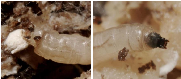
Slika 21. i 22. Ula sp. (ličinka - zadac i glava) (web 17 i 18, 24.6.2016.)