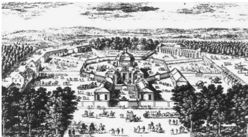
Slika 1. Versaillska menadžerija Historie des ménageries de l'antiquité `a nos jours Gustava Loisela

Mučenje životinja dugim putovanjima je jedan od problema, jer životinje moraju jesti svakodnevno, a na višemjesečnim putovanjima moglo se spremati hrane za nekoliko tjedana, tako osim što su dobivale malo hrane, mnoge su i gladovale. Iz tih razloga uvedena je praksa tovljenja životinja prije preookeanskih putovanja uz stopu preživljavanja od 50%. Mnoge su uginule od slabosti i ozljeda nastalih uslijed ljuljanja broda u olujama. Jačanjem flote širio se utjecaj Velike Britanije, Španjolske i Portugala na preookeanska područja. Životinje native u Europi otpremene su u ta područja gdje su osnovane kolonijalne menadžerije prvenstveno za izvor hrane, dok se doseljenici ne snađu u novom okolišu. Ove kolonijalne menadžerije imale su povećani negativni utjecaj na lokalni ekosustav Novog svijeta, jer jednom kada bi životinje pobjegle, pokazale bi se preagresivnima za to područje i uništavale bi lokalnu floru i faunu, izmjenjujući ravnotežu koja je postojala. Prve životinje koje su se slale iz Novog svijeta u Europske menadžerije bile su papige ( Ara macao ) 1496.g., oposumi ( Didelphis virginia ) 1500.g. i iguane ( Iguana iguana ) 1500.g., bizon ( Bison bison ) 1500.g., zamorac ( Cavia porcellus ) 1550.g., divlji puran ( Meleagris gallopavo ) i mošusna patka ( Biziura lobata ) 1520.g., sve na Španjolski dvor. Sa željom za uzgojem jednih životinja ljudi su potisnuli druge, divlje životinje.