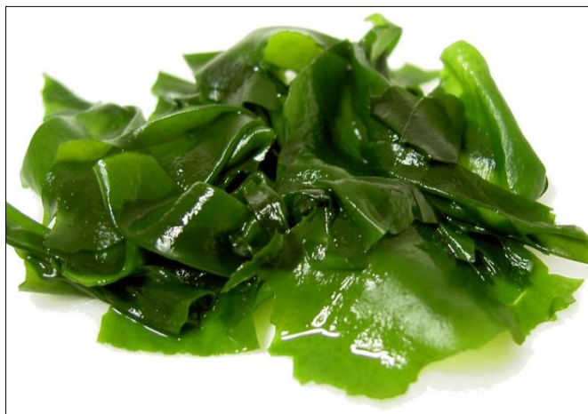
Slika 9. Undaria pinnatifida (Harvey) Suringar (web 12)

Undaria pinnatifida (slika 9) poznata kao wakame, nježno slatkastog okusa, najčešće je servirana u juhama i salatama. Prema bazi podataka globalnih invazivnih vrsta svrstana je u 100 najinvazivnijih vrsta. Istraživanja u Japanu otkrila su da spoj fukoksantin pomaže u sagorijevanju masnog tkiva (Maeda i sur., 2005). Wakame se također koristi i u salonima ljepote. Bogat je izvor eikosapentaenoične kiseline (EPA), natrija, kalcija, joda, tiamina i niacina, a u orijentalnoj se medicini koristi za pročišćavanje krvi, zdravlje crijeva, kožu, kosu te reproduktivne organe (Turner, 1996). U Japanu i Europi wakame se distribuira ili sušena ili posoljena, a najviše se koristi u miso juhi, tofu salatama i kao prilog uz salate od krastavaca najčešće u umaku od soje i rižinog octa. Ova je alga odličan izvor vitamina A, C, E, K i D te je poznata po svojim antibakterijskim svojstvima, pomaže u snižavanju visokog krvnog tlaka, ublažava srčane tegobe, osvježava i okrepljuje organizam (web 1).