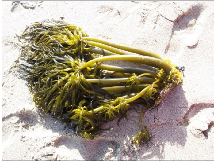
Slika 7. Postelsia palmaeformis Ruprecht (web 8)

eksperiment te je dokazano da oporavak između prikupljanja algi uvelike ovisi o dobu godine (Thompson i sur., 2007).