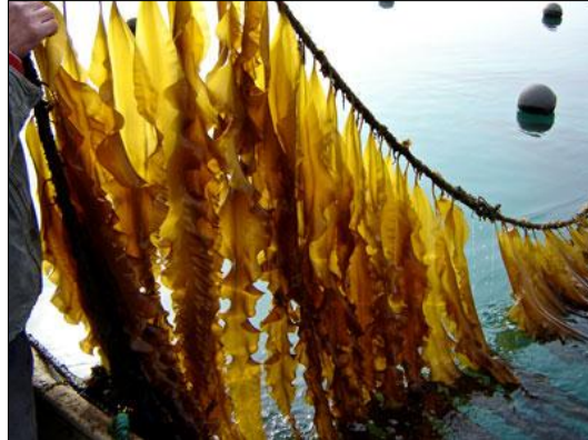
Slika 10. Saccharina japonica Druehl & G. W. Saunders (web 13)

su inače neprobavljivi u ljudskom tijelu (Bakunina i sur., 2012). Osim što pospješuje probavu, pozitivno djeluje i na živčani sustav i funkcije mozga, zatim, jača krvne žile, snižava krvni tlak, pospješuje rad jetre i štitnjače, a zaslužna je i za zdravi izgled kože (web 1).