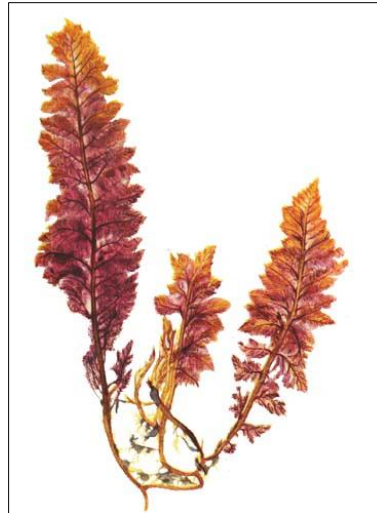
Slika 1. Asparagopsis taxiformis (Delile) Trevis. (web 9)

Asparagopsis taxiformis (slika 1) je jestiva crvena alga s Havaja, poznata po svojim esencijalnim uljima, vrlo je cijenjena zbog svoje arome i okusa te je glavni sastojak havajskih ribljih salata (web 3).