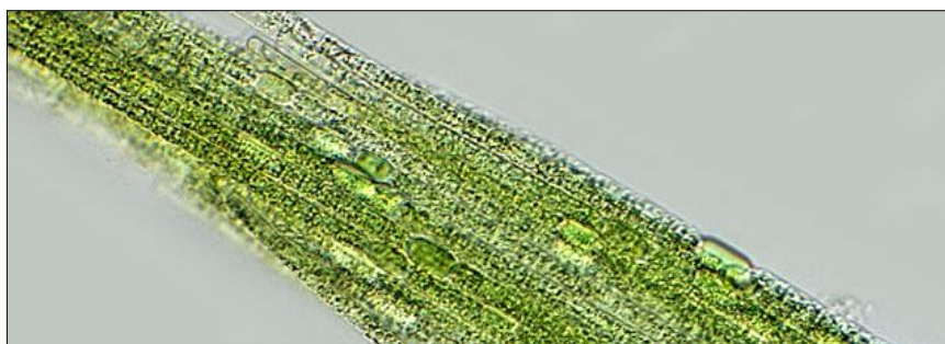
Slika 12. Aphanizomenon flos-aquae (web 16)

AFA-alga (slika 12) je slatkovodna i brakična vrsta cijanobakterije rasprostranjena diljem svijeta poznata po „cvjetanju“. Iako proizvodi endotoksine koji mogu naštetiti jetri i živčanom tkivu kod sisavaca, kanadsko istraživanje ove cijanobakterije na imunološki i endokrini sustav otkrilo je kako njeno konzumiranje ima povoljan učinak na stanice ubojice (eng. „ natural killer cells “) tako što ubrzava njihov prijenos prema bolesnim tkivima (web 15). Dostupne su kao nadomjestak prehrani u obliku tableta. Svakako bi trebalo što više istraživanja preusmjeriti na ljekovitost ove alge budući da štiti od radijacije, poboljšava pamćenje i koncentraciju te je poznati izvor željeza u organskom obliku koji se lako apsorbira u organizam (web 1).