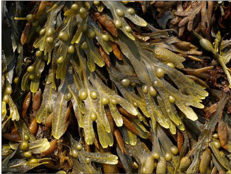
Slika 3. Fucus vesiculosus L. (web 5)

obraza s godinama povećava, a elastičnost smanjuje, ovi rezultati pokazuju da ekstrakt ove alge ima povoljno djelovanje protiv starenja kože i da se može upotrijebiti u kozmetici (Fujimura i sur. 2005).