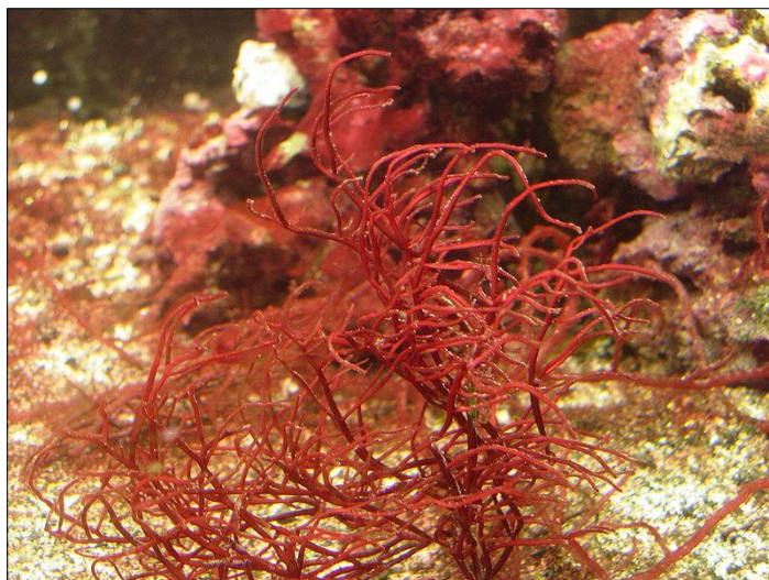
Slika 4. Gracilaria sp. (web 6)