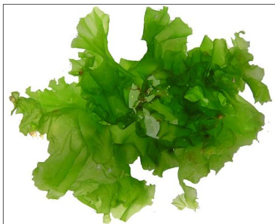
Slika 8. Ulva lactuca L. (web 11)

Ulva lactuca (slika 8) je kod nas poznatija kao morska salata. To je jestiva zelena alga koja je rasprostranjena po svim svjetskim oceanima. Konzumiraju je različite morske životinje poput morskih krava i puževa, a mnoge su vrste izvor hrane ljudima u Skandinaviji, Velikoj Britaniji, Irskoj, Kini i Japanu (ondje je poznata pod nazivom „aosa“). U prehrani ljudi priprema se sirova u salatama ili kuhana u juhi. Sadrži visok udio proteina, topljivih vlakana, raznolike vitamine i minerale te željezo. Međutim, moguća kontaminacija otrovnim teškim metalima na određenim područjima na kojima se može prikupiti čini ju opasnom za ljudsku prehranu (Yaich i sur., 2011).