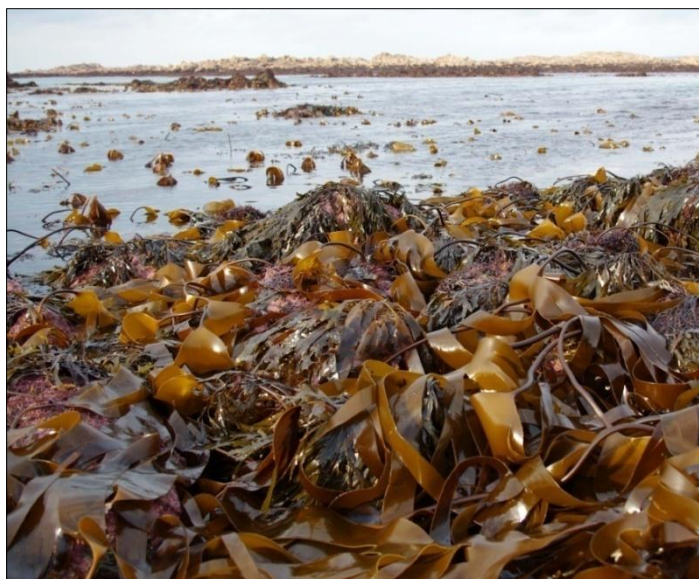
Slika 5. Laminaria digitata (Huds.) Lamouroux (web 10)

Laminaria digitata (slika 5) je smeđa alga iz porodice Laminariaceae , česta u sublitoralnoj zoni sjevernog Atlantika. Tradicionalno se koristila kao gnojivo, u 18. stoljeću koristila se u staklarskoj industriji, dok se u 19. stoljeću koristila za ekstrakciju joda. Obje namjene su prestale kada su postali dostupni jeftiniji izvori navedenih svojstava. I dalje se koristi kao organsko gnojivo, ali i za ekstrakciju alginske kiseline, u proizvodnji pasta za zube i kozmetici te u prehrambenoj industriji za zgušnjavanje i oblikovanje. U Japanu i Kini rabi se za pravljenje dashi-ja (web 7).