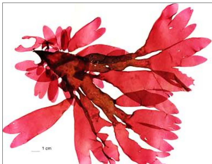
Slika 6. Palmaria palmata (L.) F. Weber & D. Mohr (web 7)

Palmaria palmata (slika 6) poznata je i pod nazivom dulska, crvena je alga sjevernih obala Atlantika i Pacifika te poznata jestiva alga s dijetalnim vlaknima na Islandu. U usporedbi s povrćem sadrži visoki udio proteina, vitamina i minerala te elemenata u tragovima važnih za ljudski organizam, a ima i svojstva pojačivača okusa i može se koristiti umjesto natrijeva glutamata koji često uzrokuje alergije (Indergaard i Minsaas, 1991). Alga se stalno konzumira u Irskoj, gdje se koristi za pripremu posebne vrste kruha, zatim, na Islandu, u Kanadi i SAD-u kao lijek i hrana. Može ju se lako nabaviti u prodavaonicama zdrave prehrane i ribarnicama ili izravnom narudžbom, a jede se sušena i sirova. Također je značajna jer sadrži jod koji sprječava gušavost.