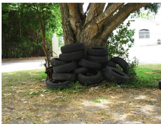
Slika 8. Rabljene gume – malo leglo