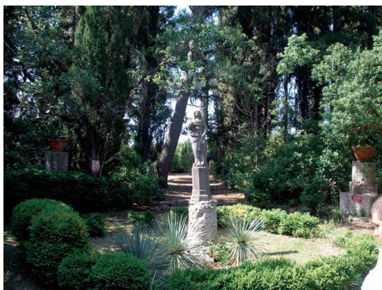
Slika 7: Kasnoromantičarsko-historicistički perivoj Drvarica, 2007. (Preuzeto i prilagođeno prema Obad Šćitaroci i Kovačević 2014)

Postupnom gradnjom perivoj se podijelio na ulazni, geometrijski i pejzažni dio koji se savršeno stopio s biljnom vegetacijom na ovom području. Terasa, vidikovci i kamena