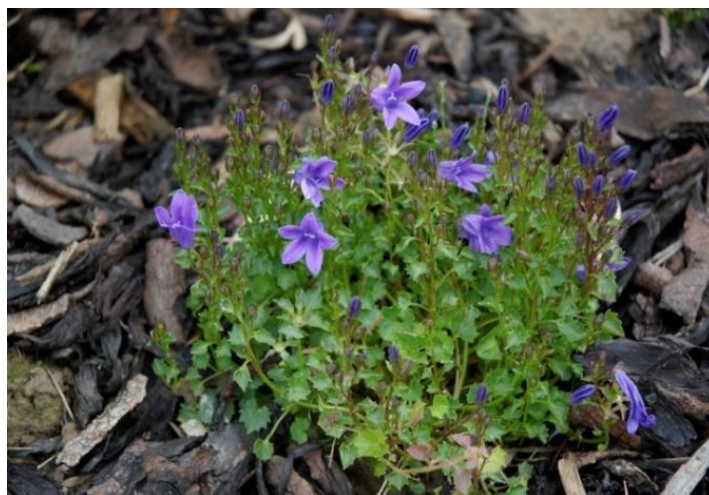
Slika 10. Campanula portenschlagiana Roem. et Schult. (Portenschlagova zvončika)