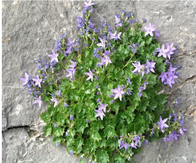
Slika 4. Campanula fenestrellata Feer ssp. fenestrellata (prozorska zvončika)