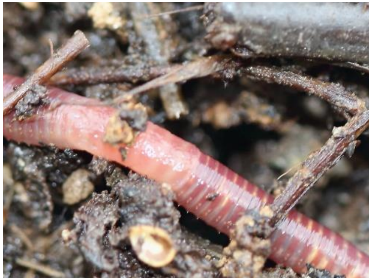
Slika 3. Eisenia fetida u svome prirodnom staništu-tlu (web 3).

Otrovni učinci ZnO-nanočestica i TiO 2 -nanočestica također su istraženi kod vrste Eisenia fetida . U prirodnom tlu, ZnO-nanočestice vrlo su toksične u suprotnosti s TiO 2 -nanočesticama. No, kada su gujavice bile izložene u pješčanim tlima, nije zabilježena nikakva toksičnost, bez obzira na vrstu nanočestica. Nakon četiri mjeseca izloženosti umjetnim tlima, na reprodukciju gujavica utjecala su obje vrste nanočestica. Toksični učinci ZnO-nanočestica bili su značajniji od učinaka TiO 2 -nanočestica (Coutris i sur., 2012).