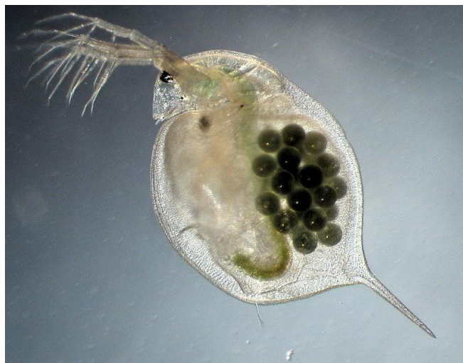
Slika 5. Velika vodenbuha Daphnia magna , slatkovodni planktonskih račić (web 5).

pokazala je nakupljanje Ti unutar probavnog trakta. Kad je izloženost bila kronična, rast i reprodukcija su se smanjili. (Exbrayat i sur., 2015.)