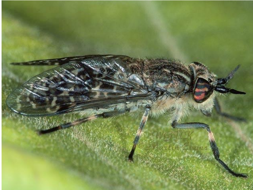
Slika 9. Haematopota crassicornis (Web 5)