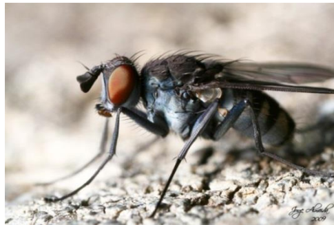
Slika 20. Limnophora riparia (odrasla jedinka)