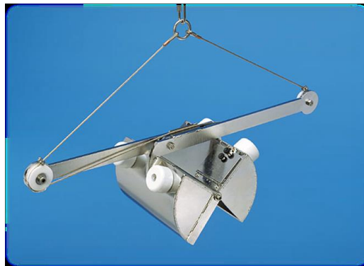
Slika 4. Van Veenovo grabilo (web 8, 24.6.2016.)