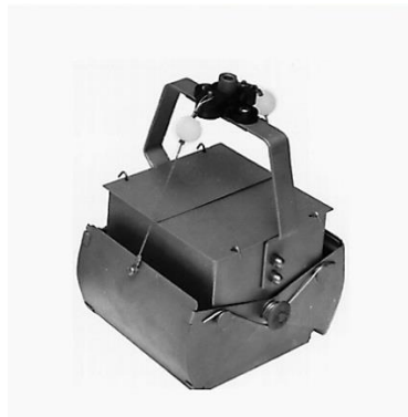
Slika 3. Eckmanovo grabilo (web 35, 24.6.2016.)