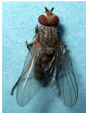
Slika 6. Pegomya sp. (odrasla jedinka) (web 4, 24.6.2016.)