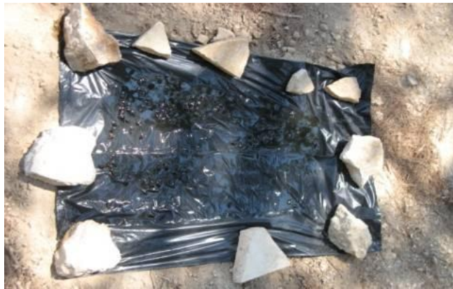
Slika 8. Sjajna crna plastična uljna klopka

Tijekom uzorkovanja obada 2013. godine na otoku Korčuli istraživala se učinkovitost Manitoba klopke, male modificirane Manitoba klopke i tzv. sjajne crne plastične uljne klopke (Slika 8.) (Krčmar, 2013). Uljna klopka sastavljena je od plastične crne folije, 80 x 55 cm, i na njoj se nalazi žuto jestivo ulje oko 0.5 do 1 cm debljine. Klopka je bila položena na tlu i pričvršćena sa kamenjem na rubovima. Tijekom istraživanja najveći broj obada bio je uzorkovan pomoću uljne klopke na koju se hvataju ženke i mužjaci obada po čemu se ona razlikuje od svih ostalih klopki. Najmanji broj obada bio je pronađen u malim modificiranim Manitoba klopkama (Krčmar, 2013).