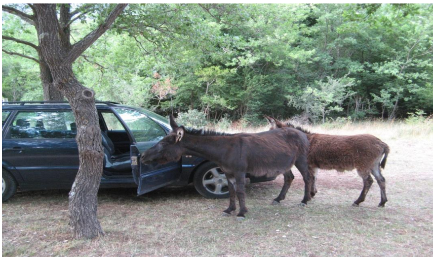
Slika 9. Automobil-tovar klopka

Postoji tzv. automobil-tovar klopka (Slika 9.) gdje je magarac privezan kraj auta na kojem su otvorena vrata. Magarac privlači obade ugljikovim dioksidom koji izdiše, oni ulijeću u auto, brzo zatvorimo vrata kad ih veći broj uleti unutra sjednemo u auto i hvatamo ih rukom.