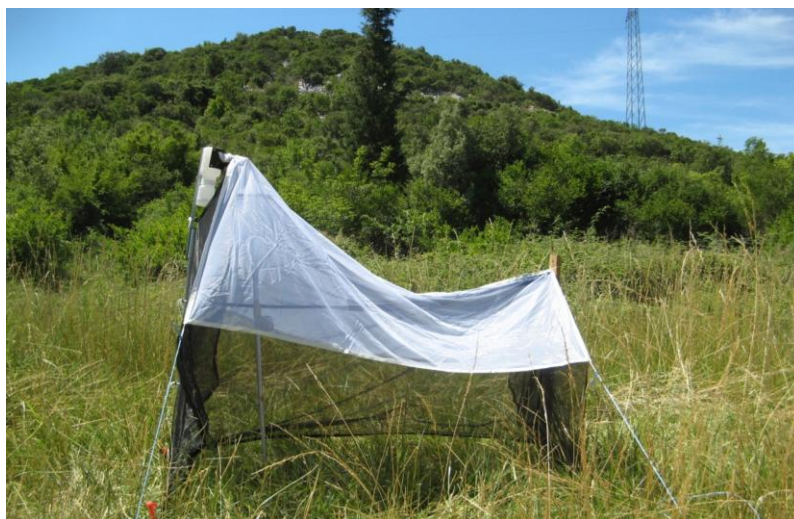
Slika 11. Šator klopka