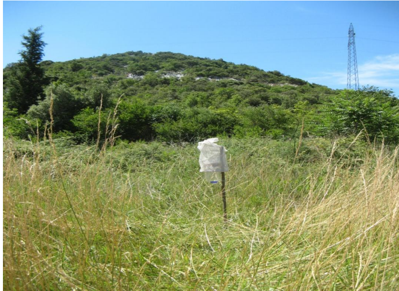
Slika 12. Boca klopka