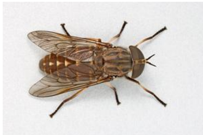
Slika 4. Imago obada (Web 3)

Mužjaci obada hrane se nektarom. Epidemiološki su značajne samo ženke koje se hrane krvnim obrokom prije svakog polaganja jaja. Takve ženke su anautogene (Krčmar i sur. 2002). Nakon trećeg polaganja jaja anautogene ženke ugibaju. Autogene ženke su one vrste koje se kao i mužjaci hrane nektarom prije svakog polaganja jaja. Nakon drugog polaganja jaja i ishrane nektarom autogene ženke ugibaju. Velike ženke napadaju izravno žrtvu, dok ženke manjih veličina kruže leteći oko žrtve neposredno prije uzimanja krvnog obroka. Hranjenjem ženke povećavaju 2 do 3 puta svoju tjelesnu težinu (Chvála i sur. 1997).