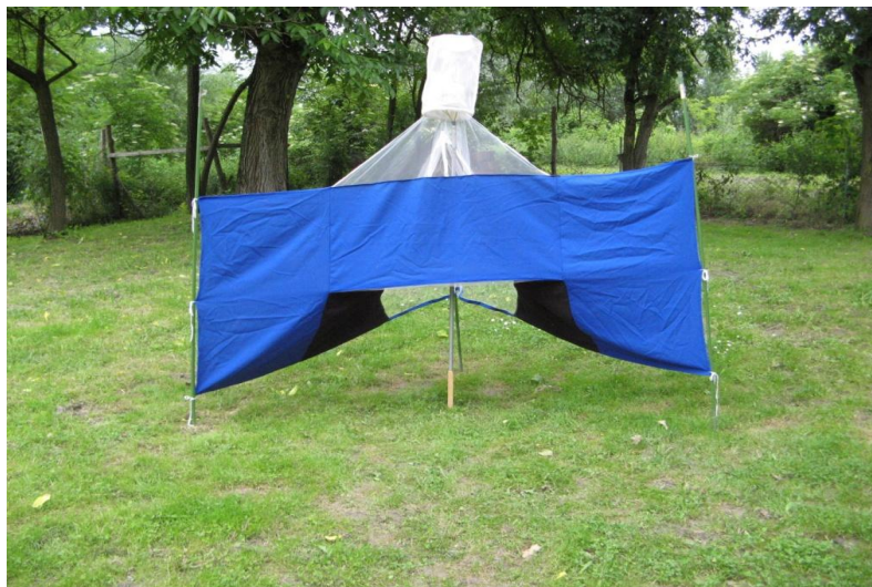
Slika 10. Nzi klopka