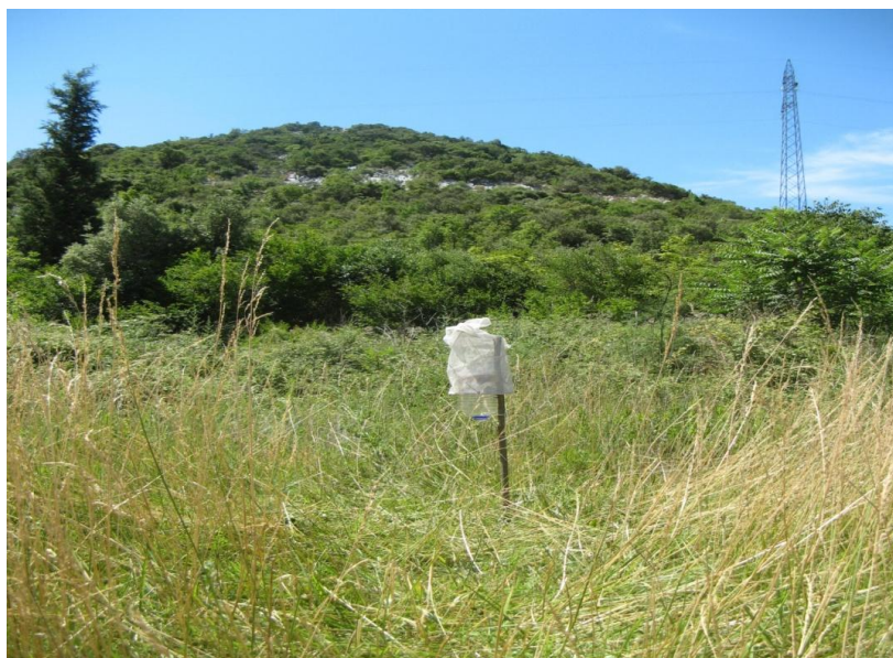
Slika 12. Boca klopka