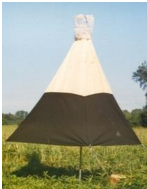
Slika 6. Manitoba klopka

Modificirana Manitoba klopka je ručne izrade, napravljena po nacrtu Hribara i suradnika 1991., godine. Ona je crno-bijele boje, izrađena od sintetičke tkanine (98% poliester, 2% viskoza). Osnovni dio klopke je sakupljački šator i sakupljačka kapa. Klopka je izrađena poput četverostrane piramide. Donji dio sakupljačkog šatora je crn, visine 80 cm, a gornji dio je bijele boje i također visok 80 cm. Dakle visina sakupljačkog šatora je 160 cm. Baza svake stranice sakupljačkog šatora je 110 cm, tako da je površina donjeg ulaznog otvora sakupljačkog dijela klopke (šatora) 120 \text{ cm}^2 , a on je postavljen 80 cm iznad tla (Kopi, 2006). Sakupljački dio klopke (šator) završava okruglim izlaznim otvorom promjera 20 cm, na koji se kao i kod Malezovih klopki postavlja sakupljačka kapa koja je za 2 cm veća od promjera izlaznog otvora, tako da se može lako postaviti i skinuti s vrha sakupljačkog dijela klopki (šatora) (Kopi,2006). Načinjena je od metalne konstrukcije u obliku lijevka te obložena prozirnom tkaninom bijele boje koja se na vrhu može odvezati prilikom pražnjenja klopke. Napravljena isto kao i kod Malezovih klopki. Nosač u koji se postavlja bočica s atraktantom postavljen je 30 cm ispod izlaznog otvora sakupljačkog dijela klopki. Klopka je pričvršćena pomoću noseće metalne konstrukcije koju čini metalna cijev u dva dijela, svaki visine 110 cm. Gornji dio metalne cijevi učvršćen je za gornji otvor sakupljačkog šatora dok je donji dio pričvršćen u tlu (Slika 6).