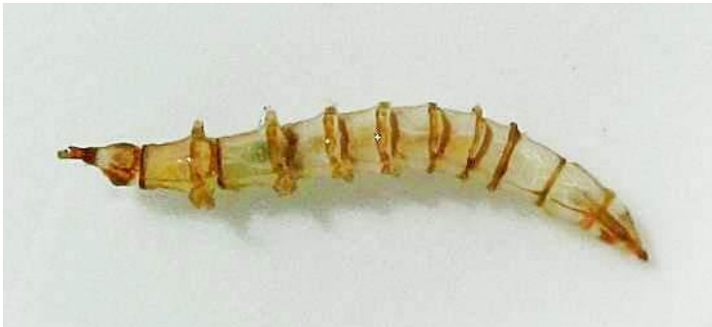
Slika 2. Ličinka obada (Web 1)

Obadi prolaze potpunu metamorfozu koja uključuje jaje, ličinku, kukuljicu i imago. Četiri do sedam dana nakon hranjenja krvnim obrokom ženka obada polaže jaja u blizini vodenih površina na listove ili stabljike različitih biljaka. Obadi polažu oko 400 do 1000 jaja većinom u cjelovitim hrpama, u obliku piramide ili okruglih pločica (Chvála i sur. 1997). Oblik, veličina i boja jaja ovisi o vrsti. Nakon osam do deset dana nakon polijeganja jaja, ako vremenski uvjeti to dozvole, iz jaja se razvijaju ličinke (Slika 2). One su vretenastog oblika sa zašiljenim krajevima te se sastoje od 12 kolutića i glave (Krčmar, 1998). Nakon 11 do 12 mjeseci iz ličinke se razvije kukuljica koja je slična kukuljici leptira i cilindričnog je oblika (Slika 3). Stadij kukuljice traje od 5 do 28 dana ovisno o temperaturi. Iz kukuljice se razvije odrasla jedinka imago (Slika 4), a nakon 2 do 3 sata sposobna je za let (Chvála i sur. 1997).