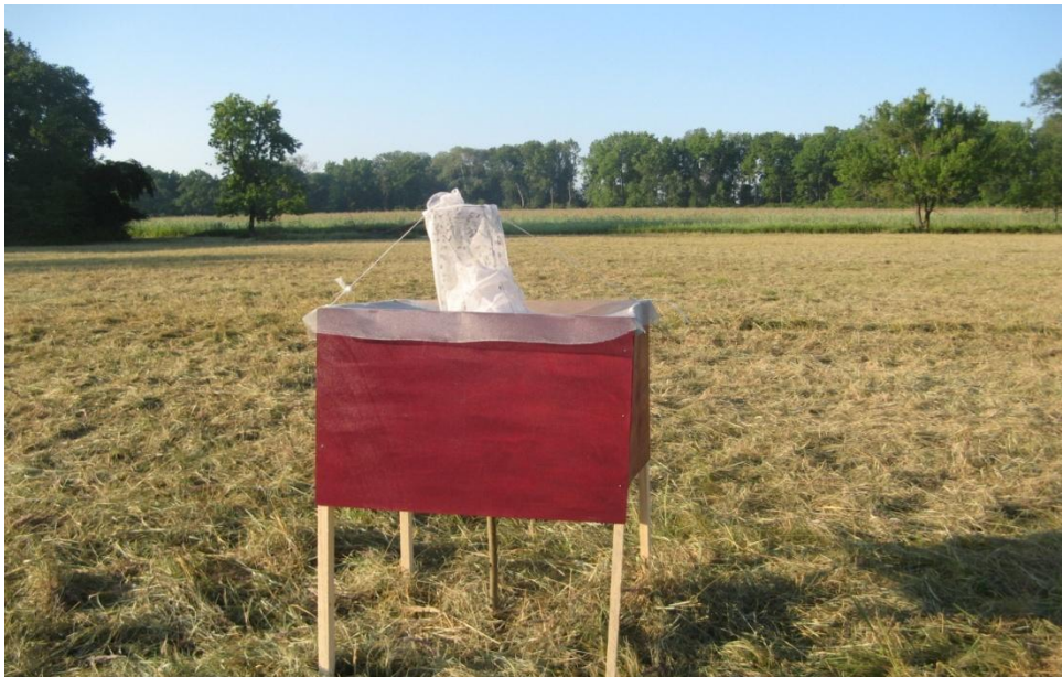
Slika 7. Crvena modificirana kutija klopka

Osim Malezovih i Manitoba klopki postoje i brojne druge koje se mogu koristiti prilikom uzorkovanja obada (Tabanidae). Jedna vrsta klopki je modificirana kutija klopka (Slika7) (Krčmar i sur. 2014). To je četverostrana kutija koja je izgrađena od šperploča 80 x 60 cm. Nalazi se na četiri letve 80 cm iznad tla. Otvorena je s donje strane, a na vrhu iznad otvora nalazi se sakupljačka mrežica u koju se hvataju obadi. Tijekom istraživanja na lokalitetu šuma Monjoroš, Zmajevac (Krčmar i sur. 2014), obadi su se uzorkovali sa deset različito obojanih modificiranih kutija klopki. Klopke su međusobne bile udaljene 20 m, a koristila se crna modificirana kutija klopka, bordo, zelena, crvena, plava, smeđa, žuta, svijetlo ljubičasta, bijela i narančasta. U svim klopkama bio je isti atraktant, octenol. Nakon provedenog istraživanja moglo se uočiti da su klopke obojane tamnijim bojama bile učinkovitije. One su privukle više obada nego klopke obojane svjetlijim bojama. Crna modificirana kutija klopka uzorkovala je najveći broj obada, iza nje slijedi smeđa pa bordo, crvena, plava, zelena, svijetlo ljubičasta, bijela, narančasta, a najmanji broj obada bio je u žutoj modificiranoj kutiji klopki (Krčmar i sur. 2014).