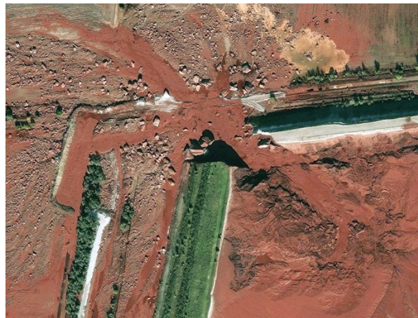
Slika 1: Satelitski snimak izlaska crvenog mulja kroz oštećeni bazen (Web 1)

Crveni mulj korišten u ovome radu potječe sa dvije lokacije. Jedan uzorak potječe iz Obrovca, propale tvornice aluminija "Jadral", a drugi potječe iz Mađarske, grada Ajka, u kojem se 2010. dogodilo pucanje bazena sa pohranjenim crvenim muljem i lužinom, što je izazvalo ekološku katastrofu.