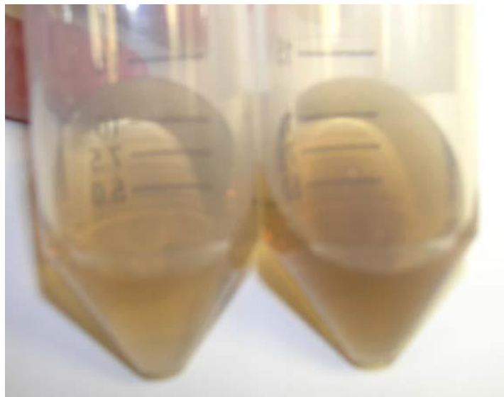
Slika 2: Izolirani supernatant sa proteinima metodom TG ekstrakcije (Web 2)