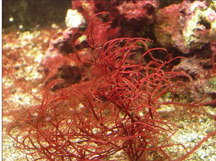
Slika 4. Gracilaria sp. (web 6)