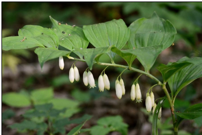
Slika 9. Širokolisni Salamunov pečat

Širokolisni Salamunov pečat je trajnica s podzemnim podankom. Stabljika biljke može doseći visinu i do 100 cm, a nosi izmjenično raspoređene listove na kratkoj peteljci. Listovi su eliptičnog ili jajolikog oblika, ušiljeni i cjelovitog ruba. Ocvijeće biljke građeno je od 6 listova koji su često srasli. Cvjetovi su pravilni, bijeli i bez mirisa. Cvjetne stapke biljke su mekano dlakave. Plod biljke je bobica crnomodre boje (Domac, 1989; Nikolić, 2016). Cvjeta od travnja do lipnja. Vrsta je ugrožena zbog uništavanja staništa sječom šuma u pojedinim, posebno prigradskim područjima (Nikolić i Topić, 2005).