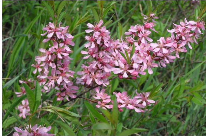
Slika 4. Patuljasti bademić

2003). Na području Hrvatske do sada je pronađena samo na suhom stepolikom travnjaku u Bilju (Nikolić i Topić, 2005).