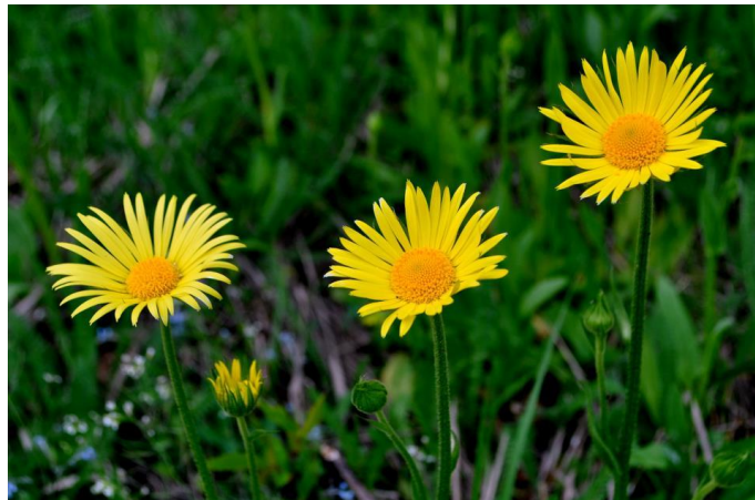
Slika 3. Mađarski divokozjak

Mađarski divokozjak (Slika 3) pripada porodici glavočika (Asteraceae). Prema životnom obliku je hemikriptofit. Naseljava suhe stepske travnjake. Prisutan je u zemljama srednje i jugoistočne Europe (Tomović i sur., 2003). U Hrvatskoj je jedino zabilježen na suhom stepolikom travnjaku na biljskom groblju (Nikolić i Topić, 2005).