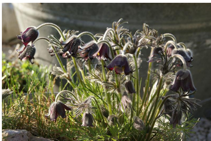
Slika 2. Crnkasta sasa

Crnkasta sasa (Slika 2) pripada porodici žabnjaka (Ranunculaceae). Prema životnom obliku je geofit. Nastanjuje suhe travnjake i pijeske (Nikolić i Topić, 2005). Rasprostranjena je u zemljama srednje i istočne Europe, a u Hrvatskoj dolazi samo na nekoliko lokaliteta - na Đurđevačkim pijescima, Žumberačkom gorju, u Hrvatskom zagorju, Istri, Međimurju i istočnoj Slavoniji (Šegota i Posavec Vukelić, 2008).