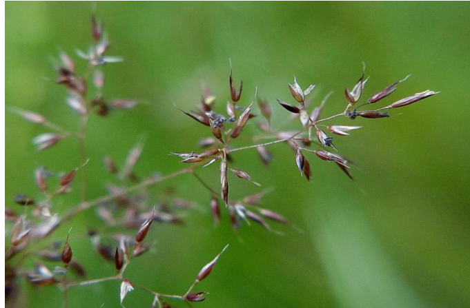
Slika 5. Pasja rosulja

Pasja rosulja je trajnica. Ima člankovitu stabljiku koja nosi linealne, cjelovite listove s paralelnom nervaturom i bez peteljke. Cvjetovi pasje rosulje su dvospolni i skupljeni u cvatove, rahle i produžene metlice. Pljevice su duge 2 mm, a obuvenac ima bodlju (Domac, 1989). Biljka cvjeta od lipnja do kolovoza (Nikolić, 2016).