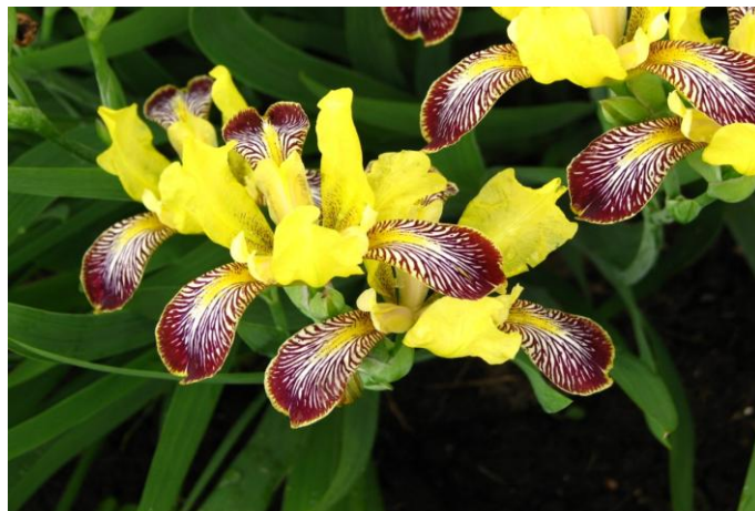
Slika 6. Šarena perunika

Šarena perunika (Slika 6) pripada porodici perunika (Iridaceae). Prema životnom obliku je geofit (Nikolić, 2016). Raste u kserotermnim šumama i uz šumske rubove. Rasprostranjena je u zemljama srednje i jugoistočne Europe (web 9). U Hrvatskoj je osim na biljskom stepolikokom travnjaku, zabilježena i na Banskome brdu, u Parku prirode Papuk, Požeškoj kotlini i okolnom gorju, na Velebitu i brdskom području Gorskog kotara (Nikolić, 2016).