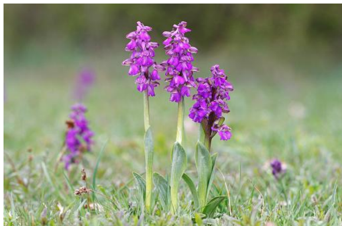
Slika 7. Mali kaćun

Mali kaćun (Slika 7) pripada porodici orhideja (Orchidaceae). Prema životnom obliku je geofit, a naseljava pašnjake, livade i pijeske (web 11). Raste u zemljama srednje i južne Europe te zapadne Azije (web 12) i široko je rasprostranjen na području Hrvatske (web 13).