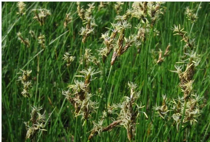
Slika 8. Rani šaš

Rani šaš (Slika 8) pripada porodici šiljevica (Cyperaceae). Prema životnom obliku je hemikriptofit, a naseljava livade i pašnjake. Raste na području Europe i zapadne Azije osim na krajnjem sjeveru i Britanskim otocima (web 15). Rasprostranjen je u središnjoj i istočnoj Hrvatskoj (Nikolić, 2016).