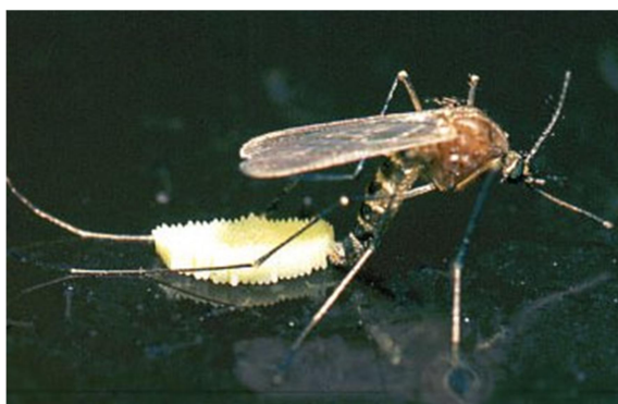
Slika 2. Ovipozicija ženke komarca

Otprilike dva do četiri dana nakon krvnog obroka, ženke polažu između pedeset i petsto jajašaca. Pri polaganju jajašaca ženke stoje na vodenoj površini tako da im stražnje noge zauzimaju V-oblik, a zatim se jajašca ispuštaju kroz genitalni otvor (Barr, 1958). Ovisno o vrsti jaja se polažu u nakupinama ili pojedinačno (Clements, 1992). Za razliku od navedenih, poplavni komarci, kao što su oni iz roda Aedes i Ochlerotatus , jaja ne polažu na vodenu površinu nego na tlo koje će kasnije biti poplavljeno (Slika 2). Supstrat na koji polažu jaja mora biti dovoljno vlažan budući da su ona iznimno osjetljiva na gubitke vode prije nego se formira voštani sloj serozne kutikule. Kako bi se izlegle ličinke naknadno je potrebna određena količina vode (Horsfall i sur., 1973), a poželjno je i da se u blizini nalaze odrasli komarci koji bi štitili ličinke od možebitnih predatora (Clements, 1992). Ovakav način ovipozicije ima prednost nad uobičajenim u razdobljima kada vode na nekom području trenutno nema, ali će je kroz neko vrijeme biti.